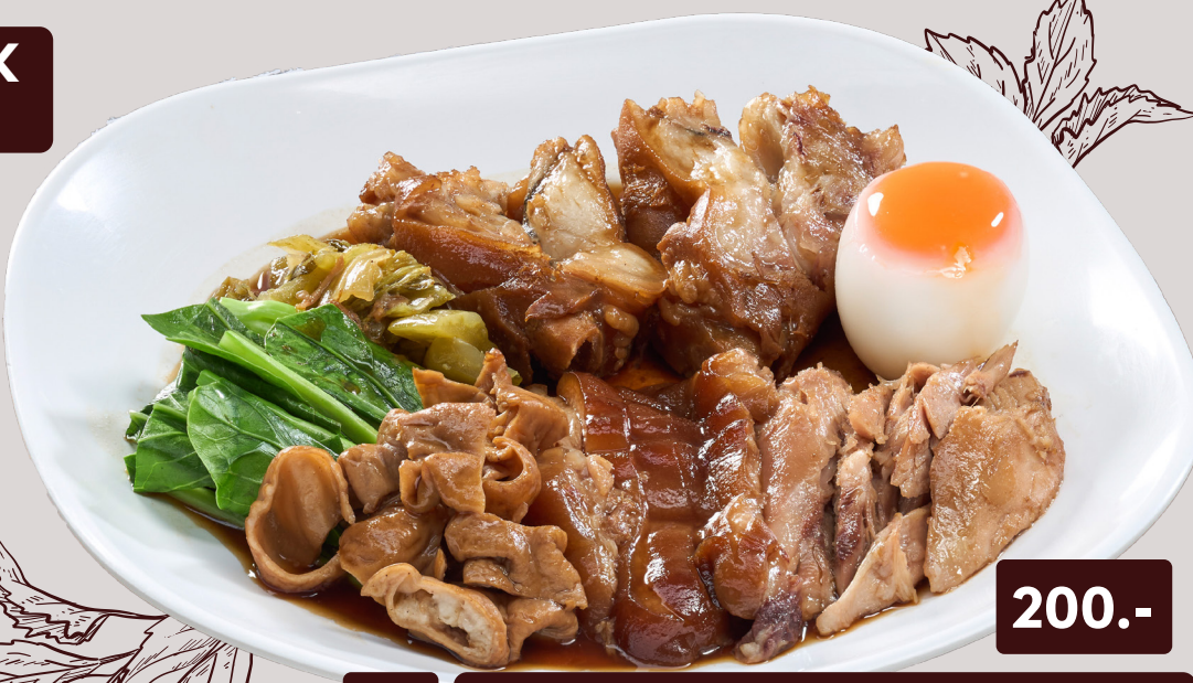
7 STEWED PORK HOCK + STEWED PORK KNUCKLE + CHITTERLINGS + EGG