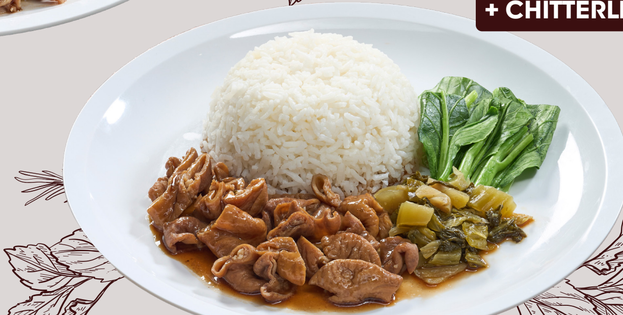
4 CHITTERLINGS SERVED WITH RICE