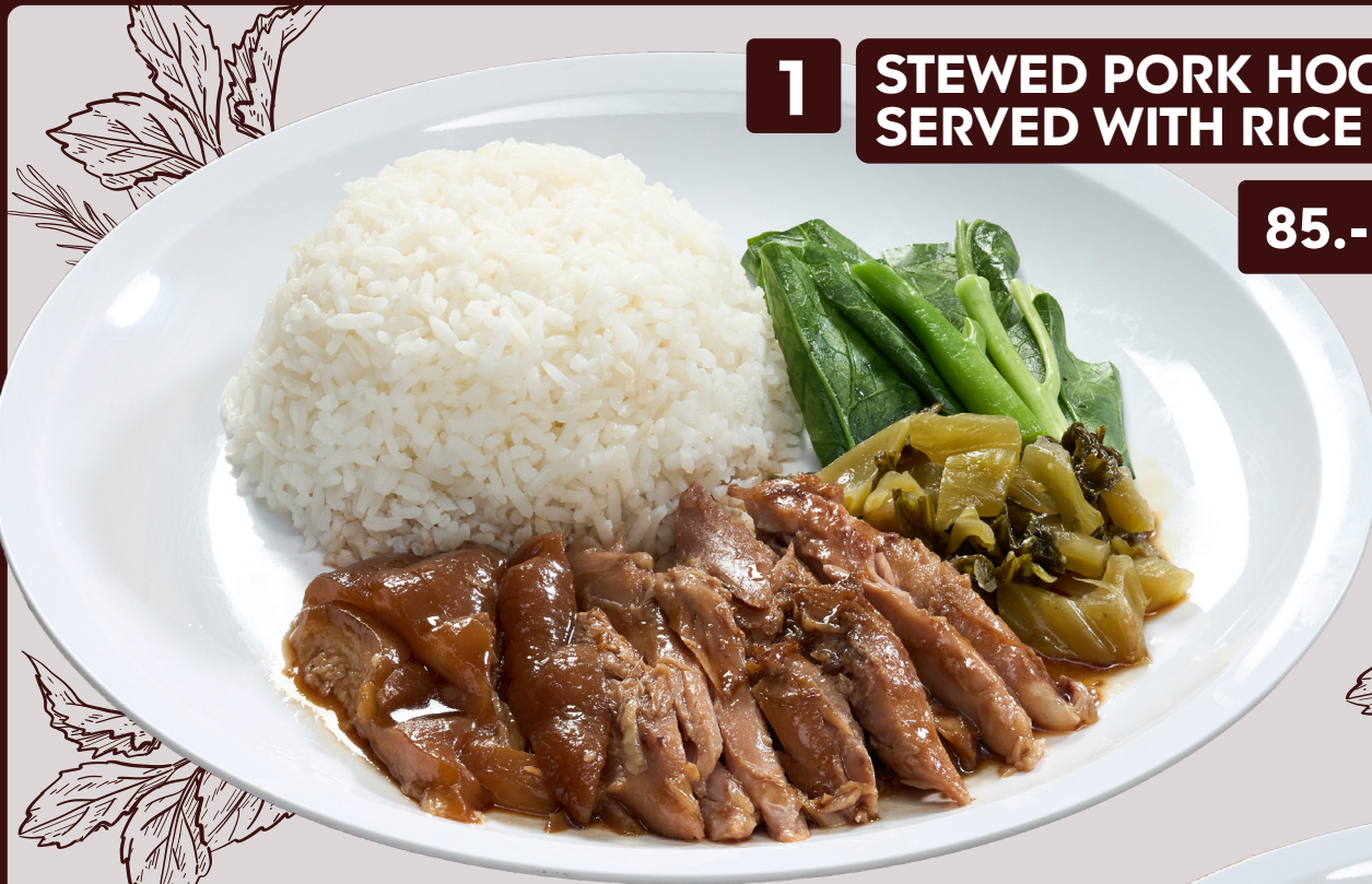
1 STEWED PORK HOCK SERVED WITH RICE