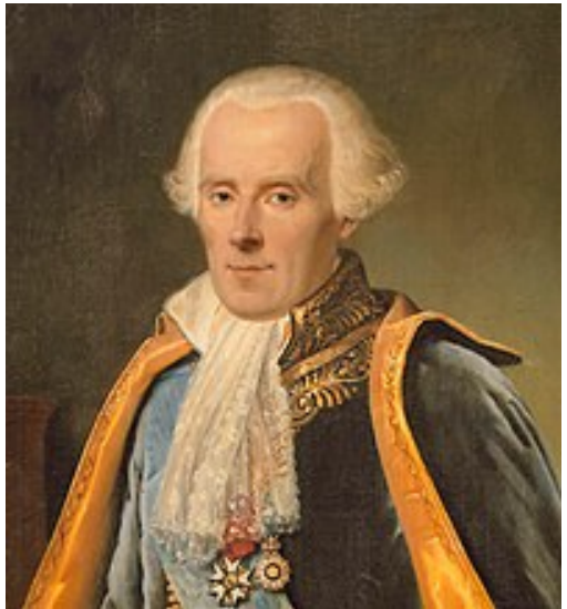
Figura 2.1: Pierre-Simon Laplace – Retrato póstumo, por Madame Feytaud, 1842

É até hoje recordado como um dos maiores cientistas de todos os tempos, muitas vezes chamado de Newton francês ou Newton da França, com uma excepcional capacidade matemática natural quando confrontado com os matemáticos de sua época.