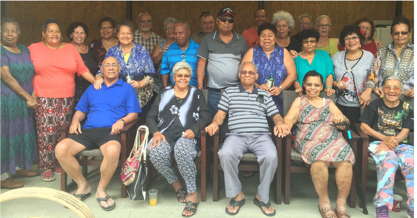
Einige der letzten Unserdeutsch-Sprecher in Brisbane, Queensland (Foto: Péter Maitz, 2016).