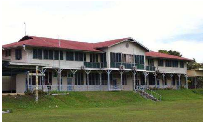
Das Hauptgebäude der Missionsstation Vunapope heute (Foto: Péter Maitz, 2014).

Unserdeutsch diente dabei offenbar stark identitätsstiftend und dem Ausdruck der Solidarität untereinander, teilten die Waisenkinder doch ein schweres gemeinsames Schicksal. Schon aufgrund ihrer Hautfarbe saß die Gruppe zwischen den Fronten deutscher Missionare und der indigenen Bevölkerung, von beiden Seiten als nicht dazugehörig, ja minderwertig betrachtet. So diente Unserdeutsch frühzeitig in erster Linie als Ingroup-Sprache, konnte sich damit einhergehend rasch stabilisieren und erfüllte dabei auch komplexere Funktionen. Eine seltene Besonderheit, denn die meisten Kreolsprachen dienen in ihrer Entstehungsphase – dem Pidgin-Stadium, in dem die Sprache noch nicht die Erstsprache einer Sprechergemeinschaft ist – als Verkehrssprache nur der rudimentären Kommunikation zwischen ethnisch verschiedenen Gruppen. In ko-