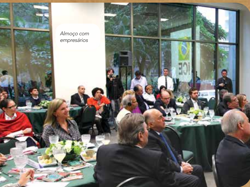
Almoço com empresários