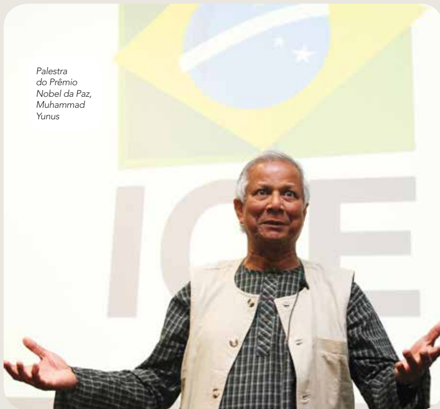
Palestra do Prêmio Nobel da Paz, Muhammad Yunus