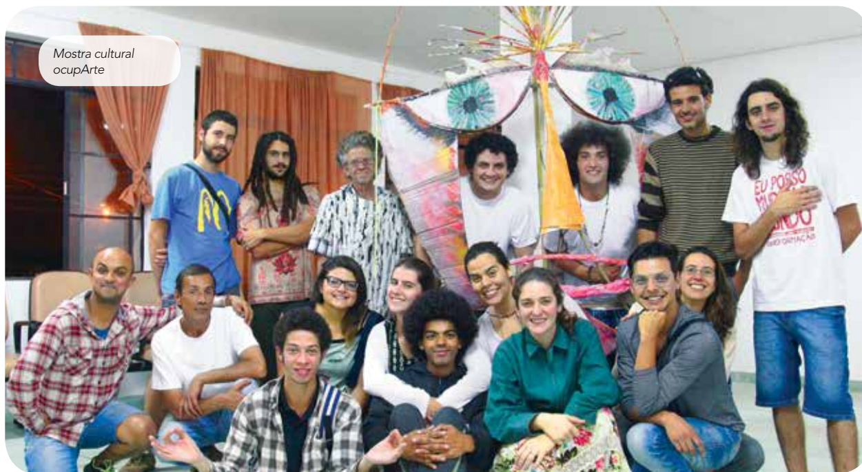
Mostra cultural ocupArte

Intervenção realizada pelo ICE em conjunto com o programa Geração Muda Mundo, da Ashoka Brasil, com o objetivo de formar jovens em empreendedorismo