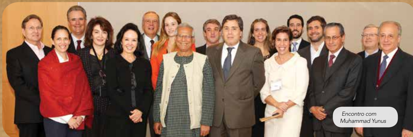
Encontro com Muhammad Yunus

O ICE realizou em 2013 um movimento de grande importância na construção do futuro de suas atividades. Pela primeira vez, em 14 anos de história, o Instituto abriu o seu quadro de associados à entrada de novos membros. Tratou-se de iniciativa que visa contemplar a realidade atual da organização, marcada por um novo posicionamento estratégico que privilegia a atuação no campo das Finanças Sociais e dos Negócios Sociais, e responder aos desafios assumidos pela organização para os próximos anos.