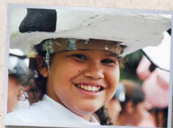
"A gente faz atividades aqui, aprende coisas novas, joga bola, vai pra sala de informática... Faz um monte de coisas!" - Crianças participantes da Educação Integral