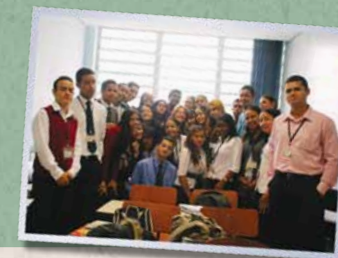
"Tem muitas coisas para fazer ou ser, muitas opções de trabalho, existem vários caminhos, agora é escolher um e seguir." - Jovem participante da Educação Profissional