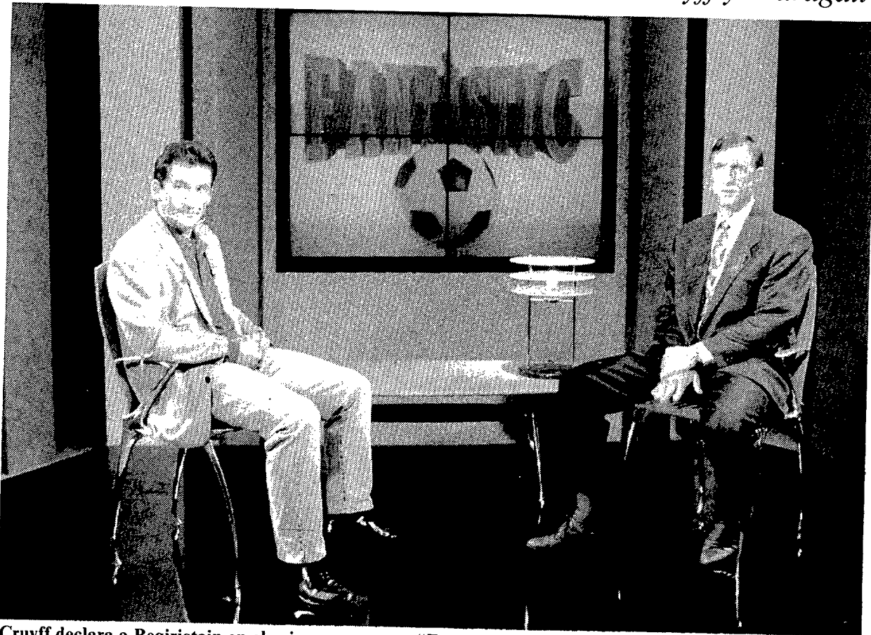
Cruyff declara a Begiristain en el primer programa: "Estoy convencido de que ganaremos la Liga"

"Fantàstic" empieza en TVE2 con entrevistas a Cruyff y Maragall