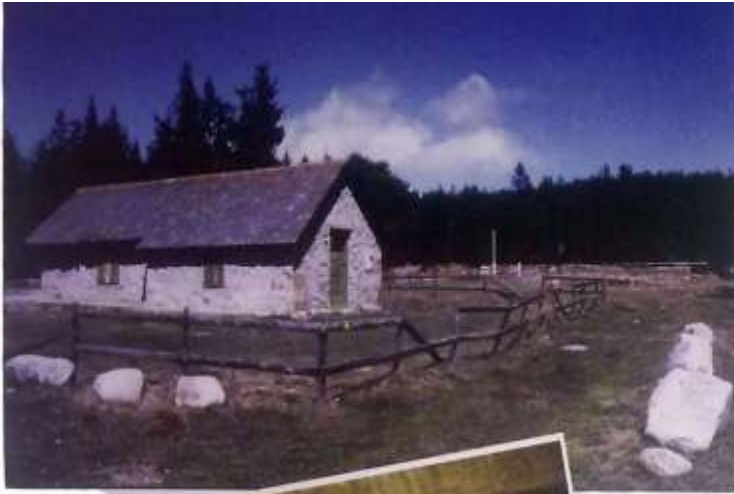
Photo 1 : Le chalet maçoné de la fruitière du Barrès aujourd'hui. A l'arrière-plan sur la droite, entre les pins et la barrière de bois, se trouvaient l'étable dont on voit encore une assise et le chalet en bois