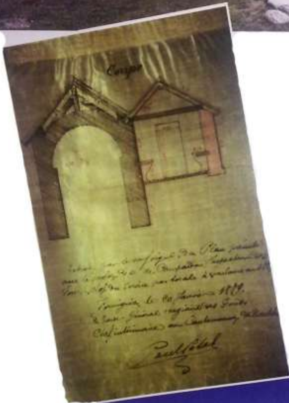
Photo 2 : Projet d'adjonction de la laiterie au chalet de la fruitière (1889) : coupe des deux bâtiments (7M 850)