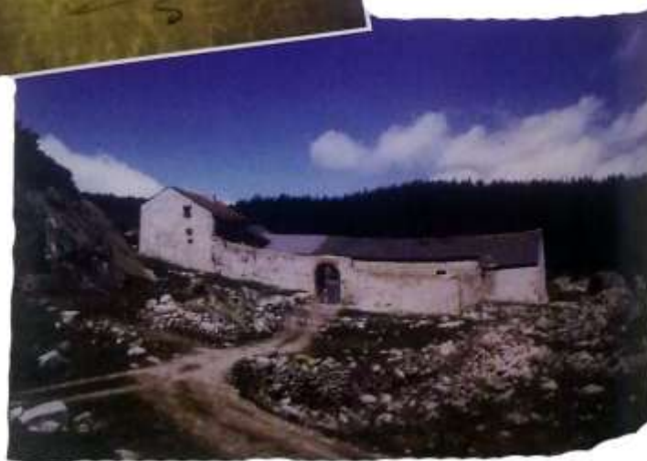
Photo 3 : les bâtiments de la Borda d'en Girvès