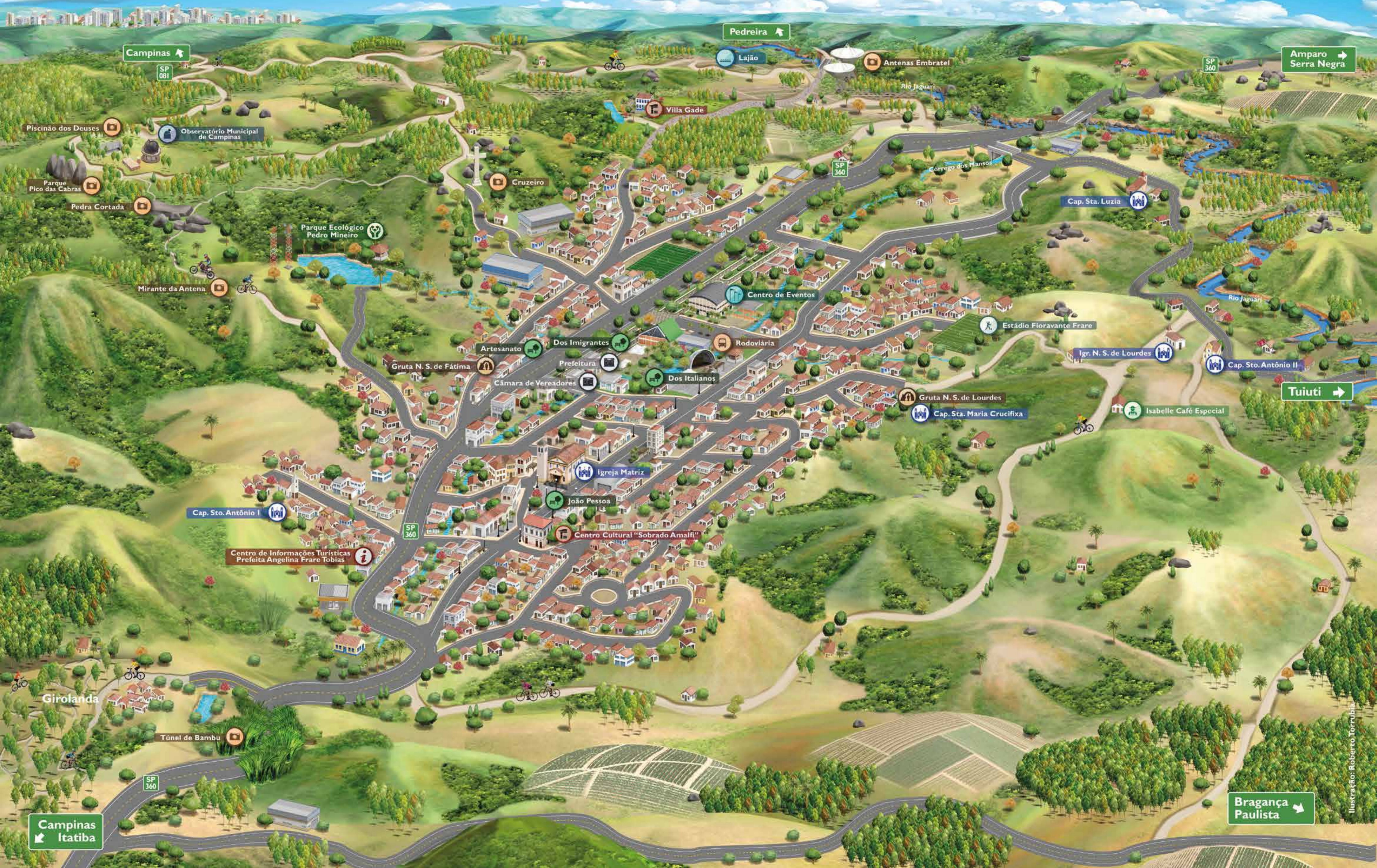
Ilustração: Roberto Torrubia