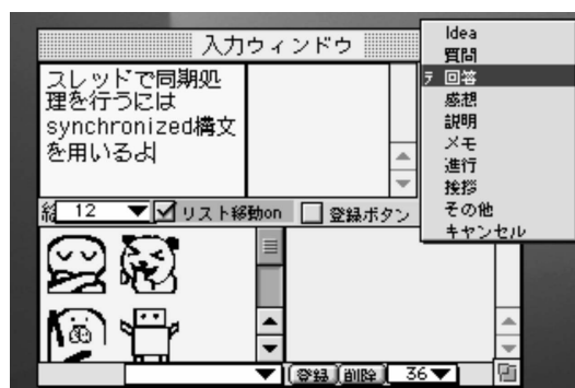
図 2 セマンティックチャットのインタフェース 11)