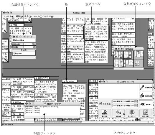
図3 分散協調型 KJ 法支援システム KUSANAGI の利用画面例 Fig. 3 An example screen of KUSANAGI.

<action> <who>野田</who> <when>3176897627</when> <data>清水寺の入り口付近に「PD貸出し所」ってあった</data> <intention>i</intention> <eval_value>3</eval_value> <eval_time>5</eval_time> <where>Wakayama</where> <from>chat</from> <context>seminar</context> </action>