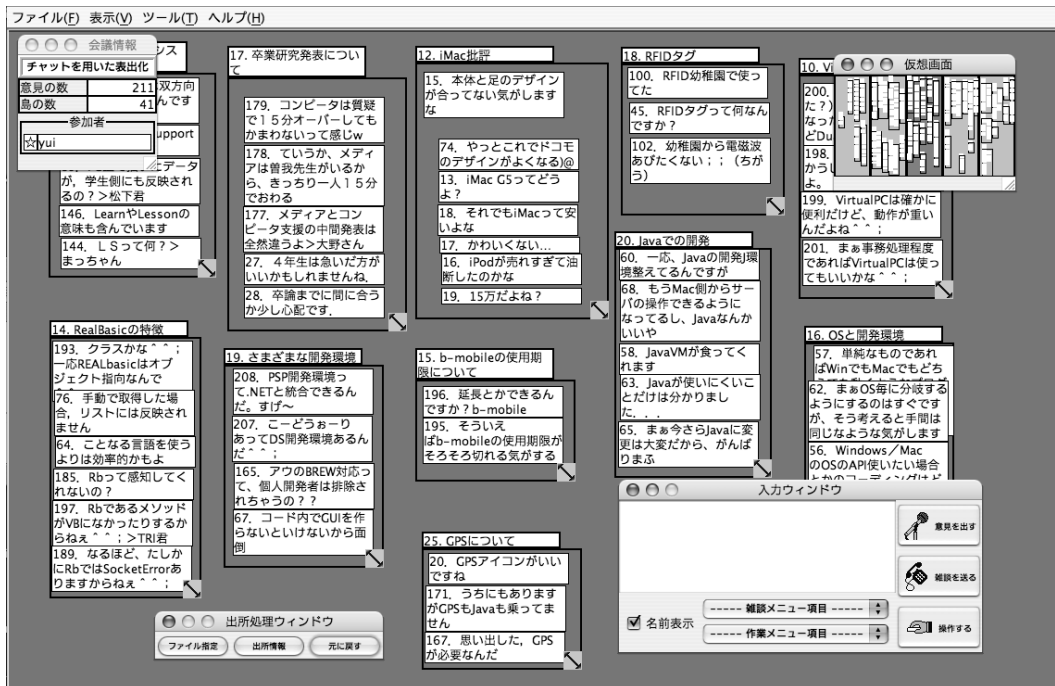
(a) 分散協調型 KJ 法による表出化の例