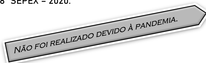
Tabela 48 - 18ª SEPEX - 2020.

Fonte: Pró-Reitoria de Pesquisa (PROPESQ), UFSC (2021).