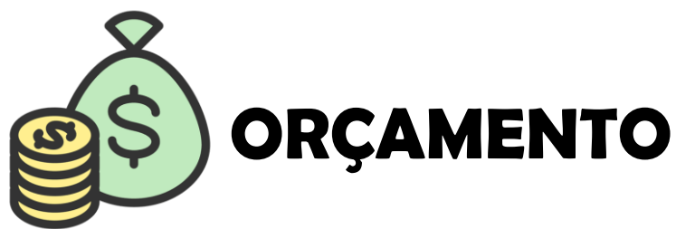
Tabela 108 – Recursos Financeiros.