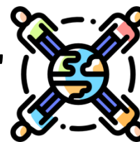
Tabela 59 - Convênios internacionais por país.