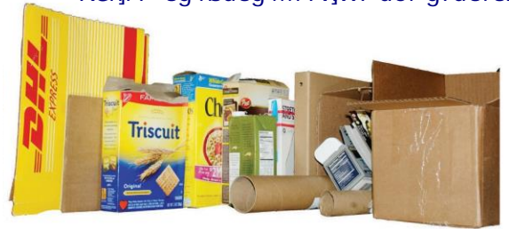
CA>5G`89`75FHÓBž`75FHCB7`-@Cž`75FHÓB`7CFFI ; 58C