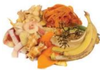
RESTOS DE COMIDA