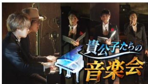
貴公子たちの音楽会 「第1弾@重要文化財・自由学園明日館」

https://vod.bs11.jp/contents/category/concert-of-nobles