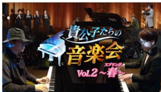
貴公子たちの音楽会 ～春～ 「第2弾@浜離宮朝日ホール」