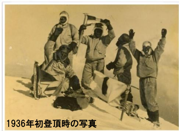
1936年初登頂時の写真

その証として埋めた、立教大学校旗・毎日新聞社旗・日章旗の3旗を求め、立教大学山岳部OB2名を含む5人の登山隊がヒマラヤの聖峰、ナンダ・コート(6,861m)に挑みます。番組では、当時の偉業を記録した貴重なフィルム映像と共に、再登頂プロジェクトの一部始終をお届けします。