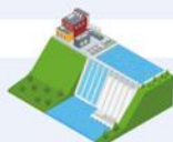
PESSOAS E RECURSOS