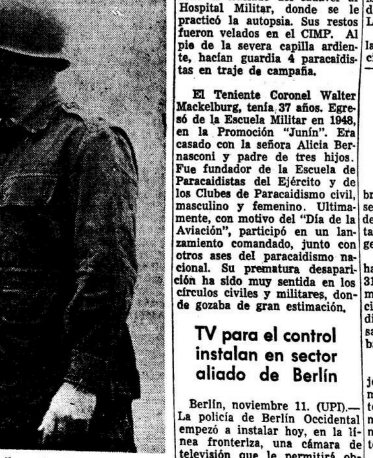
El Teniente Coronel Walter Mackelburg, fue fundador de la Escuela de Paracaidistas del Ejército. Asimismo, organizó el Club de Paracaidismo Civil.

El Teniente Coronel Mackelburg, había estado de guardia en el CIMP, desde la tarde del