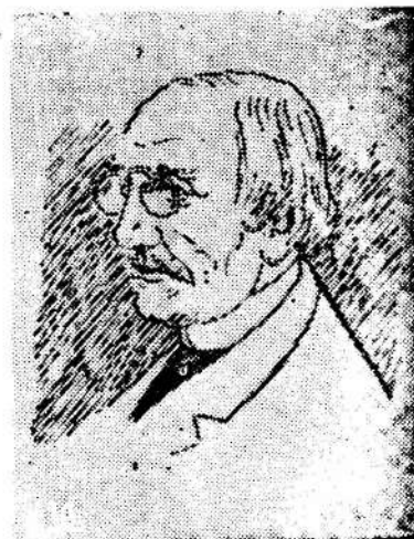
José María Valle Riestra.