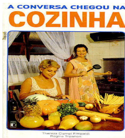
IMAGEM I PARA A QUESTÃO 08