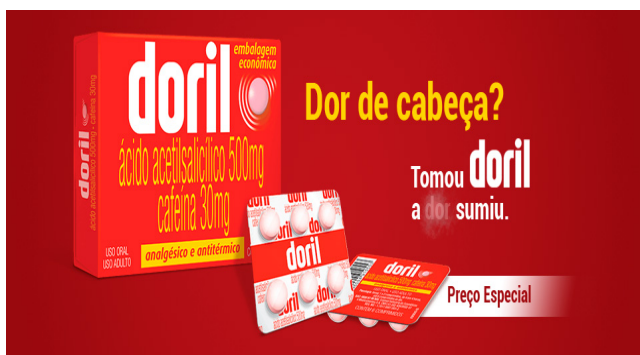
IMAGEM II PARA A QUESTÃO 10