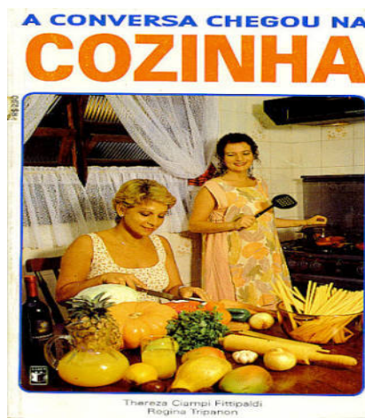
IMAGEM I PARA A QUESTÃO 08