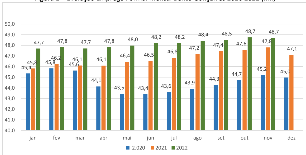
Figura 1 – Evolução Emprego Formal Mensal Bento Gonçalves 2020 2022 (mil)

Fonte: Novo Caged e SIMEI - diferenças de informações em relação aos boletins anteriores se devem pelas atualizações de dados no portal do Novo Caged.