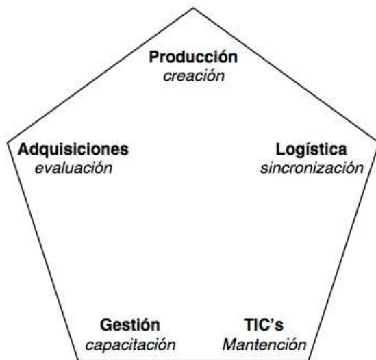
Fig 2. Principales problemáticas.

El staff de FICAeTV actualmente está formado por 20 estudiantes de diferentes niveles y carreras de la Facultad de Ingeniería, Ciencias y Administración, los que componen subgrupos para cubrir las problemáticas atingentes al proyecto, explicitadas en la figura 2 y detalladas a continuación.