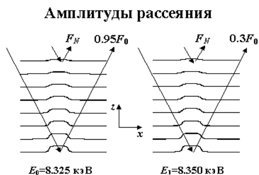
Рис.1. Сравнение интенсивности диффузного рассеяния от Ni/C МРЗ при энергии фотонов до (8.325 кэВ) и после (8.350 кэВ) К-края поглощения атомов никеля: во втором случае вклад в амплитуду диффузного рассеяния от шероховатых дефектов нижних слоев заметно ниже за счет эффективной экранировки в условиях жесткого фотопоглощения.

можно исследовать поведение кросс-корреляции в зависимости от латеральных пространственных размеров шероховатостей.