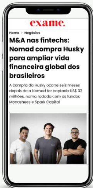
Aquisição da Husky