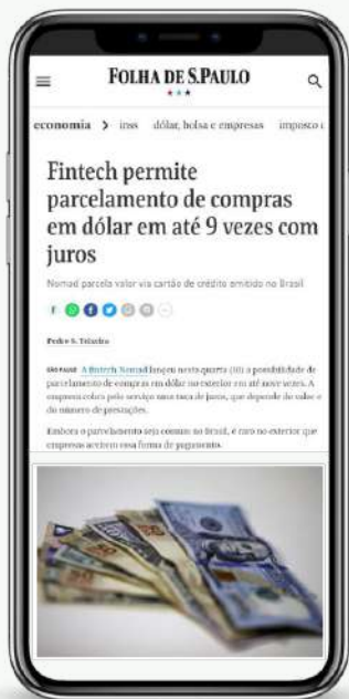
Parcelamento em Dólar