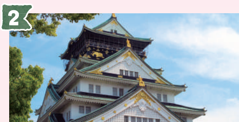
2 大阪城 (おおさかじょう)

「大川さくらクルーズ」の発着場所である八軒家浜船着場は、かつては京都・伏見と大坂を結ぶ舟運の拠点となる場所でした。周辺に八軒の船宿があったことから「八軒家浜」と呼ばれるようになりました。