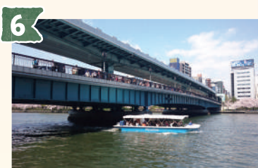
6 天満橋 (てんまばし)

人と自転車のみが通行できる斜張橋。斜張橋とは塔から斜めに張ったケーブルで支えている橋のことで。