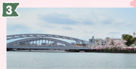
3 桜宮橋 (さくらのみやぼし)

大阪のシンボル、大阪城。クルーズ中にも何度か見ることができ、ビルの後ろから出てきたり隠れたりする姿はとても愛らしく感じます。また、八軒家浜船着場から大阪城天守閣までは歩いて30分程かかりますが、乗船後に春を感じながらのお散歩はいかがですか。