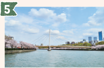
5 川崎橋 (かわさきばし)

1871年4月に創業した、日本の硬貨を作る場所です。特徴は、建物外観にある緑の丸。これは硬貨をイメージしたものと言われています。