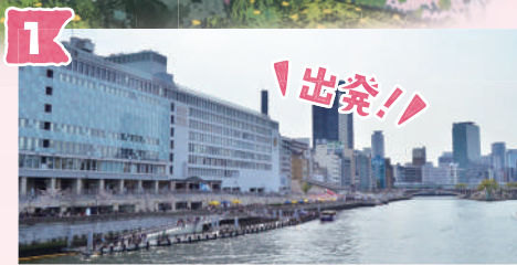
1 八軒家浜船着場 (はちけんやはまふなつぎば)

「大川さくらクルーズ」の発着場所である八軒家浜船着場は、かつては京都・伏見と大坂を結ぶ舟運の拠点となる場所でした。周辺に八軒の船宿があったことから「八軒家浜」と呼ばれるようになりました。