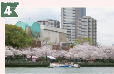
4 造幣局 (ぞうへいきょく)

大阪市民からは「銀橋」の愛称で親しまれている橋。この橋が架けられてから80年以上の歳月が経っており、橋の寿命から考えるととても長生きしている橋といえます。