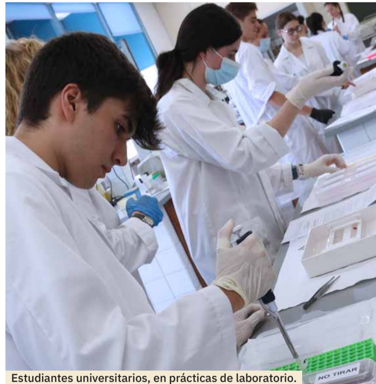
Estudiantes universitarios, en prácticas de laboratorio.

de forma independiente. Todos los alojamientos se encuentran situados en las inmediaciones del campus universitario para que no tengas que desplazarte grandes distancias.