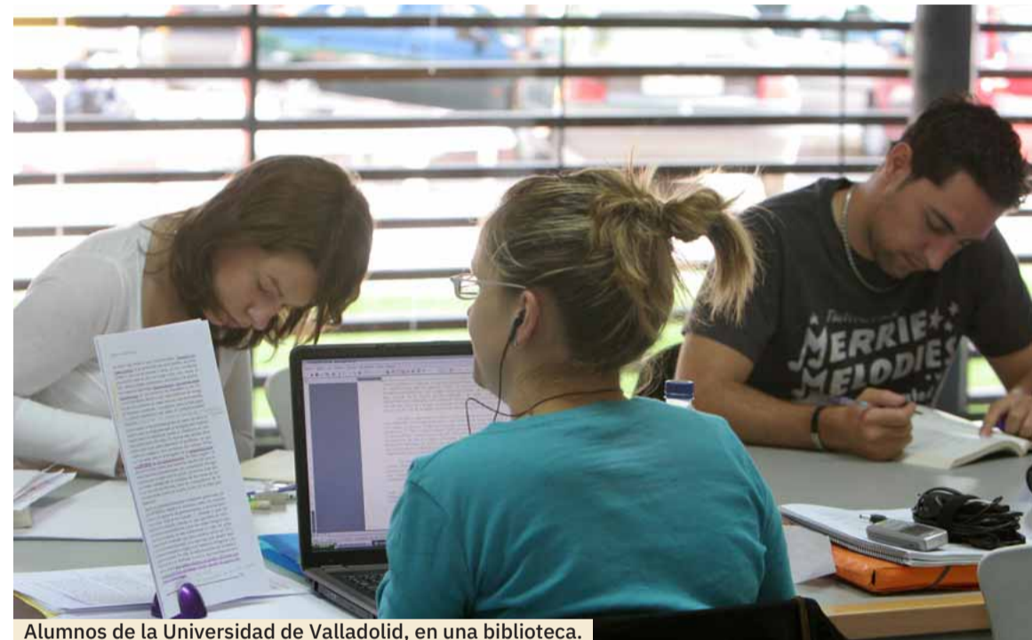
Alumnos de la Universidad de Valladolid, en una biblioteca.

VALLADOLID El Norte. Más de 73 titulaciones de todas las ramas del conocimiento impartidas en 24 centros académicos de los campus de Palencia, Segovia, Soria y Valladolid. Un total de 14 programas de doble titulación oficial, 64 másteres oficiales y 29 programas de doctorado. Son números que invitan a despertar tu imaginación para «atisbar un universo de posibilidades. Todas estas opciones están a tu alcance. Elige con plena libertad, déjate llevar por tu vocación y por lo que siempre has querido hacer. Vive tu juventud, sé feliz en la Universidad de Valladolid», aconseja Antonio Largo Cabrerizo, rector de la UVA, institución que cuenta con 28.000 estudiantes de grado, máster, doctorado y títulos propios; 2.551 profesores y alrededor de mil trabajadores de administración y servicios.