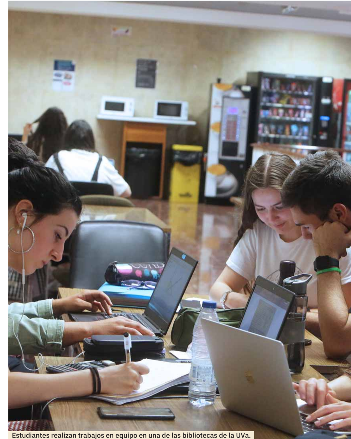
Estudiantes realizan trabajos en equipo en una de las bibliotecas de la UVa.

Las plazas ofertadas para este curso se asignarán a aquellas personas que cumpliendo los requisitos de admisión las soliciten y tengan las calificaciones más altas.