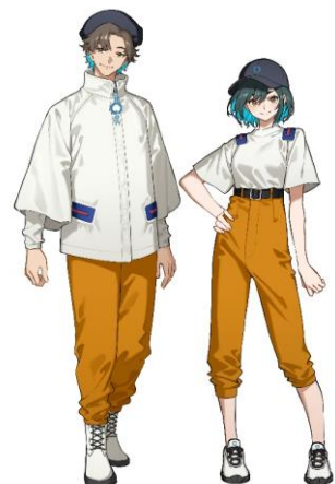
ユニフォームイメージイラスト ※ユニセックス仕様・長袖半袖あり

ユニフォームは、宇宙への旅が一般的になった未来という設定のもと、来場者の宇宙の旅に寄り添うクルーのイメージでデザインしています。イメージイラストは実際の衣装をもとに、TVアニメ『機動戦士ガンダム 水星の魔女』のキャラクターデザイン原案担当、モグモさんに描き起こしていただきました。