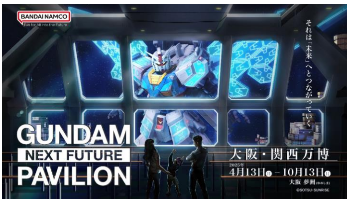
パビリオン内をイメージした新ビジュアル

当パビリオンは、ガンダムシリーズが描いてきた「宇宙での暮らし」や「まだ実現していない科学技術」を、新たな未来の可能性として捉え、臨場感のある完全新規映像と、フェーズ0から7までのパビリオン空間を通して描き出します。来場者の皆さまには、新たな「宇宙世紀」という設定の中で、大阪・夢洲の「スペースポート」から軌道エレベーターで宇宙ステーション「スタージャブロー」まで移動する体験をしていただきます。人類とモビルスーツが共存する映像世界には、背中部分に「グラスフェザー」という装備を装着したガンダムや、様々なモビルスーツ（※1）、新デザインのハ口が登場します。