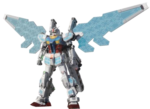
RX-78F00/E ガンダム（EX-001 グラスフェザー装備）