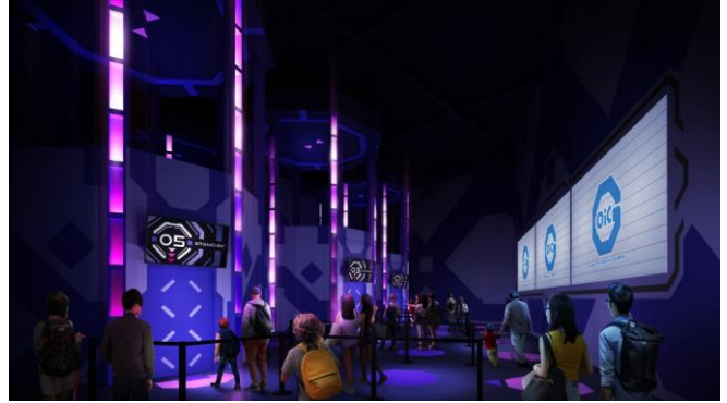
フェーズ1 (軌道エレベーター乗り場)