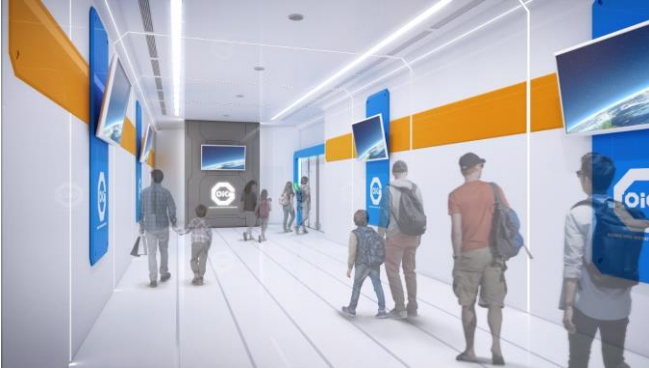
フェーズ0 (エントランス)