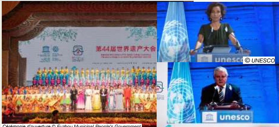
Cérémonie d'ouverture © Fuzhou Municipal People's Government.

Le Comité du patrimoine mondial a inscrit 34 nouveaux biens sur la Liste dont 2 biens africains. Le Comité a aussi approuvé l'extension de 3 biens sur la Liste.