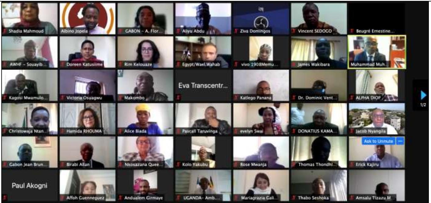
Participants, 5e réunion des experts africains membres du Comité du patrimoine mondial, 30 juin – 2 juillet 2021

Avant la 44e session prolongée du Comité du patrimoine mondial, le Fonds pour le patrimoine mondial africain, en collaboration avec l'Ouganda, a organisé du 30 juin au 2 juillet 2021, la 5e réunion des experts africains du Comité du patrimoine mondial en préparation de la session du Comité du patrimoine mondial. La réunion visait à réfléchir et à trouver une approche commune pour les questions soulevées dans les rapports au Comité du patrimoine mondial, y compris les rapports sur l'état de conservation et les propositions d'inscription de l'Afrique.