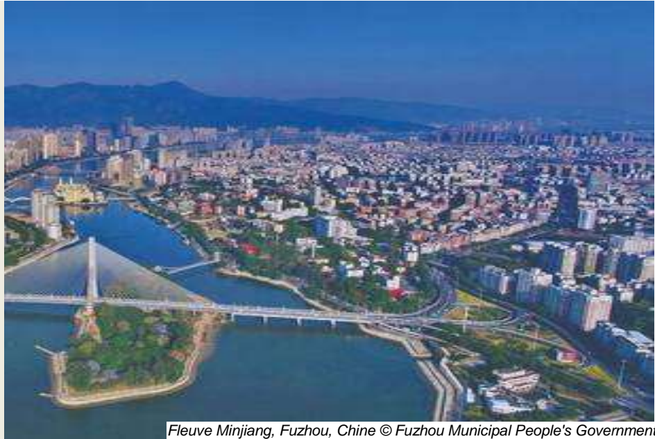
Fleuve Minjiang, Fuzhou, Chine © Fuzhou Municipal People's Government.

Un consensus obtenu sur les sites de mémoire et la Convention du patrimoine mondial . Le Comité a décidé de créer un groupe de travail ouvert des Etats Parties pour continuer de réfléchir sur le sujet.