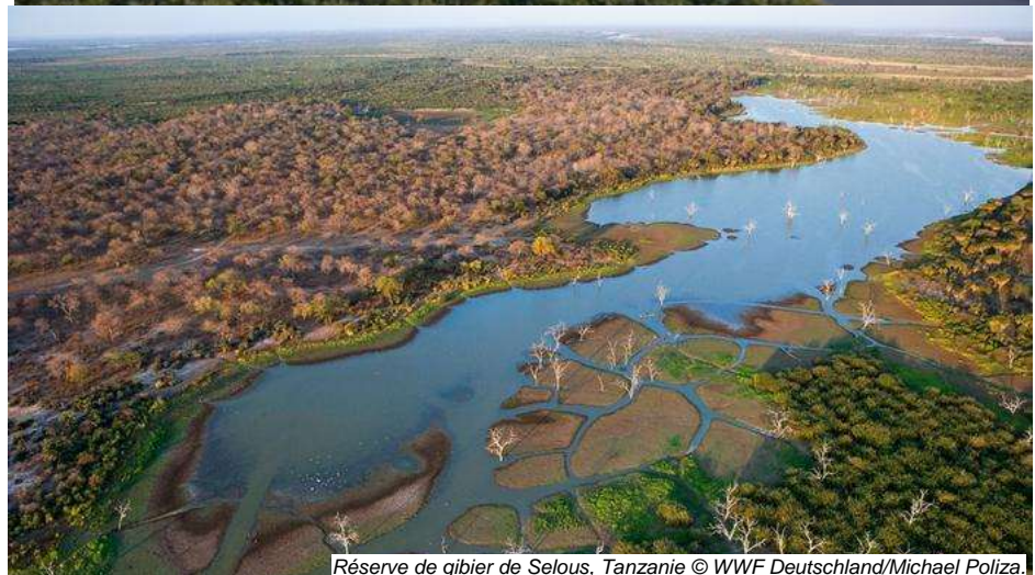
Réserve de gibier de Selous, Tanzanie