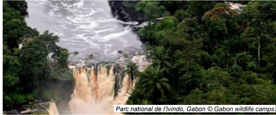
Parc national de l'Ivindo, Gabon

"L'inscription par l'UNESCO du parc national de l'Ivindo sur la Liste du patrimoine mondial vient récompenser les efforts du Gabon en matière de protection des forêts dont le rôle est déterminant dans la lutte contre le réchauffement climatique. Un grand jour!" Tweet par S. E. Ali Bongo Ondimmba, Président de la République du Gabon.