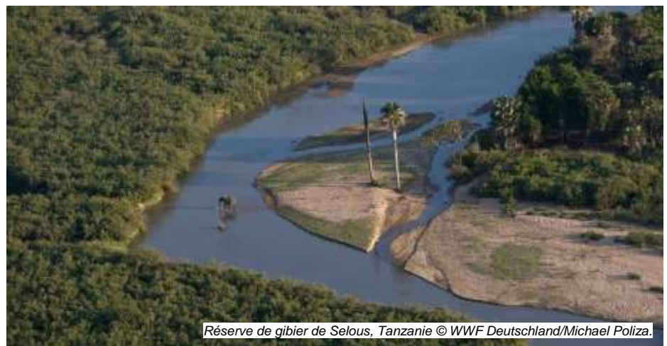
Réserve de gibier de Selous, Tanzanie