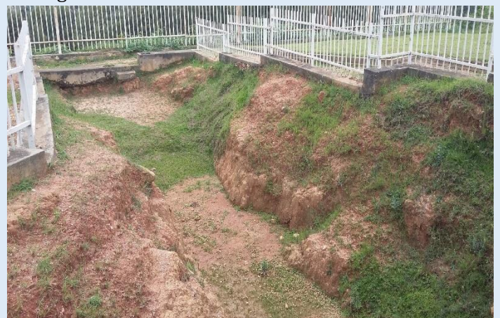
Fosse commune sur le site génocidaire de Murambi