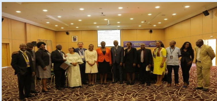
Membres du Conseil d'Administration du FPMA