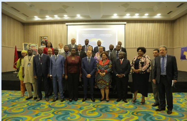
Autorités ministérielles et membres du CA du FPMA