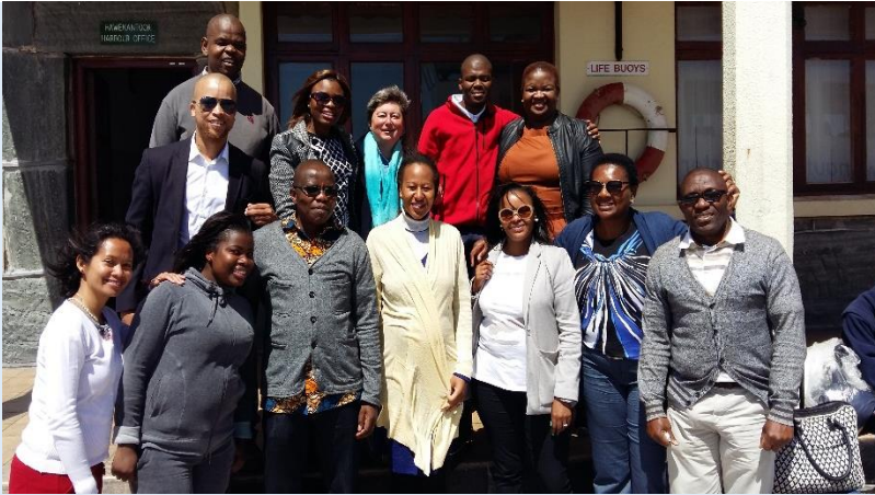
Groupe de participants à l'atelier en gestion des risques