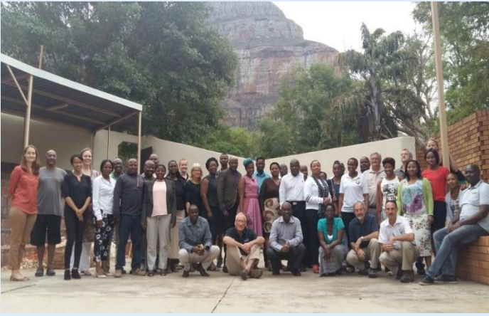
Groupe de participants de l'atelier

Le Département des Affaires Environnementales d'Afrique du Sud (DEA) en collaboration avec le Fonds pour le patrimoine mondial africain (FPMA) a organisé un atelier régional du 18 au 26 octobre 2016 à Swadini Forever Resort à Hoedspruit en Afrique du Sud. L'atelier a réuni 35 participants (photo ci-contre) entre autres des experts, des gestionnaires de sites du patrimoine mondial et des responsables politiques de différentes régions d'Afrique. Ils ont évalué l'efficacité des mécanismes actuels de gestion des zones tampons en liaison avec la conservation et la protection des biens du patrimoine mondial sur le long terme. L'atelier visait également à réfléchir sur un cadre plus efficace et plus inclusif en vue d'une gestion améliorée des zones tampons sur le continent africain. Le but ultime consistait à élaborer un ensemble de lignes directrices.