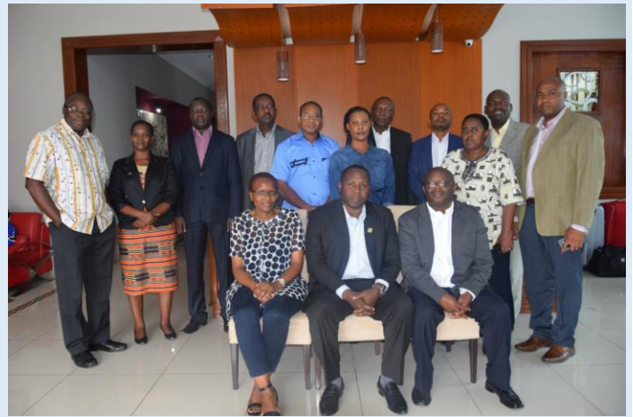
Groupe de participants à la réunion

L'objet de la réunion consistait à discuter des points d'ordre du jour qui pas pu être abordés pendant la 40 e session du Comité du patrimoine mondial en juillet 2016 à Istanbul (Turquie) et qui seront examinés au cours de la session de continuation en octobre 2016 à Paris (France). La logique était de fournir une plateforme aux experts du patrimoine mondial afin qu'ils comprennent et défendent différentes questions liées au patrimoine.