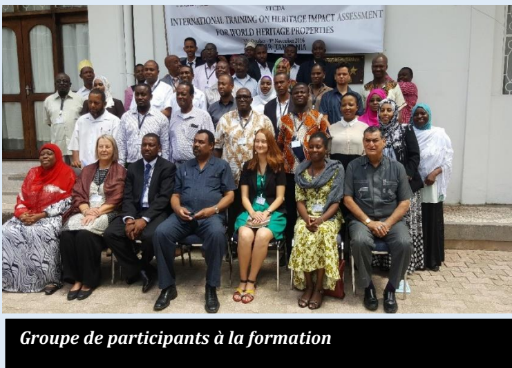
Groupe de participants à la formation