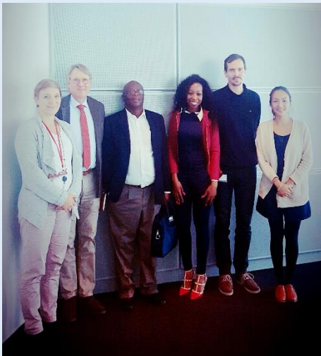
Le FPMA avec l'équipe de GIZ

Le FPMA a réalisé une mission à Eschborn (Allemagne) où se trouve le siège de la Fondation GIZ dans l'intention de discuter des domaines possibles de partenariat et de s'informer des projets de GIZ sur le continent africain. A travers ce partenariat, GIZ pourrait soutenir le FPMA dans la réalisation de ses objectifs stratégiques pour la période 2016-2019.