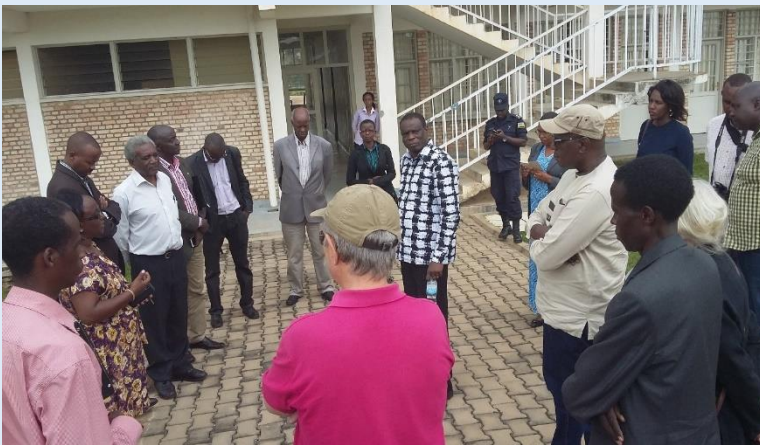
Visite de site par les experts - Visite de courtoisie par l'adjointe au maire de Murambi

L'atelier d'experts sur la Valeur Universelle Exceptionnelle des sites mémoriaux de Nyamata, Murambi, Gisozi et Biserero, sites de génocide contre les Tutsi au Rwanda en 1994 , a été organisé à Kigali (Rwanda) du 7 au 9 novembre 2016 par la Commission Nationale de Lutte contre le Génocide et ses partenaires locaux (universités, société civile), le Centre du patrimoine mondial de l'UNESCO, l'ICOMOS et le FPMA. L'atelier a permis de discuter essentiellement le potentiel et les possibilités de développement d'un dossier d'inscription pour les sites liés au génocide au Rwanda. Le FPMA a amené à l'atelier des experts d'Afrique du Sud, du Mali et du Sénégal.