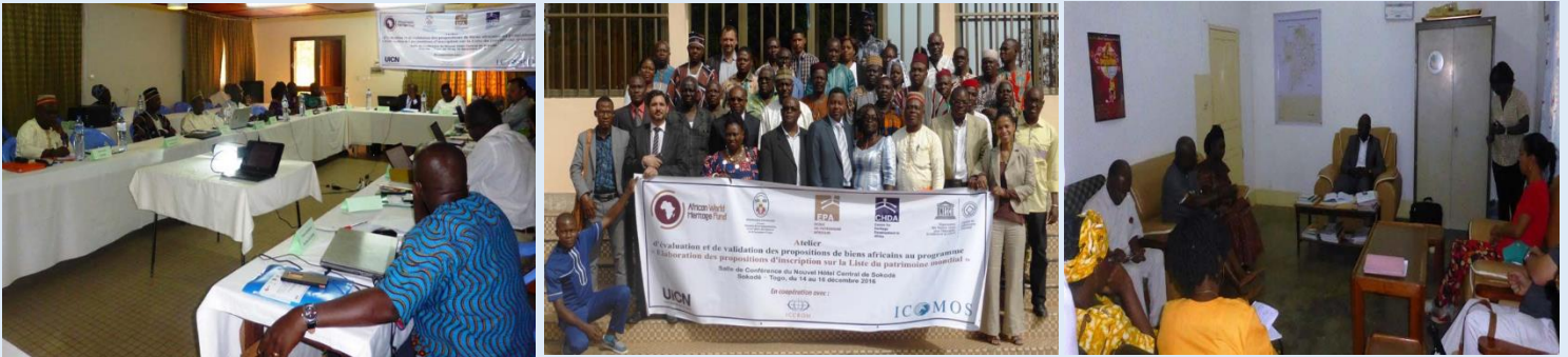
Photo de groupe des participants et présentations durant l'atelier

Sous la coordination de l'Ecole du patrimoine africain, l'atelier s'est tenu à Sokode du 14 au 16 décembre 2016. Il fait suite à une enquête sur les listes indicatives nationales dans les pays africains d'expression française et portugaise et visant à identifier les sites les plus crédibles à impliquer dans les processus d'inscription au patrimoine mondial. L'atelier a rassemblé des directeurs nationaux venant de 11 pays (Angola, Bénin, Cameroun, Congo, Cote d'Ivoire, Guinée, Mali, Niger, République Centrafricaine, Tchad et Togo) et des experts de l'UNESCO, de l'ICOMOS, de l'UICN et du FPMA. Les experts ont discuté les critères requis y compris les potentiels de Valeur Universelle Exceptionnelle des sites identifiés. Des travaux complémentaires sont nécessaires entre autres la précision des sites/thèmes prioritaires, et le soutien des autorités nationales pour développer des dossiers d'inscription crédibles.