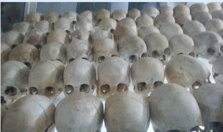
Exposition de restes humains sur le site génocidaire de Nyamata