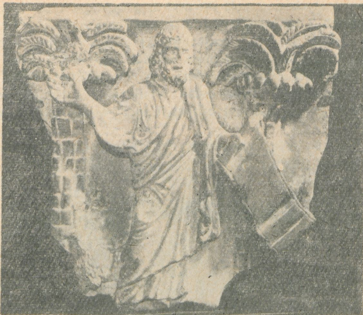
2. Fragment sarkofagu ze sceną traditio legis, Muzeum Narodowe w Krakowie, nr inw. XI-1219.

przednia ściana pokryta jest dekoracją w formie fryzu ułożonego w dwu pasach i przerwanego pośrodku przez medalion z portretami zmarłych, ukazano Piłata w otoczeniu kilku osób. Prawdopodobnie około roku 340, w warsztacie, w którym powstał sarkofag nr 171 z Muzeum lateraneńskiego 6 , wykształcił się nie spotykany dotąd w sztuce chrześcijańskiej typ sarkofagu kolumniowego, mającego przednią ścianę podzieloną na 5 lub 7 pól, w których umieszczano dwu-, lub trójosobowe sceny. W tym też warsztacie wypracowano nowy typ przedstawień, stale się odtąd powtarzający. Był nim schemat ilustrowania sceny sądu nad Chrystusem — siedzący Piłat, stojący przed nim niewolnik i umieszczony w głębi pomiędzy nimi urzędnik. Grupa ta jest najbardziej charakterystyczną cechą tzw. sarkofagów pasyjnych, ukazujących sceny męki Chrystusa i męczeństwa św. św. Piotra i Pawła. Zajmuje ona nieodmiennie skrajne lewe pole sarkofagu.