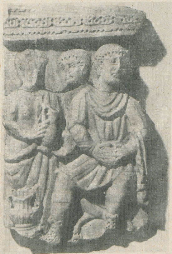
1. Fragment sarkofagu pasyjnego. Muzeum Narodowe w Krakowie, nr inw. DMNKCz 1841, 1862, 2175.

jańskich powstałych w 2 poł. IV wieku: pasyjnej i z przedstawieniem bram miejskich. Cechy stylistyczne (sposób opracowania oczu, włosów, zarostu i szczegółów szat) pozwalają na ściśle datowanie obiektów: pierwszego na rok 400, a drugiego na lata 380—400, a więc na okres rządów Teodozjusza i pierwsze lata panowania Honoriusza, kiedy to wczesnochrześcijańska płaskorzeźba sepulkralna osiągnęła swój najwyższy punkt rozwoju artystycznego i ideowego, nie popadając przy