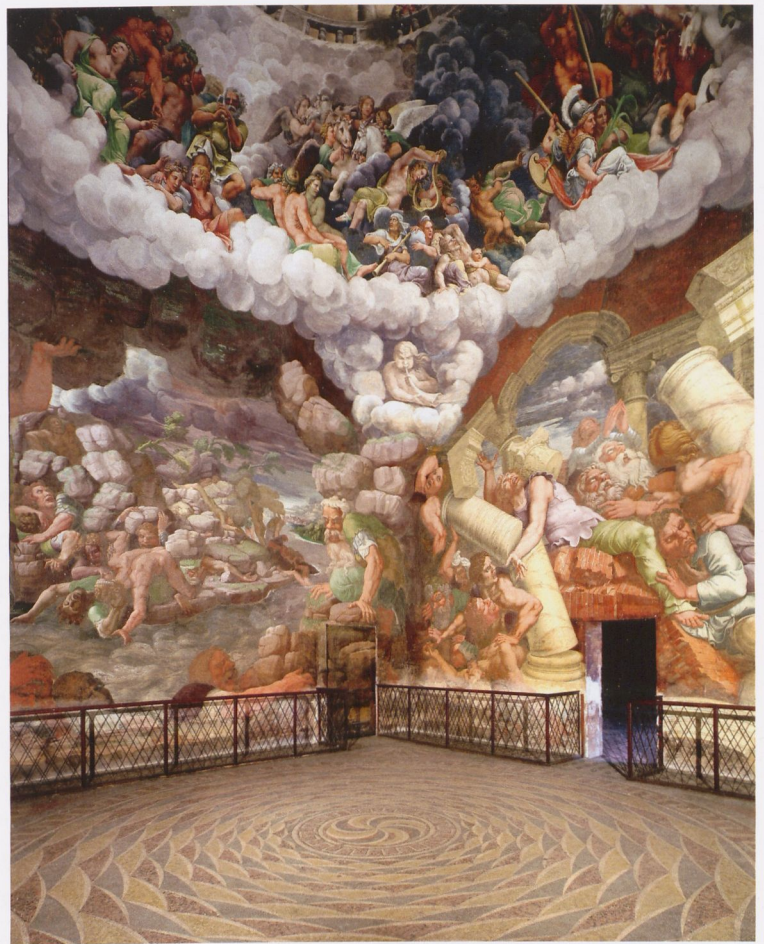
Fig. 6 Giulio Romano, Fall of the Giants , 1532–35, Palazzo del Te, Sala dei Giganti, Mantua | Abb. 6 Giulio Romano, Gigantensturz , 1532–1535, Palazzo del Te, Sala dei Giganti, Mantua

Real catastrophes were ill-suited to being the subject of a work of art. Even the devastating Black