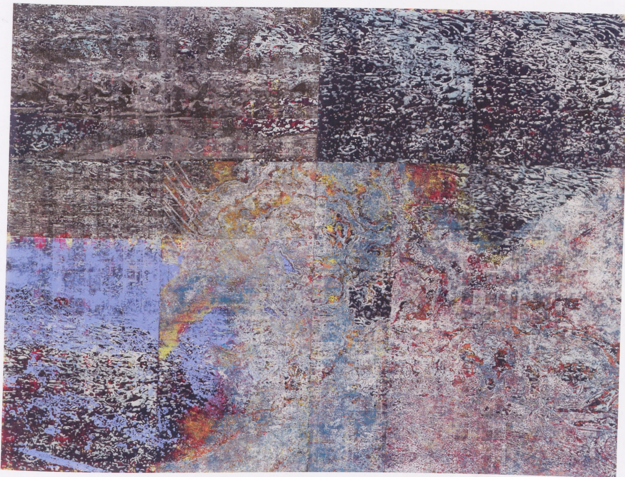
Fig.10 Marthin Werthmann, Beirut III , 2014, monotype woodblock print on paper, 10' x 13' 5", private collection, Berlin (see also pp. 42–43) | Abb.10 Marthin Werthmann, Beirut III , 2014, monotypischer Holzschnitt auf Papier, 305 x 410 cm, Privatsammlung, Berlin (siehe auch S. 42–43)

French press did not acknowledge its importance. Journalists gossiped viciously about the work's scandalous political background. Géricault went on to send the painting to England for a series of private exhibitions. It was exhibited for a fee in London and other cities, along with an explanation of the story on which it is based. The tour was a huge success, and Géricault earned far more from it than an army of balladeers (20,000 francs).