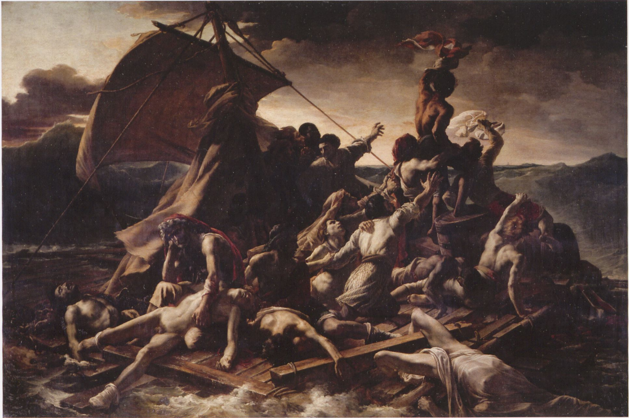
Fig.9 Théodore Géricault, The Raft of the Medusa , 1818–19, oil on canvas, 16' 1" x 23' 6", Paris, Musée du Louvre, Paris | Abb.9 Théodore Géricault, Das Floß der Medusa , 1818/19, Öl auf Leinwand, 491 x 716 cm, Musée du Louvre, Paris

connoisseurs at the time: the death of Count Ugolino, who had to witness his sons starving to death in a dungeon before succumbing himself. Behind this entry of horror, as in other classical paintings but with a Rubens-like dynamism, a pyramid is constructed leading all the way to a group with their backs to the viewer, excitedly waving their shirts to attract the attention of the ship in the background. The ship is so small that the viewer has to step up close to the canvas to see it, and is thus drawn into this little spark of hope. Repellent elements such as cannibalism are ignored. They were unnecessary, since the story was in any case well known. The painting was awarded the Médaille d'Or, although the