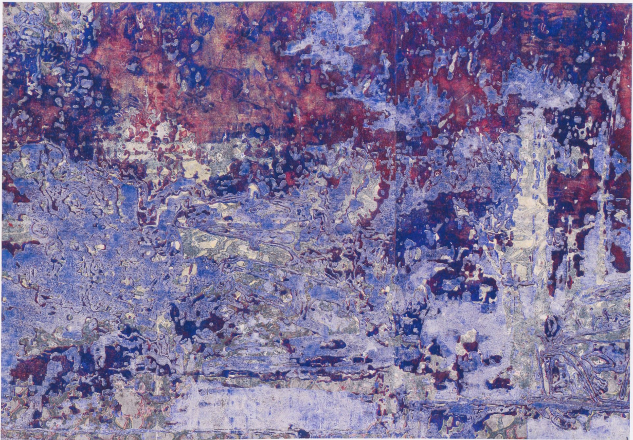
Fig. 3 Martin Werthmann, Silence 4 , 2018, monotype woodblock print on paper, 4' 9" x 6' 7", collection of Lyn Winter, Los Angeles (see also pp. 76–77) | Abb. 3 Martin Werthmann, Silence 4 , 2018, monotypischer Holzschnitt auf Papier, 144 x 201 cm, Sammlung Lyn Winter, Los Angeles (siehe auch S. 76–77)

caused by a single catastrophe is greater than a number of misfortunes. A thousand accidents are still not a catastrophe. The whole is more than the sum of its parts, as Aristotle put it. 4 But what is added? Even the legislator who is obliged to define the matter for practical reasons finds it difficult to give an answer: "Catastrophes are ... major disastrous events which ... cannot be adequately dealt with by the authorities responsible for danger prevention." 5 Can it be that these "major disastrous events" are only large accidents? The fine distinction does not really work, even in this case. Leonardo's depiction of destructive power is so suggestive that viewers