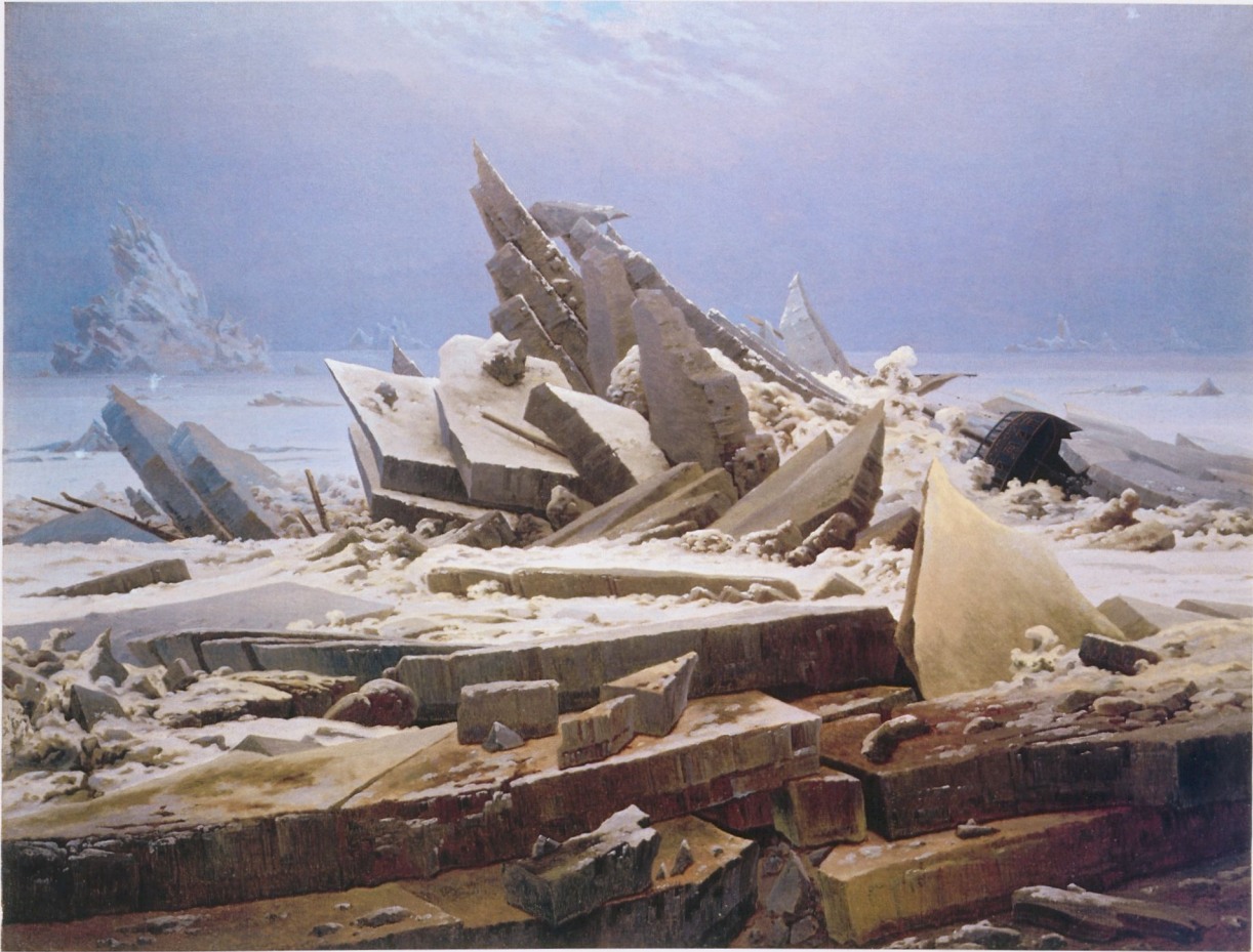
Fig.12 Caspar David Friedrich, The Sea of Ice , 1823–24, oil on canvas, 3' 2" × 4' 2", Kunsthalle, Hamburg | Abb.12 Caspar David Friedrich, Das Eismeer , 1823/24, Öl auf Leinwand, 96,7 × 126,9 cm, Kunsthalle, Hamburg

to the subject with reference to historical examples: What are catastrophes? How do they differ from accidents? How are they perceived or dismissed? Why have they been depicted? What makes them attractive to the art world even though they are not beautiful? In what forms are they depicted? How is it even possible to represent them, since there is a need to express their vast supremacy while at the same time depict the suffering that they inflict on individual human beings? How can forms that are actually abstract or relatively abstract be just as powerfully evocative