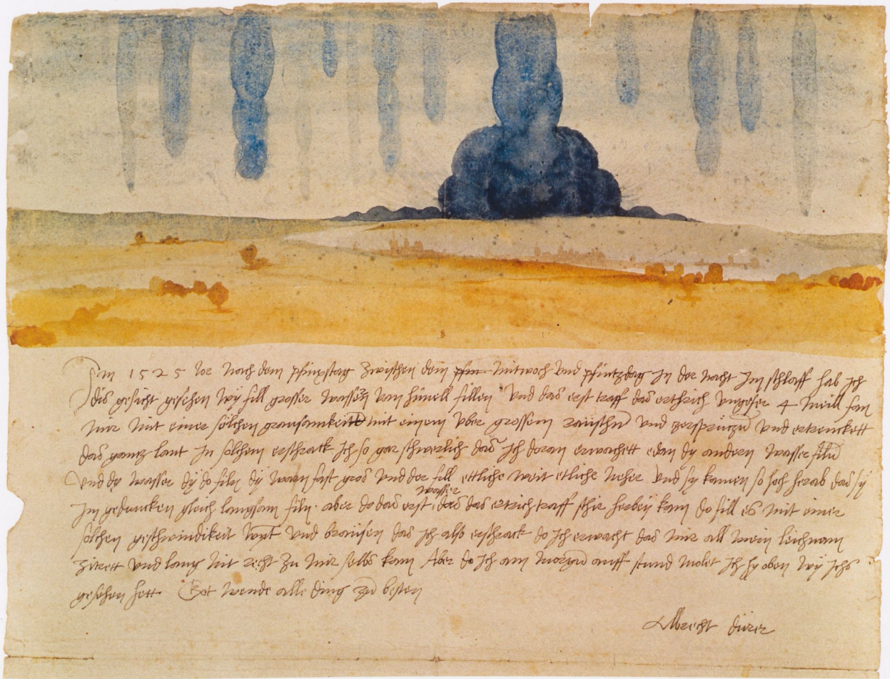
Fig.1 Albrecht Dürer, Dream Vision, June 1525, watercolor, 11¾" x 16¾", in Kunstbuch Albrecht Dürers, Kunsthistorisches Museum, Kunstammer, Vienna | Abb.1 Albrecht Dürer, Traumgesicht, Juni 1525, Aquarell, 30 x 42,5 cm, in: Kunstbuch Albrecht Dürers, Kunsthistorisches Museum, Kunstammer, Wien

to its description as rain, but it corresponds to the deep horror with which Dürer woke up: "my whole body trembled and I did not really come to myself for a long time." Clearly Dürer managed to express something like the premonition of a great flood.