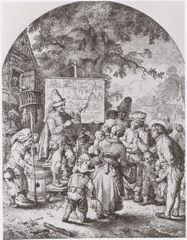
Fig. 8 Christian Wilhelm Ernst, The Balladeer , 1740, copperplate engraving, 10½" x 7½", Herzog Anton Ulrich Museum, Braunschweig | Abb. 8 Christian Wilhelm Ernst, Der Bänkelsänger , 1740, Kupferstich, 26,6 x 19 cm, Herzog-Anton-Ulrich-Museum, Braunschweig

A short while later, shipwrecks come to dominate the field. Where a large area is shown in the grip of disaster, the suffering caused cannot properly be given its due. In order for that to happen, a