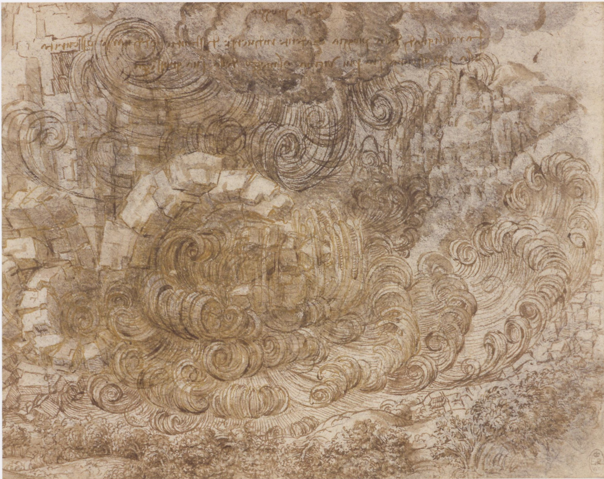
Fig. 2 Leonardo da Vinci, Flood , ca. 1517–18, black chalk and India ink on paper, 6¼" x 8", Royal Collection Trust, Windsor, RCIN 912380 | Abb. 2 Leonardo da Vinci, Sintflut , um 1517/18, schwarze Kreide und Tusche auf Papier, 16,2 x 20,3 cm, Royal Collection Trust, Windsor, RCIN 912380

these drawings. It expresses concentrated force and its universally destabilizing effect.