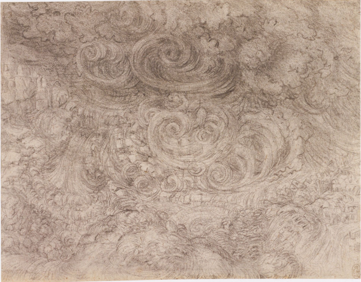
Fig. 5 Leonardo da Vinci, Flood , ca. 1517–18, black chalk on paper, 6¼" x 8", Royal Collection Trust, Windsor, RCIN 912382 | Abb. 5 Leonardo da Vinci, Sintflut , um 1517/18, schwarze Kreide auf Papier, 16,1 x 20,7 cm, Royal Collection Trust, Windsor, RCIN 912382

curved lines in early car design, which were thought to be “streamlined” even though aerodynamics had at the time barely been tested in wind tunnels, are evidence of a similar phenomenon. In aerodynamic terms this imaginative design proved to be inefficient, but as an expression of the dynamism of high speed it was highly effective, and remains so today.