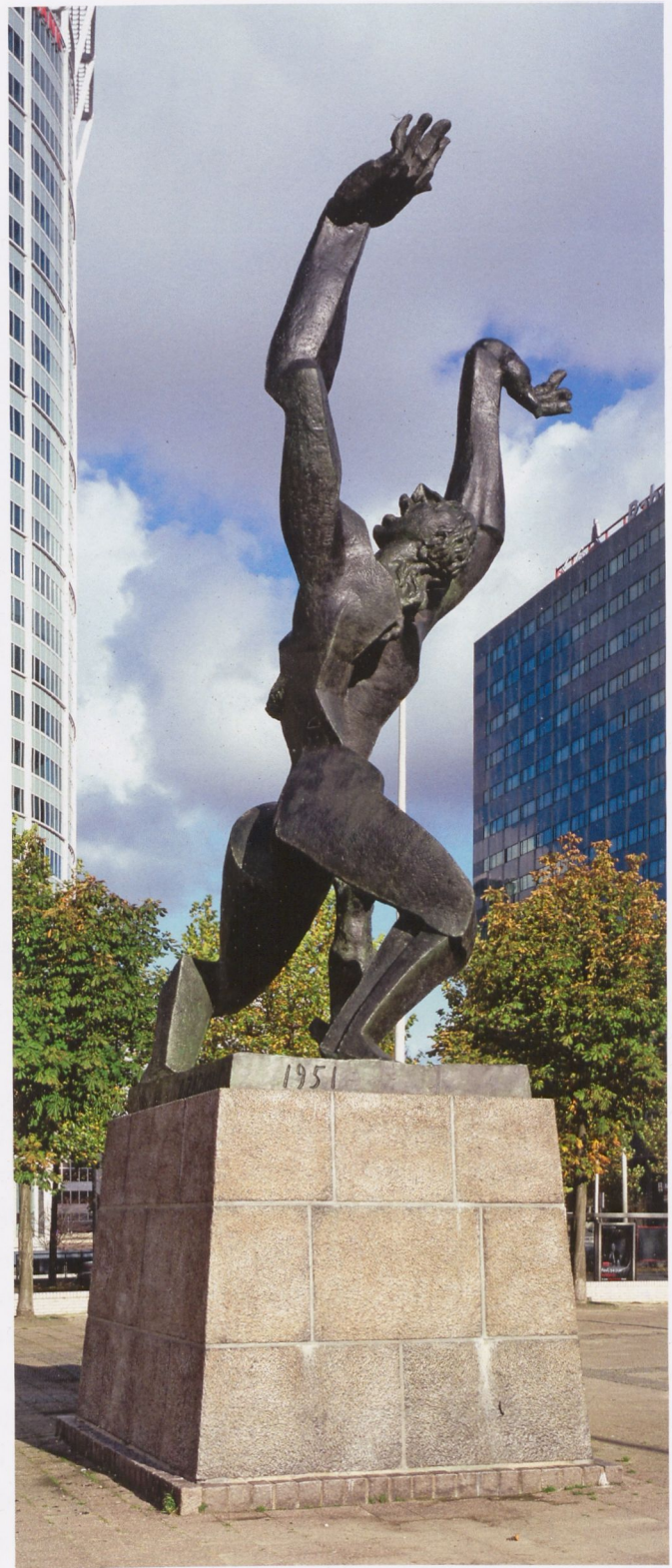
Fig. 7 Ossip Zadkine, The Destroyed City , 1953, bronze, Rotterdam | Abb. 7 Ossip Zadkine, Die zerstörte Stadt , 1953, Bronze, Rotterdam

As early as the Middle Ages pictures of catastrophes circulated for the entertainment of the common people. Balladeers wandered from place to place bringing sensational reports with them (fig. 8). Their performances had to arouse interest, curiosity, and pleasure in order to entice their listeners,