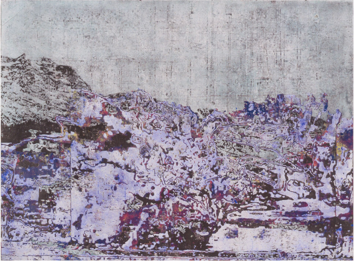
Fig.11 Marthin Werthmann, Landscape X , 2015, monotype woodblock print on paper, 5' x 6' 8", private collection, Holeby, Denmark (see also pp. 46–47) | Abb.11 Marthin Werthmann, Landscape X , 2015, monotypischer Holzschnitt auf Papier, 154 x 204 cm, Privatsammlung, Holeby, Dänemark (siehe auch S. 46–47)

the audience from the background, panic is said to have broken out in the cinema. In fact it was only a screening of the Lumière brothers' Arrival of a Train at La Ciotat (1895). Today, when we are used to such movements on the screen, this scene, which seemed at the time to herald a catastrophe for the audience, looks entirely harmless.