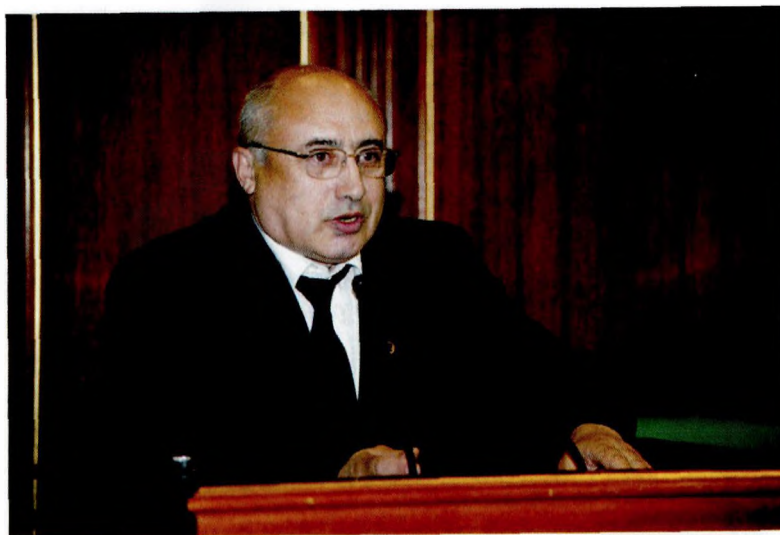
Амирханов Х.А. – Председатель Дагестанского научного центра РАН. 2009 г.