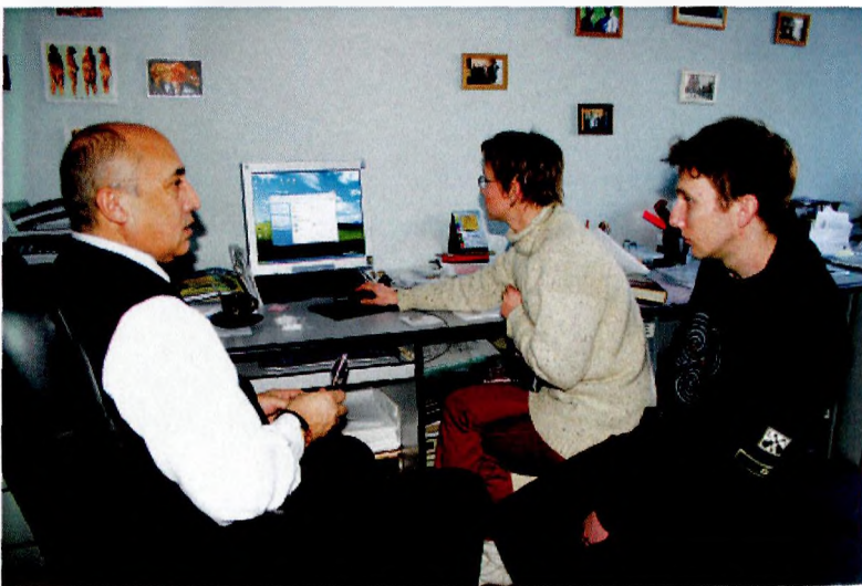
В рабочем кабинете с учениками. 2006 г.