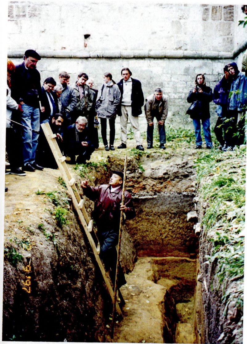
Зарайская стоянка. Участники Международного симпозиума «Восточный граветт» на раскопе. 1997 г.