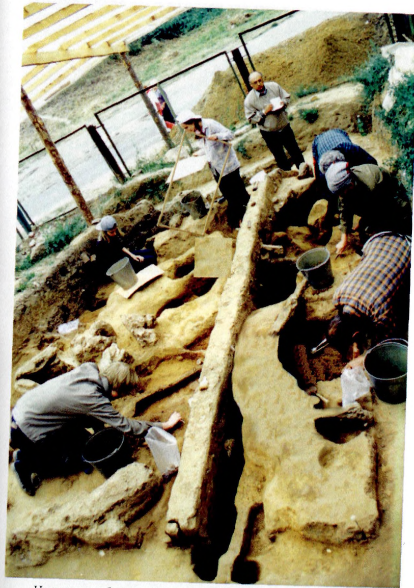
На раскопках Зарайской стоянки (Московская область), 2005 г.