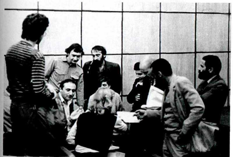
Обсуждение новых находок в кругу коллег. 1989 г.