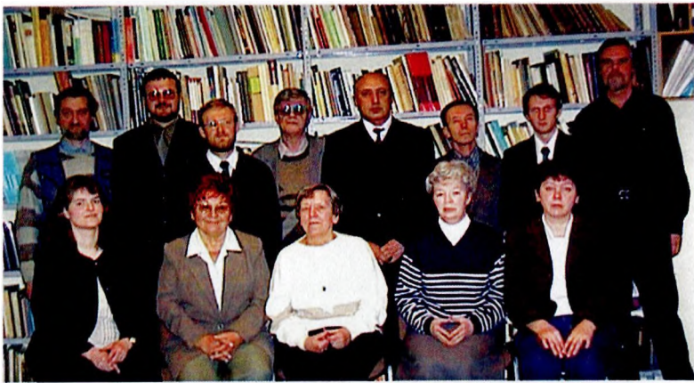
Отдел археологии каменного века Института археологии РАН (снимок сделан к 10-летию создания отдела).