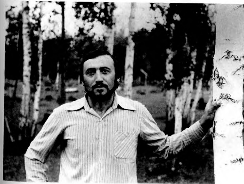
Тюменская область. Сибирско-Среднеазиатская экспедиция ИА АН СССР. 1981 г.