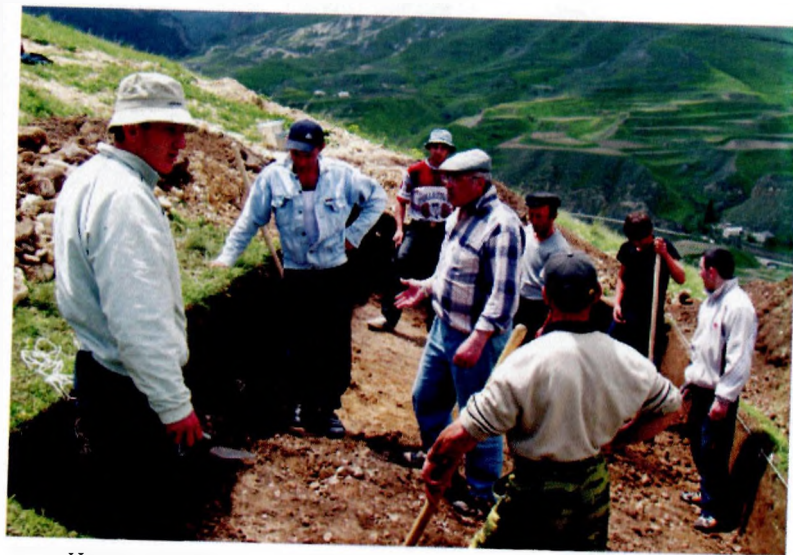
На раскопках стоянки Айникаб 1 (с. Акуша Акушинского района РД). 2008 г.