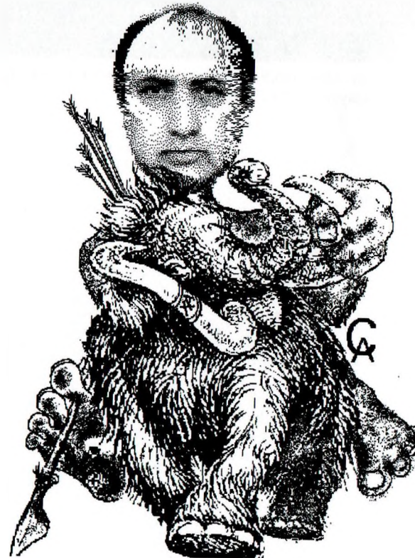
Дружеский шарж в честь 50-летия со дня рождения.

Благоприятный день для переговоров (особенно на финансовую тему), заключения соглашений и любой умственной деятельности. Хорошо делать покупки и получать подарки. Прекрасное время для приятельской и преподавательской деятельности. В медицинском отношении уязвимы почки и поджелудочная железа. Повышается чувствительность надпочечников. Следует избегать мест большого скопления народа и постараться ограничить прием спиртного.