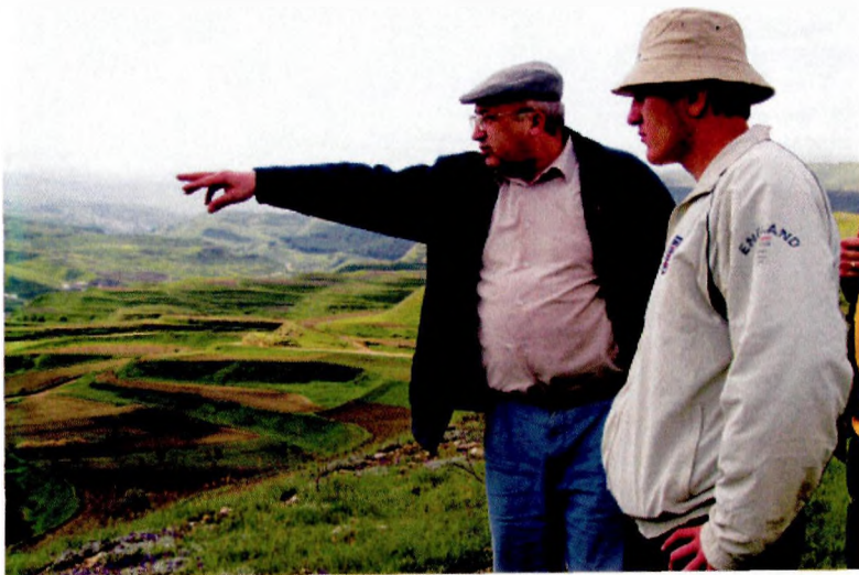
Наставление аспиранту. 2008 г.