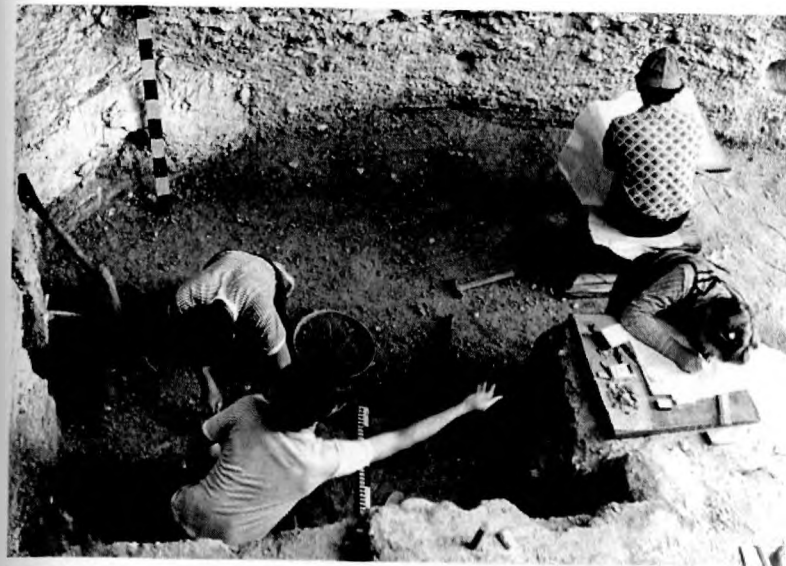
Раскопки на Губском навесе № 1 (Республика Адыгея). 1975 г.