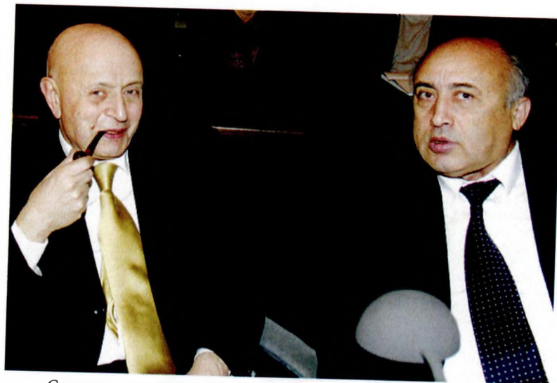
С академиком Богард-Левиным Г.М.