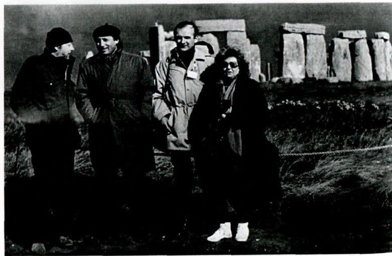
У мегалитического сооружения Стоунхендж (Англия) с польскими археологами. 1986 г.