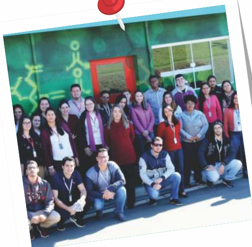
Visita ao laboratório