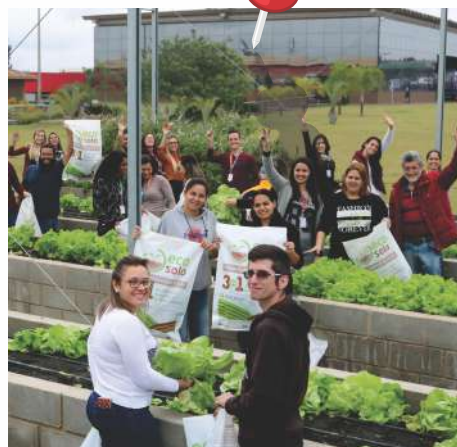
Colheita Eco Horta