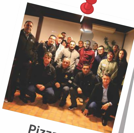
Pizza com Especialista