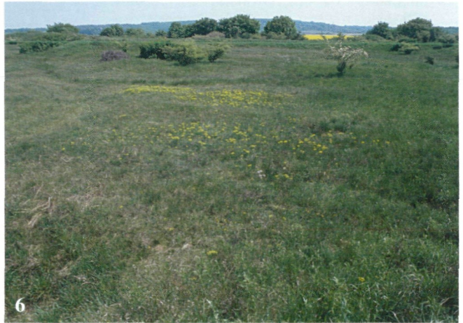
Fig. 6: Habitat of the one and only population of Scolitantides orion in Vienna (21. district, "Alte Schanzen", 1999).