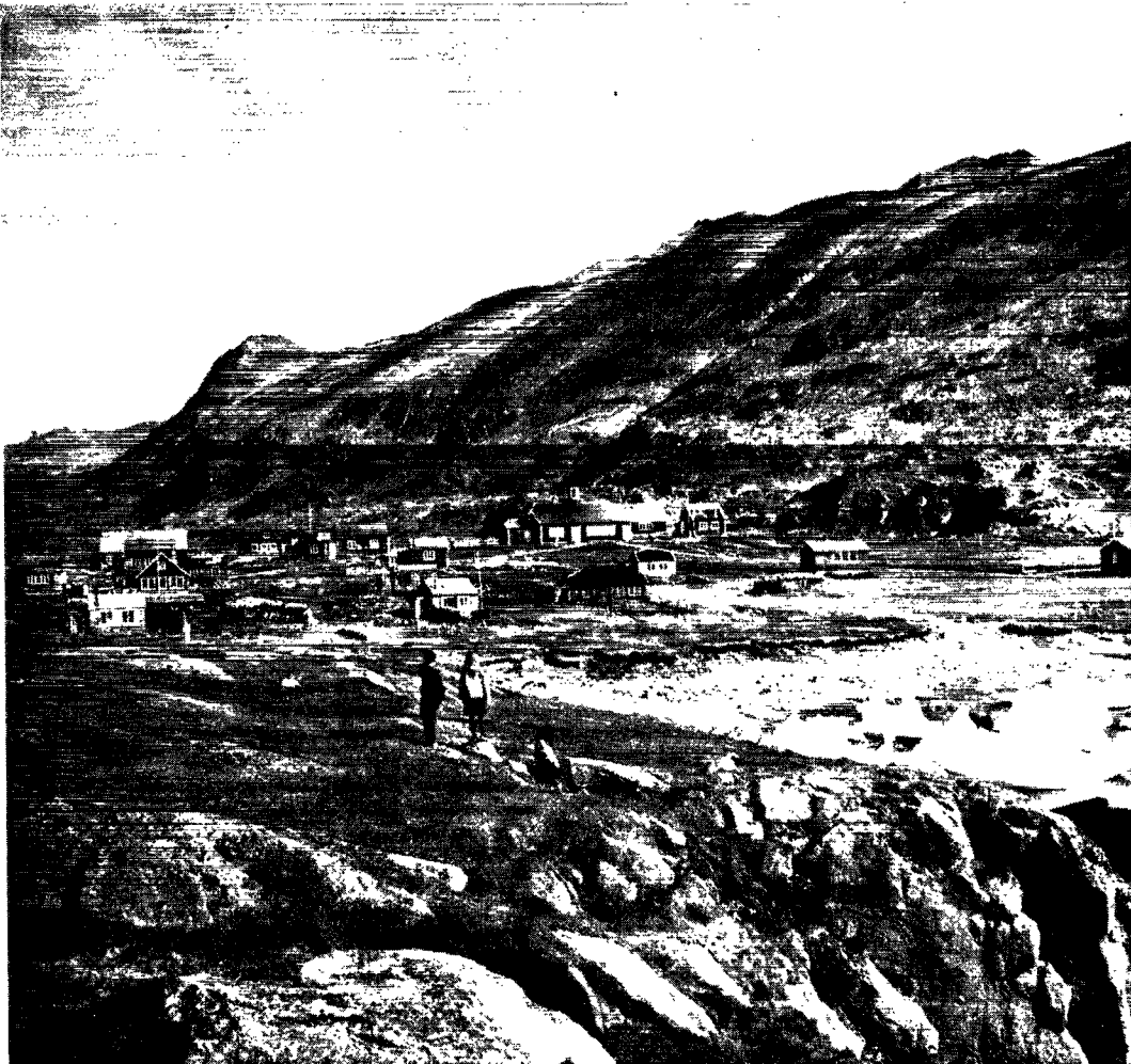
Et nyere billede fra Frederiksdal tæt ved Kap Farvel, hvor herrnhuterne havde en del af deres virksomhed.