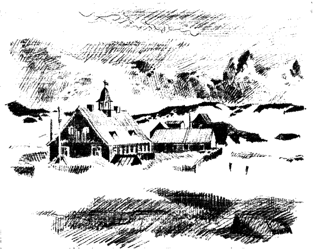
Ny Herrnhut. (Tegning: Alex Secher).

storme, der præger egnen; man måtte flytte hele anlægget til et bedre beskyttet sted i nærheden og byggede så påny – og mere solidt end første gang.