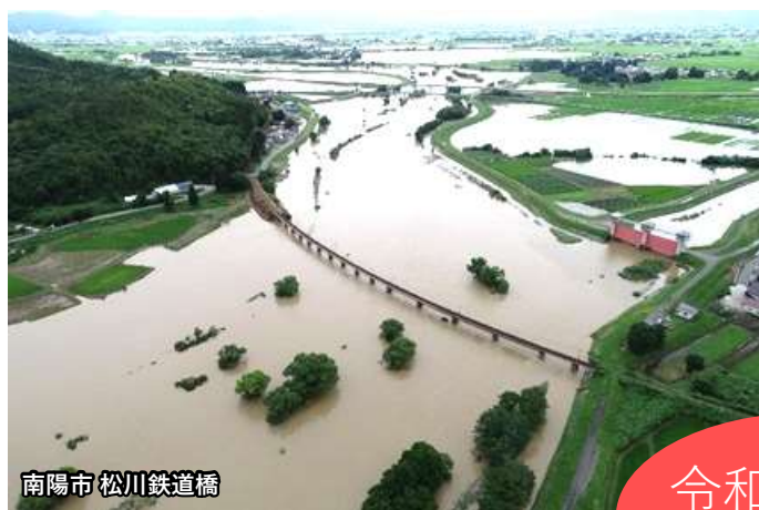
南陽市 松川鉄道橋