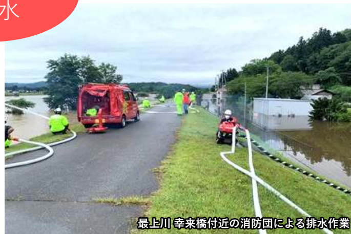
最上川 幸来橋付近の消防団による排水作業

「マイ・タイムライン」は、自分自身の生活に合った命を守るための避難行動計画や、自らの水災害リスクを認識し、「いつ」、「誰が」、「何をするか」を事前に学ぶことができます。