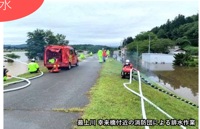
最上川 幸来橋付近の消防団による排水作業