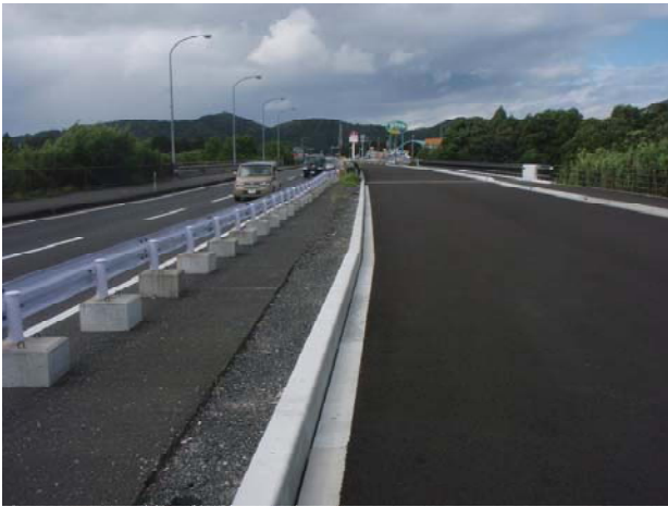
大浦原地区(起点部)付近 (大浦方面から郷之原方面を望む)