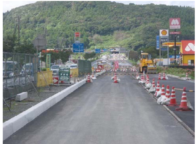
郷之原地区(終点部)付近 (大浦方面から郷之原方面を望む)