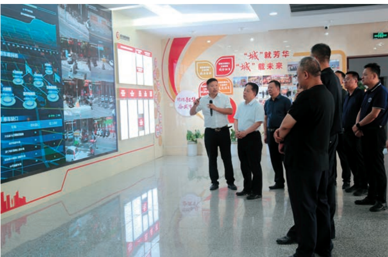
▲ 银川市纪委监委督导调研“停车难”问题整治工作。

市纪委监委主动向市委汇报，先后召开集中整治领导小组会议9次、推进会5次，向市委专报8期，先后印发工作通知、工作提示、督办函93份，3轮督查6个县（市）区及38个市直部门，印发督查通报3期。市委第八轮巡察工作将集中整治作为重点内容，针对15件具体实事，对市人社局、水务局等4个部门全面巡察。同时，坚持“挂图作战”，把整治突出