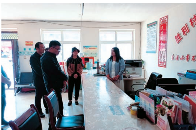
▲ 固原市纪委监委督导调研泾源县集中整治工作。