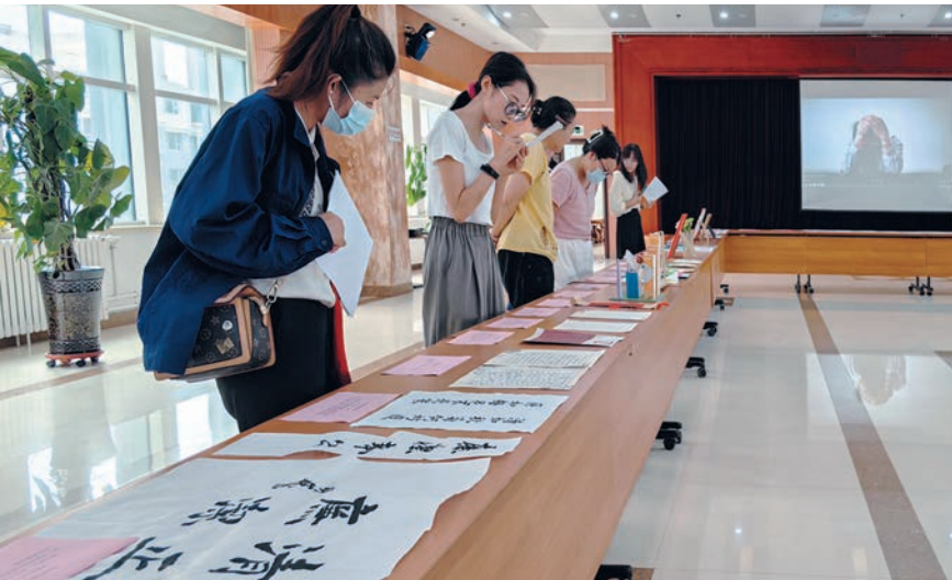
▲ 宁夏电投集团开展“清风伴我行 廉洁润我心”廉洁文化作品征集活动，组织职工进行现场评选。

抓体制机制，督促堵塞制度漏洞。深入剖析监督检查和执纪执法中发现的制度短板和监管漏洞，及时下发纪检监