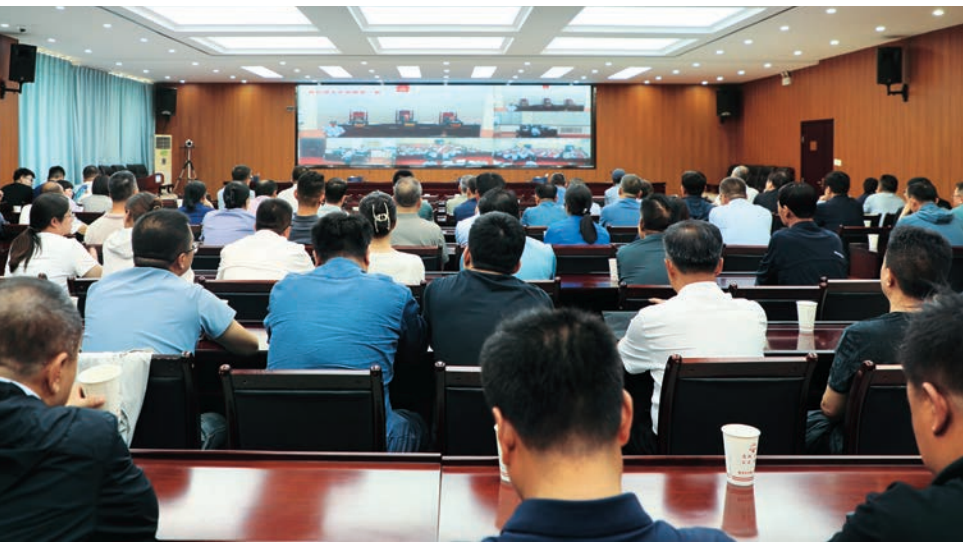
▲ 吴忠市创新远程联网“云”旁听模式，市县干部同步在线、异地远程旁听职务犯罪法庭庭审。

（单位）党组织和“一把手”述责述廉。坚持抓早抓小，市委书记对重点部门主要负责人进行经常性谈话，对新任职市管干部开展任前“一对一”谈话；市纪委书记常态化调研监督重点部门，建立对被巡察单位党组织“一把手”集中约谈等谈话机制，持续传导压力。深化政治监督，围绕党中央重大决策部署，紧盯“三区建设”“四新任务”“五大战略”、建设绿色发展先行市、能源综合示范市等区市中心任务，