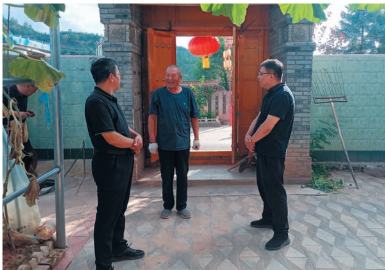
▲ 固原市纪委监委督导调研泾源县集中整治工作开展情况。

栏、道路硬化等方面贪污受贿、优亲厚友、虚报冒领的问题为“小切口”，推动大治理。聚焦重点找题。围绕“四个聚焦”重点整治内容，督促职能部门开展“拉网式”排查，征集“点题”项目110个，选定24项整治重点。市人力资源和社会保障局全面摸底排查、调研分析，对发现存在个别死亡、服刑人员违规参保、虚报冒领、侵占社会保险基金严重损害群众切身利益的问题，开展专项整治。