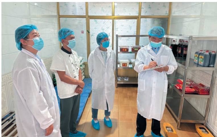
▲ 吴忠市纪委监委会同市场监管、教育部门，联合开展校园食品安全和膳食经费管理专项抽查。

以“铸牢中华民族共同体意识示范市创建”为主题，跟进监督、点题监督，压实政治责任。