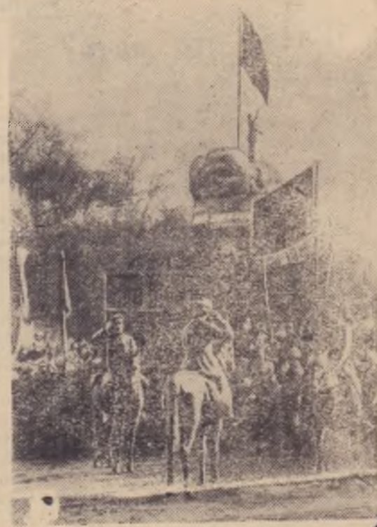
Поднятие Красного знамени в честь провозглашения Советской власти в Ташкенте.

Почти полвека прошло с той поры, когда Ленин, выступая 25 октября (7 ноября) 1917 года с докладом о задачах власти Советов на заседании Петроградского Совета, сказал: «Отныне наступает новая полоса в истории России, и данная, третья русская революция должна в своем конечном итоге привести к победе социализма». Пророческие слова великого вождя революции сбылись.