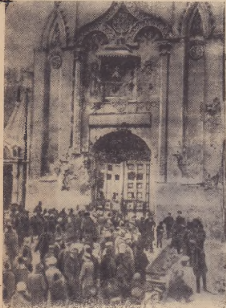
Ноябрь 1917 года. Кремль взят. У Никольских ворот.