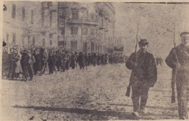
Чита. 1917 год. Красная гвардия.

Организовать Советскую власть в г. Иркутске, отстранив агентов Временного правительства Керенского и подчинив Советской власти все местные правительственные учреждения».