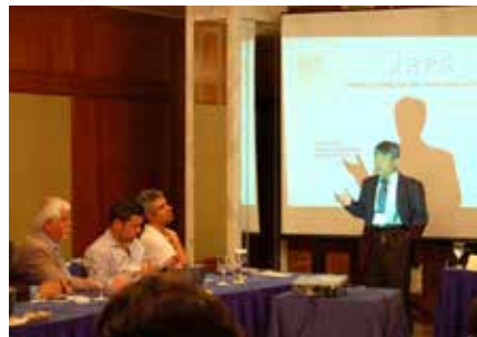
竹安 JSPS London センター長による挨拶

FP7 と同様、Horison2020 にも、引き続き全世界に門戸が開かれており、個