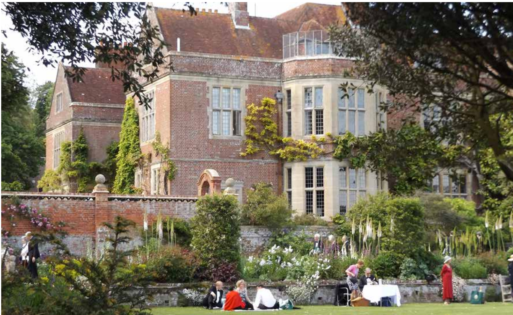
南イングランドの田園地帯グラインドボーンで行われるオペラフェスティバル。 一張羅に身を包んだオペラファンが、オペラもピクニックも楽しむという1日がかりの行楽。天候にも恵まれたこの日、誰もが至福のときを過ごす。