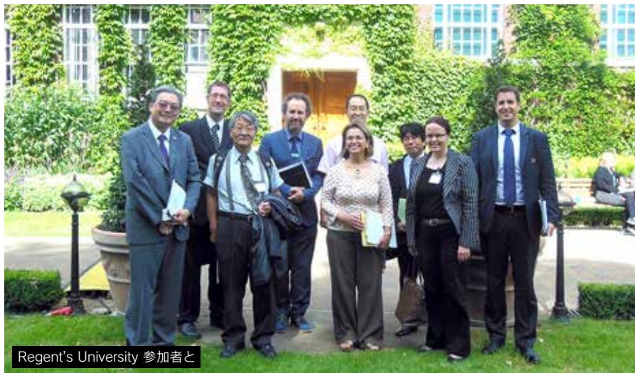
Regent's University 参加者と