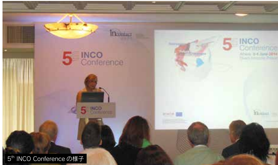
5 th INCO Conferenceの様子

2014年6月2日から4日にかけて、ギリシャのアテネで開催された5 th INCO Conference “Addressing Future Challenges” に出席すると共に、FP7 1 プロジェクト”Japan-EU Partnership in Innovation, Science and Technology (JEUPISTE)”の活動の一環として開催されたトレーニングコースに参加して、当センターの事業説明を実施した。