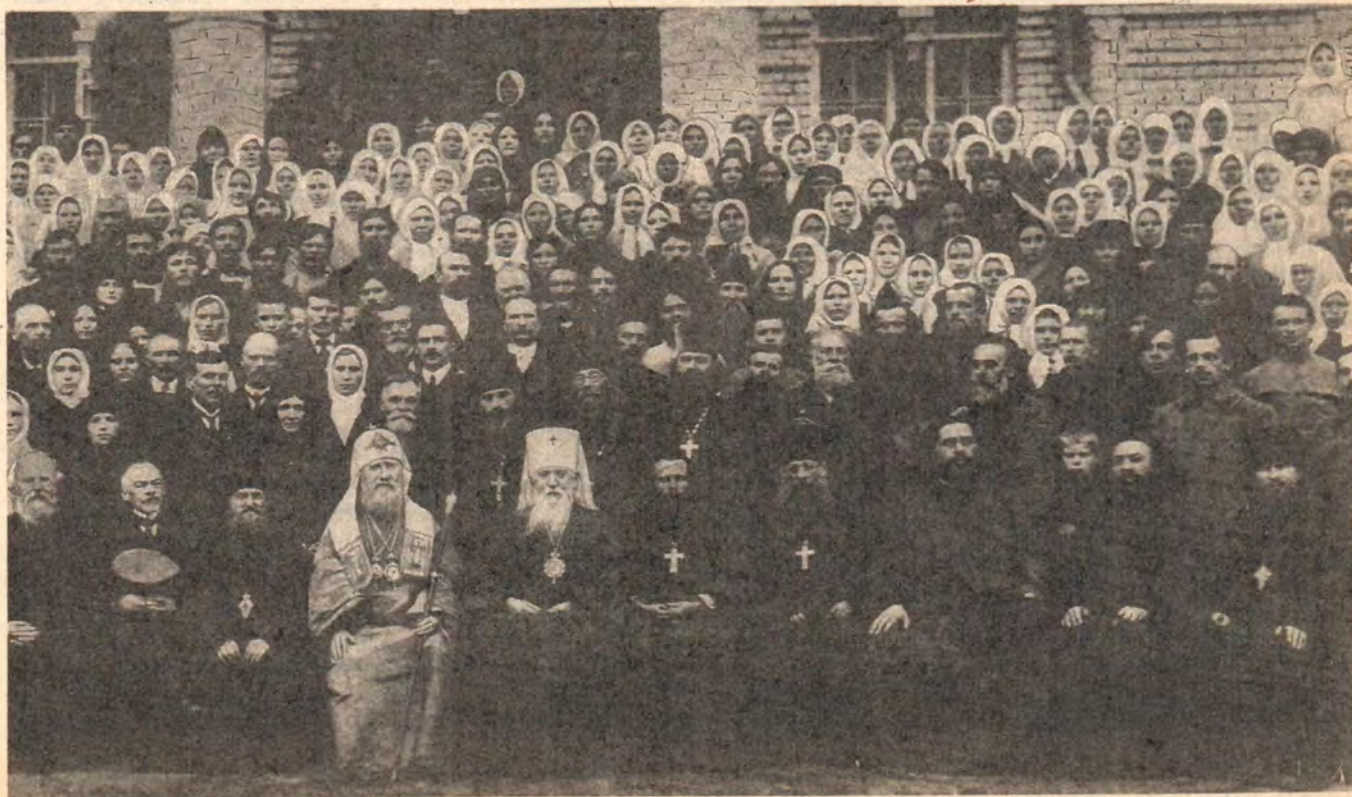
Святейший Патриарх Московский и всея России Тихон на торжестве освящения собора в Казанском женском монастыре