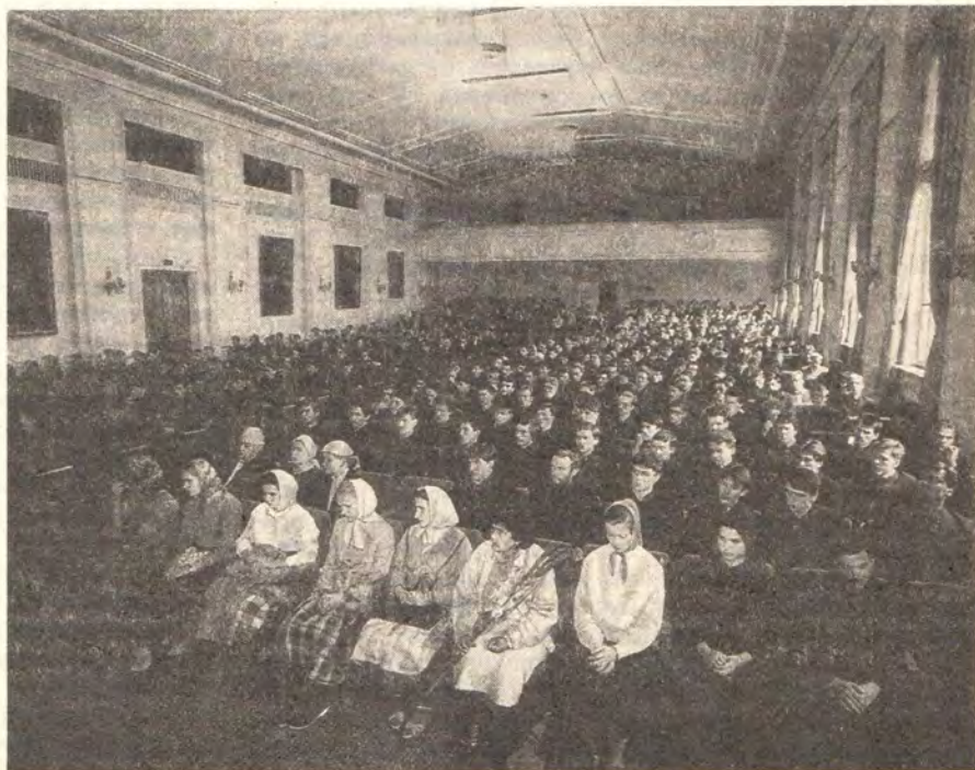
В актовом зале

личной творческой биографии и связанной с этим периодом таинственный и глубокий процесс личного обновления. Вступить в этот святой удел духовного просвещения можно только внутренне изменившись, очистив совесть и ум от всего того, что недостойно вашего призвания и будущего служения. Вы должны осознать себя не просто в новой ситуации, но и в новом духовно-нравственном измерении, в котором все ваши воззрения на мир, на лю-