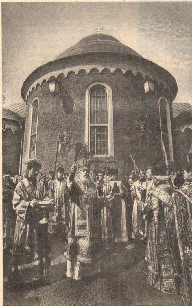
Святейший Патриарх Алексей II совершает крестный ход с молебном вокруг московского храма святых Адриана и Наталии в день престольного праздника 8 сентября 1991 года