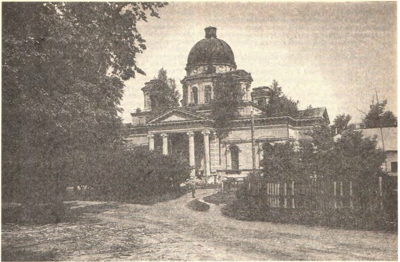
Христорождественский собор в Вышенской Успенской пустыни

Матери и на месте, где она пристала, заложили новую обитель.