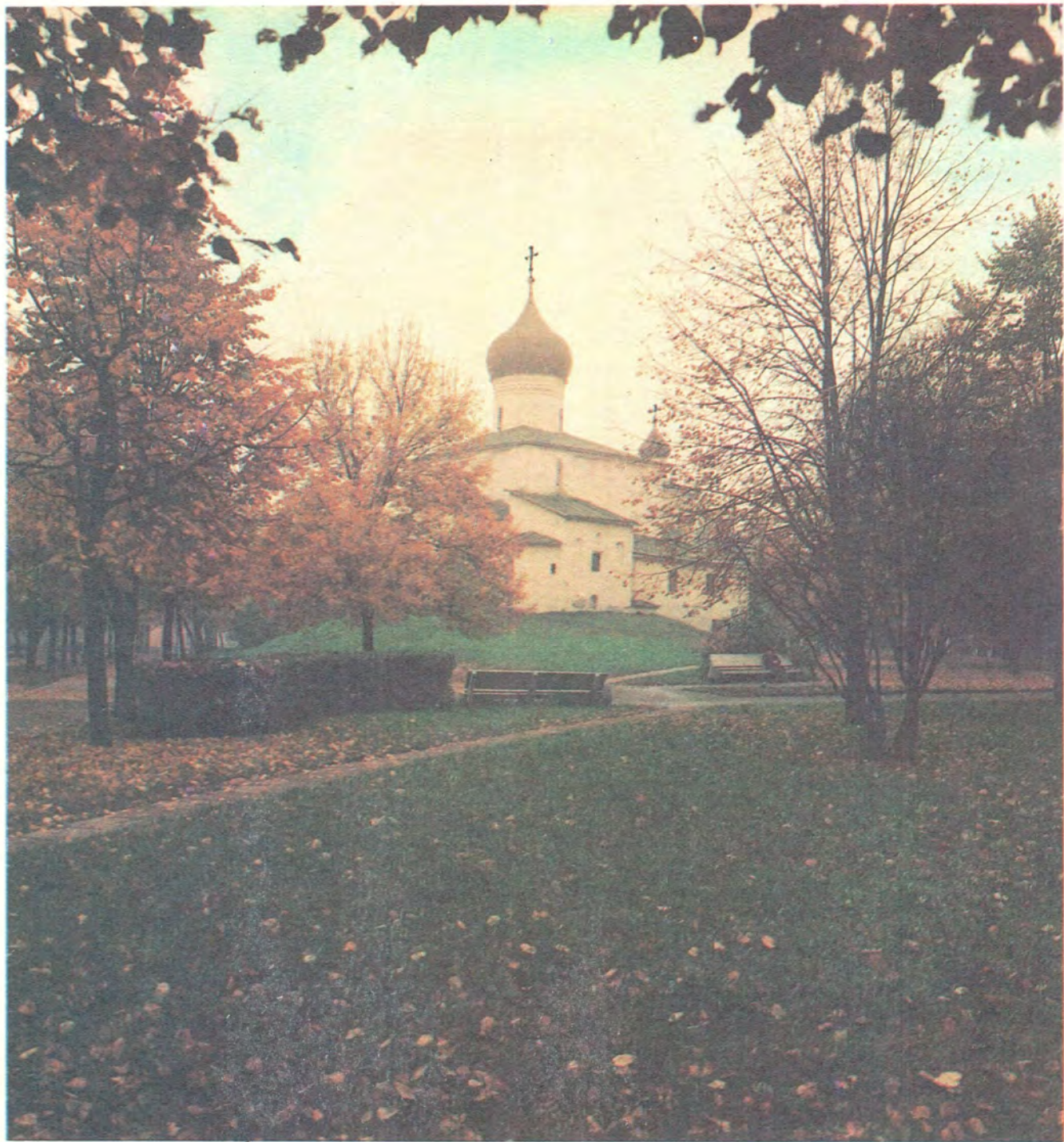
ХРАМ ВО ИМЯ СВЯТИТЕЛЯ ВАСИЛИЯ ВЕЛИКОГО В ПСКОВЕ