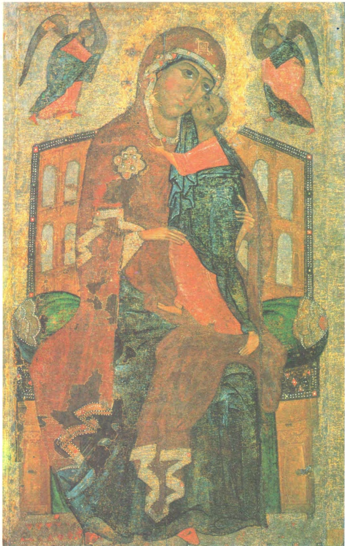
ТОЛГСКАЯ ИКОНА БОЖИЕЙ МАТЕРИ НА ТРОНЕ

Празднование в честь иконы совершается 8/21 августа