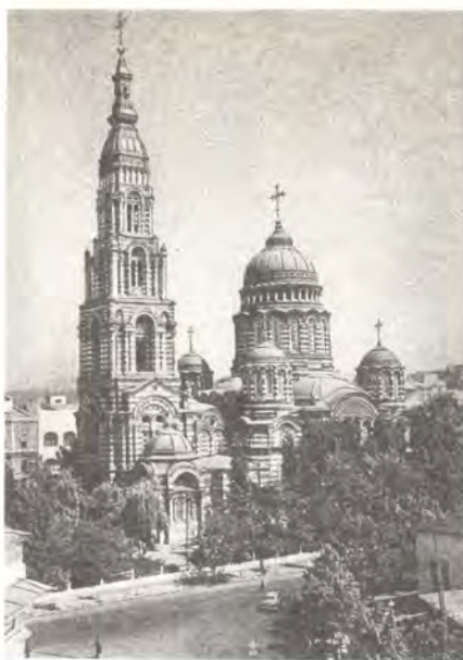
Благовещенский кафедральный собор в Харькове

По-особому, волнующе, они проходили в Киеве 14—16 июня, потому что именно здесь, в водах сегоднего Днепра, этого русского Иордана, тысячу лет назад киевляне приняли