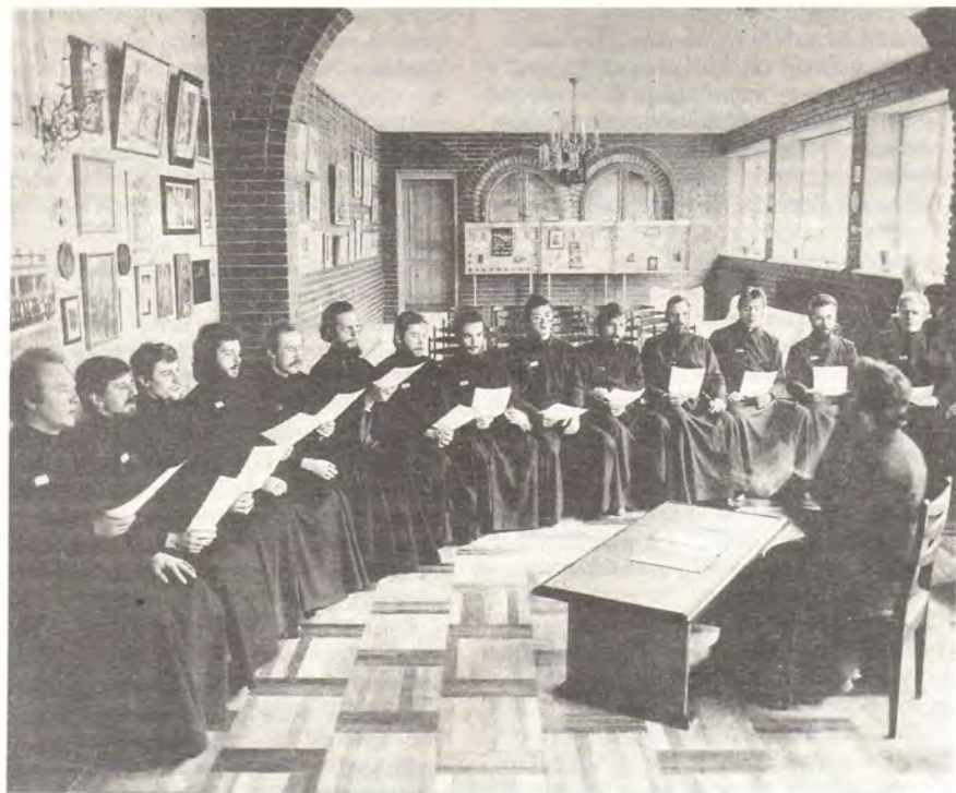
Спевка мужского хора Издательского отдела Московской Патриархии

традициям и ортодоксальностью. Коллектив состоит из исполнителей, имеющих опыт службы церковных регентов и певцов.