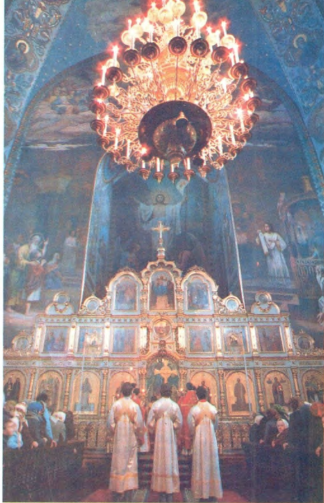
Богослужение в Никольском соборе