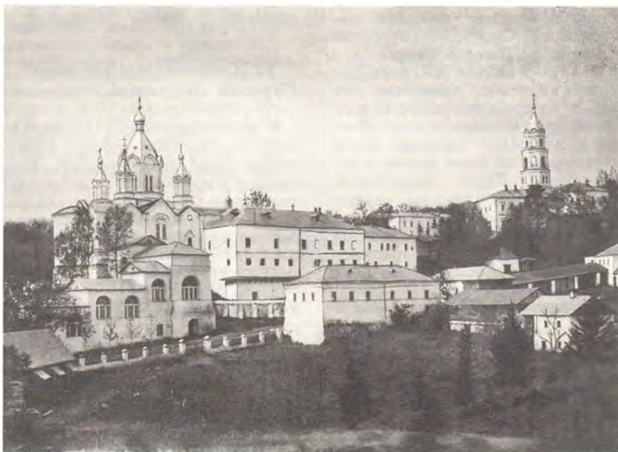
Общий вид Коренной пустыни с северной стороны

Была обновлена и церковь «Животворящего Источника». В центре ее, перед алтарем, находился огороженный железной решеткой колодец; в металлический чан, сооруженный для лучшего течения воды Коренного источника, верующие имели обыкновение бросать серебряные и медные деньги; иногда собиралась немалая сумма. Южные двери храма выходили на небольшой дворик, на западной стороне которого покаместность горы была обсечена отвесно и вымощена камнем; неподалеку сквозь проделанное в камне отверстие можно было увидеть корень того самого вяза, у которого была найдена в 1295 году чудотворная икона Знамения Божией Матери. В 1885 году корень еще испускал три живых зеленых отростка. Деревянный щит с изображением Коренной иконы в момент обретения, в руках нашедшего ее человека с фонарем-лампой перед нею, укрывался