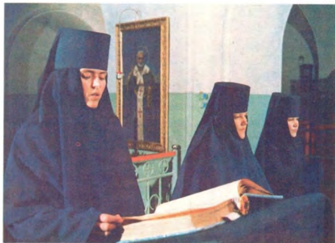
Сестры на послушаниях: за богослужением и в швейной мастерской