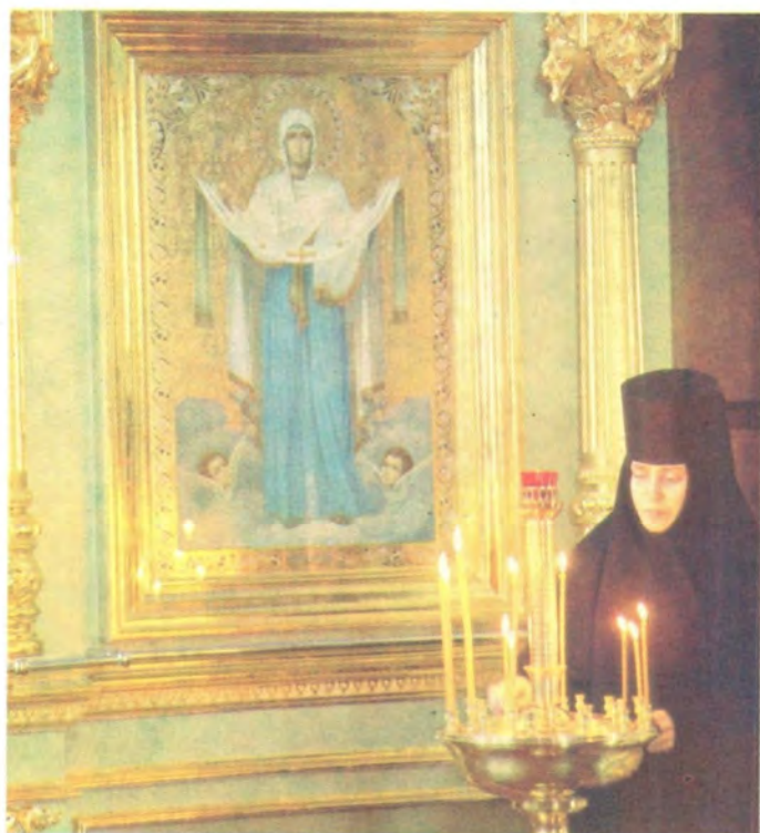
Святыня обители — икона Покрова Пресвятой Богородицы