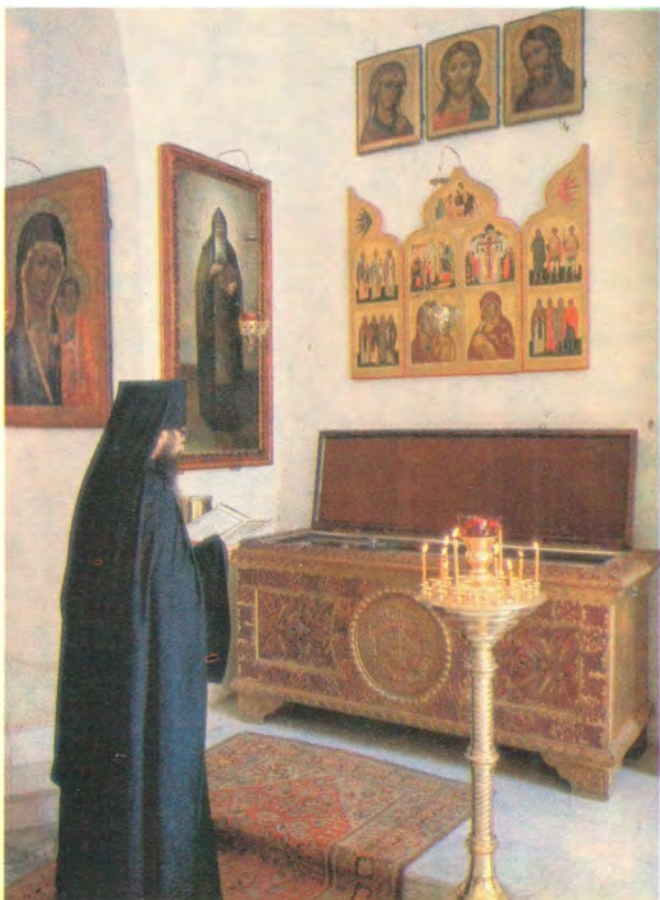
У раки с мощами преподобного Амвросия