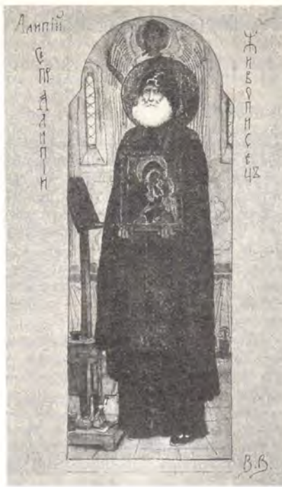
Преподобный Алимпий Печерский

Из дошедших до нас древних икон предание приписывает преподобному Алипию три: «Богоматерь с предстоящими Ей преподобными Антонием и Феодосием» из Свен-