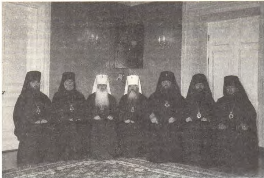
Участвовавшие в хиротонии епископа Антония (крайний справа) иерархи после Божественной литургии

взыщу овец Моих от руки их, и не дам им более пасти овец (Иез. 34, 2, 7—8, 10).