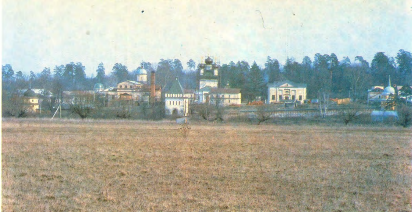
Общий вид Оптиной пустыни