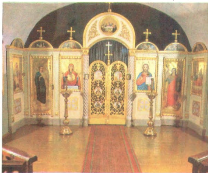
Подземный храм в честь иконы Божией Матери «Живородный Источник»