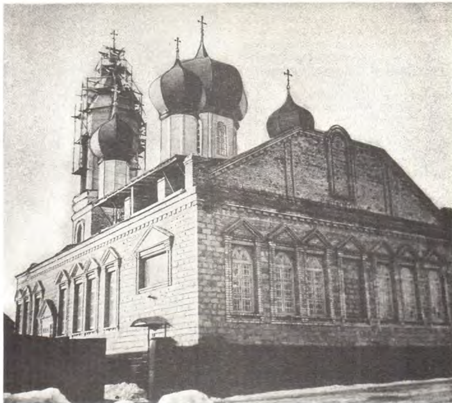
Храм в честь Рождества Пресвятой Богородицы в г. Красный Луч

Приходы Ворошиловградской епархии к этому знаменательному юбилею также старались украсить свои храмы как внутри, так и снаружи, пополнить их новой утварью, провести ремонтно-восстановительные работы. Во всех приходах епархии прошли торжества Тысячелетия Крещения Руси. В приходе