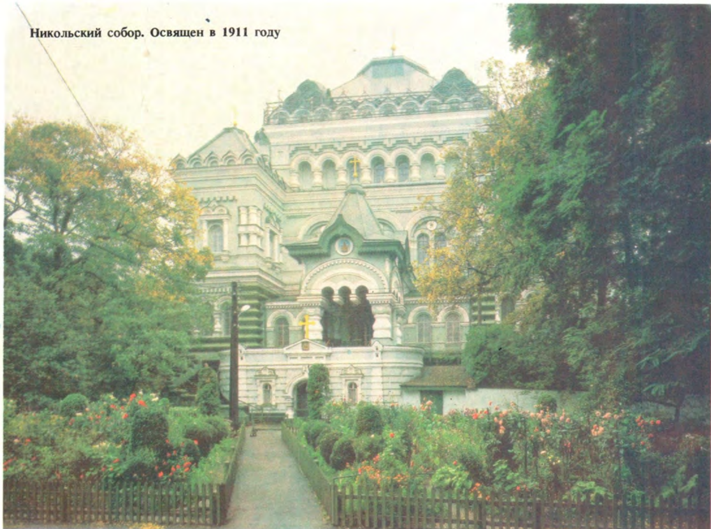
Никольский собор. Освящен в 1911 году