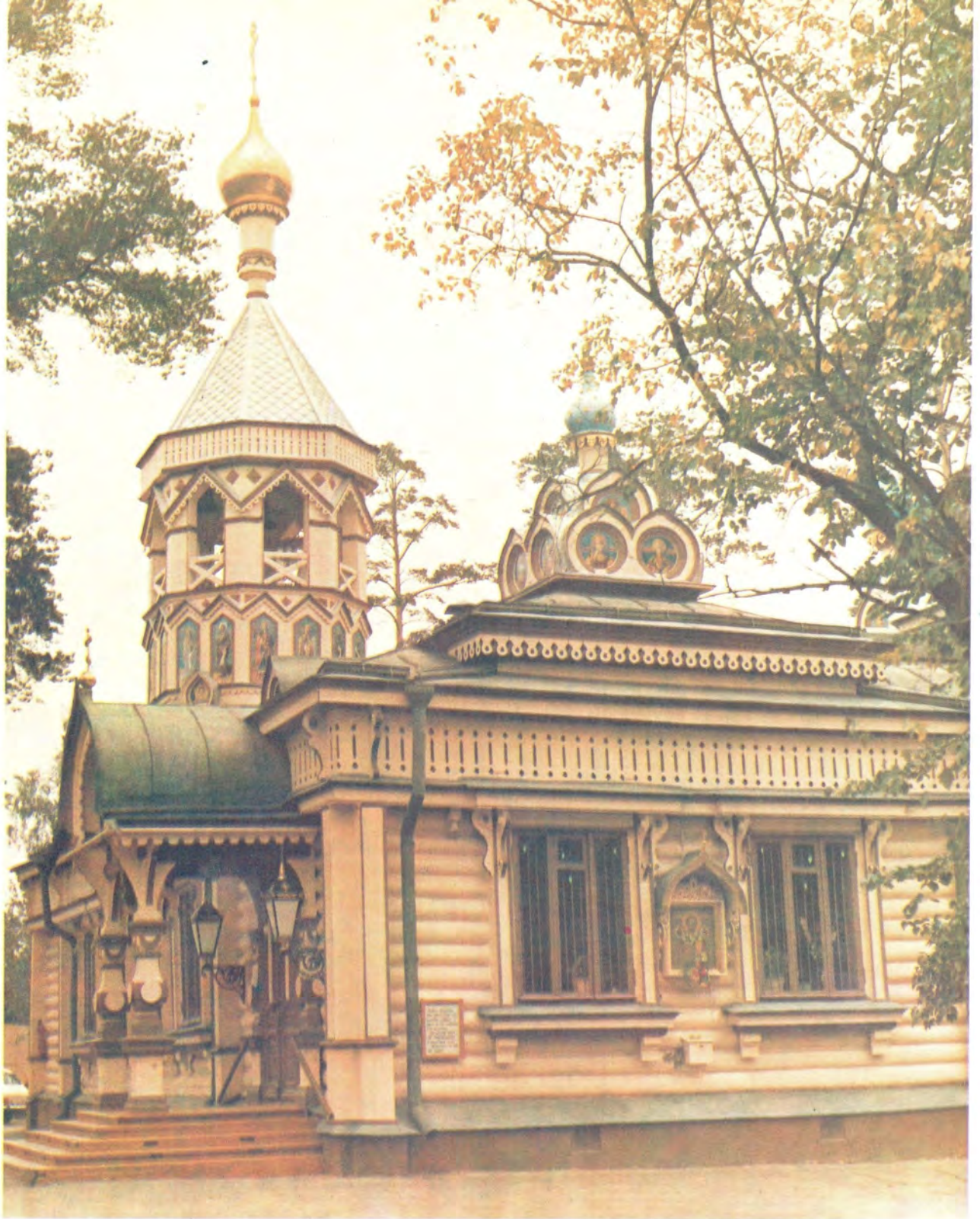
СВЯТО-ТРОИЦКИЙ ХРАМ В ПОДМОСКОВНОМ ПОСЕЛКЕ УДЕЛЬНАЯ (см. статью в номере)