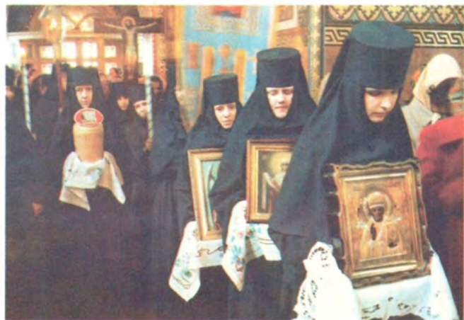
Крестный ход на Светлой седмице