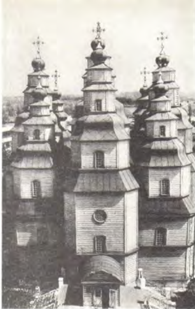
Свято-Троицкий храм в г. Новомосковске

Митрополит Леонтий обратился к присутствовавшим с приветственной речью. Под молитвенное и вдохновенное пение хора под управлением Л. Журавлевой Высокопреосвященный Леонтий в сослужении благочинного протоиерея Константина Огиенко и