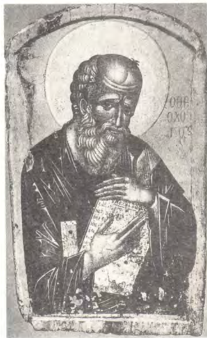
Икона святого апостола Иоанна Богослова из Патмосской обители, XIV век

Монастырь во имя апостола Иоанна Богослова на острове Патмос