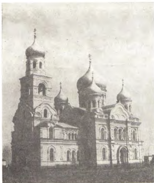
Храм в с. Никольское (Астраханская епархия)