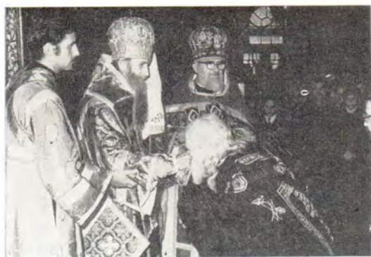
В Успенском соборе к Патриарху Сербскому Герману подходит и целует крест лаврский схиигумен Селафиил