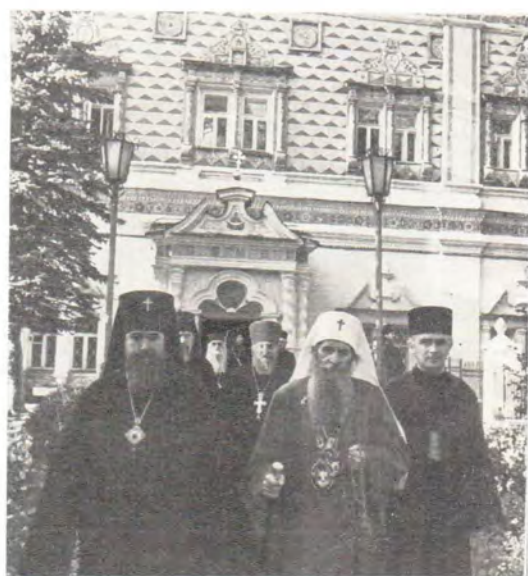
Патриарх Сербский Герман в сопровождении архиепископа Дмитровского Александра выходит из здания МДА после знакомства с жизнью Академии