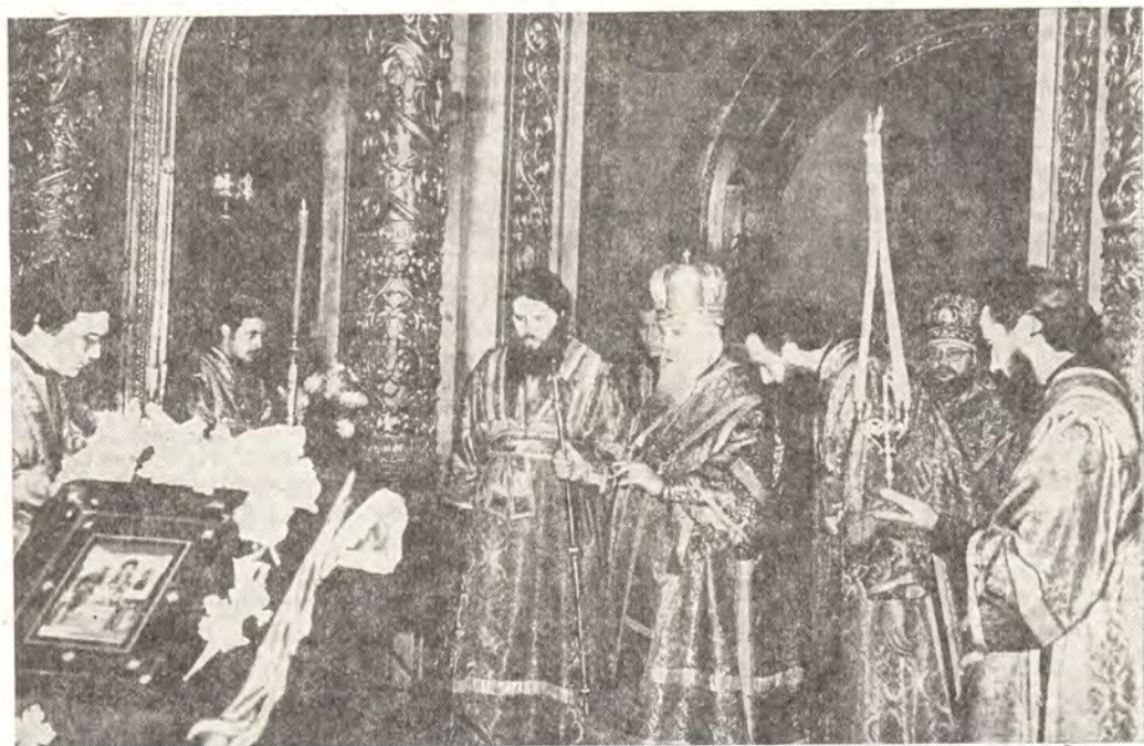
Святейший Патриарх Пимен за всенощным бдением в Богоявленском патриаршем соборе в канун праздника Воздвижения Честного и Животворящего Креста Господня, 26 сентября 1986 года

14 (1) октября, в праздник Покрова Пресвятой Богородицы, Святейший Патриарх Пимен молился и причащался Святых Христовых Таин за Божественной литургией в патриаршем соборе. Накануне в том же соборе Святейший Патриарх Пимен совершил всенощное бдение в сослужении архиепископа Зарайского Иова. За всенощным бдением Его Святейшество помазывал молящихся освященным елеем.