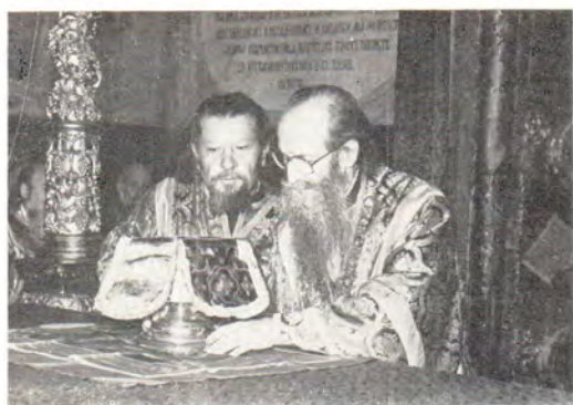
Патриарх Сербский Герман у престола во время совершения Божественной литургии в Успенском соборе Троице-Сергиевой Лавры