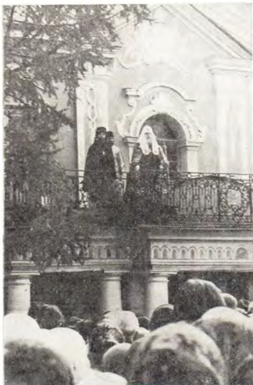
◀ Святейший Патриарх Пимен с балкона патриарших покоев благословляет паломников