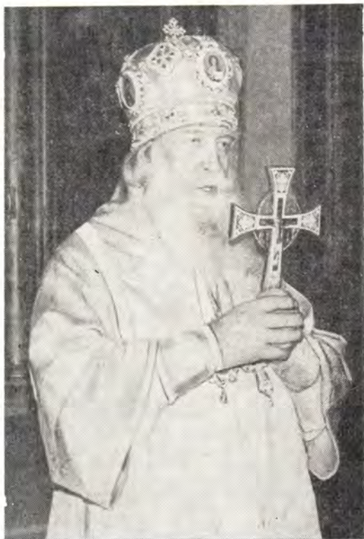
Богослужение совершает митрополит Калининский и Кашинский Алексей

Калининская епархия. Юбилей архи­пастыря. 21 июля 1986 года, в праздник