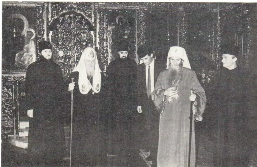
Святейший Патриарх Пимен и Патриарх Сербский Герман в Сергиевском трапезном храме Троице-Сергиевой Лавры перед приемом по случаю тезоименитства Предстоятеля Русской Православной Церкви, 9 сентября 1986 года