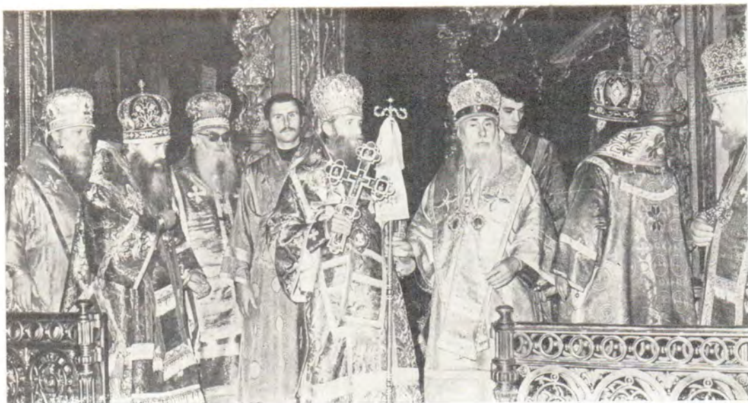
После Божественной литургии в Успенском соборе Троице-Сергиевой Лавры Патриарха Сербского Германа приветствует митрополит Одесский и Херсонский Сергей