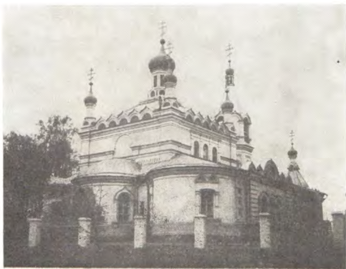
Храм в Солнечногорске (Московская епархия)