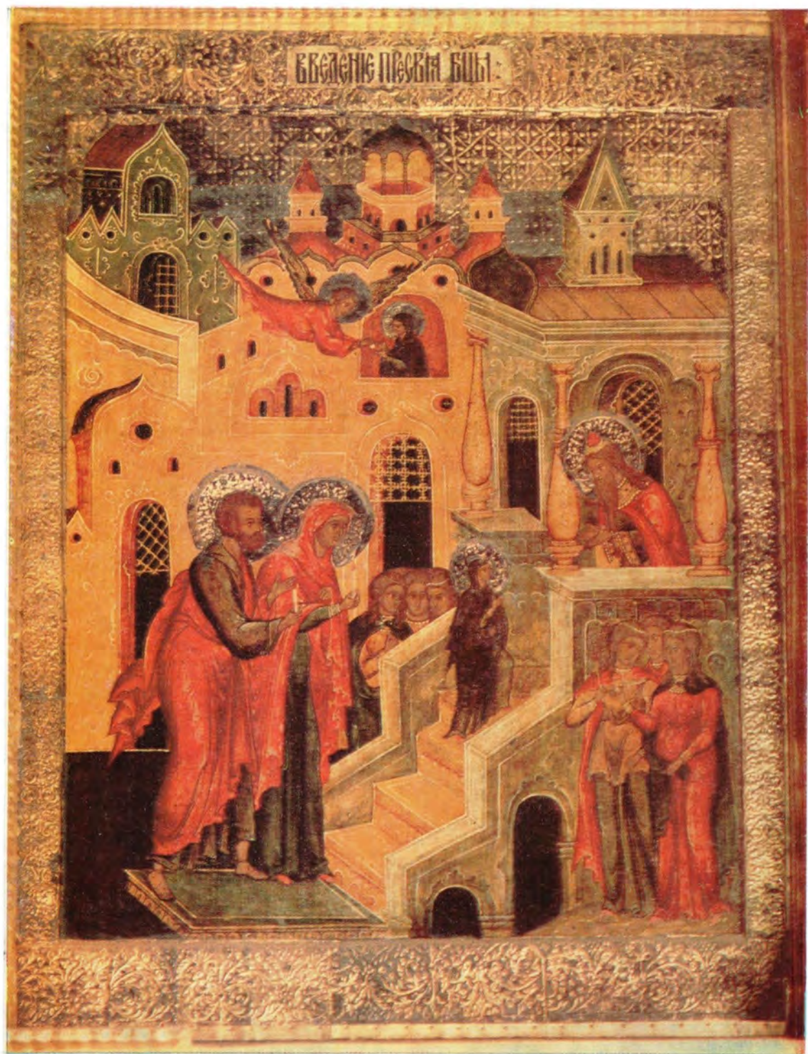
ВВЕДЕНИЕ ПРЕСВЯТОЙ БОГОРОДИЦЫ ВО ХРАМ