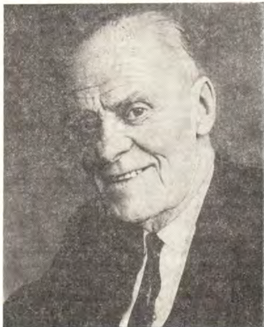
Д-р В. А. Виссер'т Хоофт 1900—1985

В богослужении реформатов, отличающемся строгой простотой, большое место занимает пение духовных гимнов и псалмов. Нам кажется, что поиск Кафолического Предания Церкви у реформатов в известном смысле продолжается сегодня, в частности в рамках экуменического движения. Об этом свидетельствует глубокий интерес пастора Виссер'т Хоофта к православной экклезиологии.