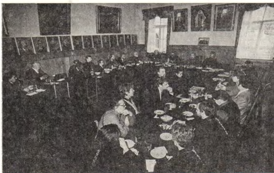
Заседание Совета Ленинградских Духовных школ 31 августа 1986 года