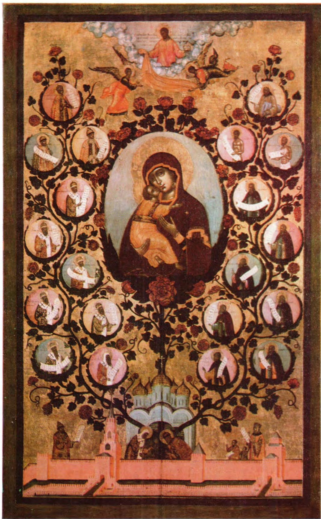
ДРЕВО ГОСУДАРСТВА МОСКОВСКОГО