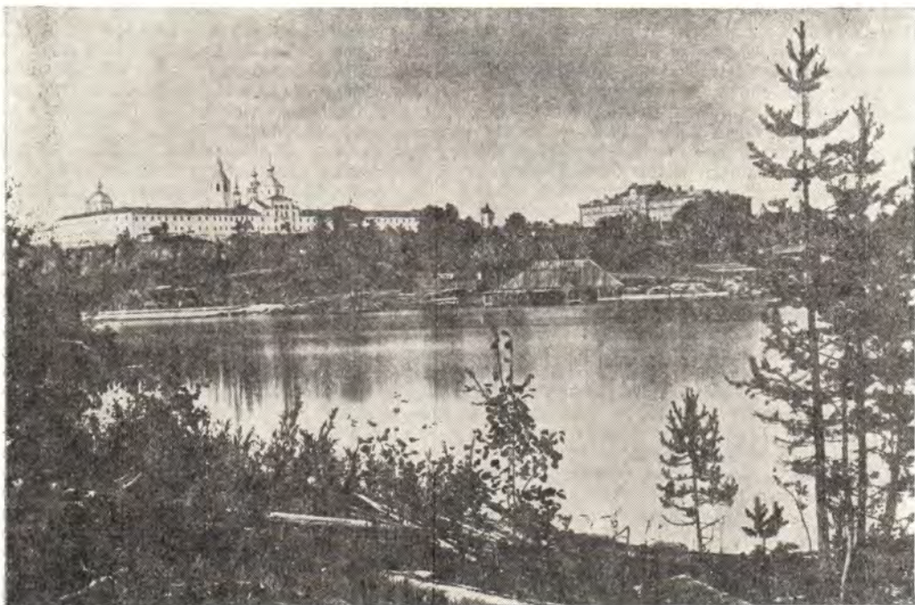
Общий вид Валаамского монастыря в конце XIX — начале XX века

и во всяком сане угодники Божии пасли вверенное им стадо посреди многих скорбей и искушений. «И сей есть праздник любимца Божия, егда пошлет ему Господь дарование скорбей. Сию чашу Сын Божий испил и обещал всем Своим последователям».