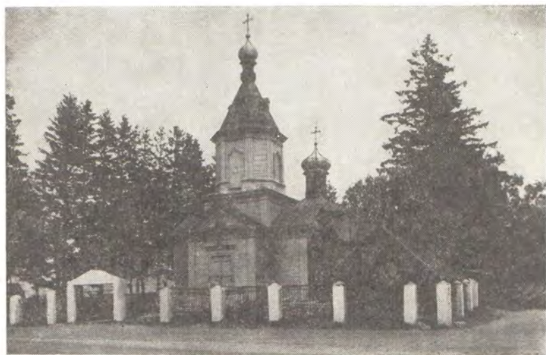
Храм в с. Тащилово (Владимирская епархия)