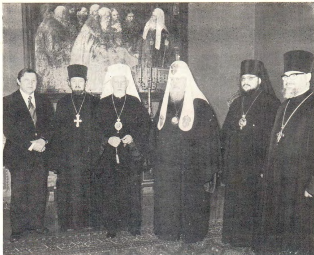
5 апреля 1979 года Высокопреосвященный Архиепископ Карельский и всей Финляндии Павел нанес визит Святейшему Патриарху Московскому и всея Руси Пимену. К стр. 6

Внизу: на торжественном акте по случаю 60-летия самостоятельности Финляндской Православной Церкви 26 ноября 1978 года, Хельсинки. В праздновании приняли участие митрополит Ленинградский и Новгородский Антоний и управляющий Патриаршими приходами в Финляндии архиепископ Выборгский Кирилл. В первом ряду на фото — Архиепископ Карельский и всей Финляндии Павел и Президент Республики д-р Урхо Калева Кекконен. (См. «ЖМП», 1979, № 4, с. 61—64).