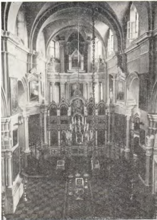
Кафедральный собор во имя Святого Духа в г. Минске

христианском долге верующего человека следовать евангельским добродетелям, собирать духовные сокровища «в Бога богатей» (ср. Лк. 12, 21). Затем архипастырь преподал братии и молящимся благословение.