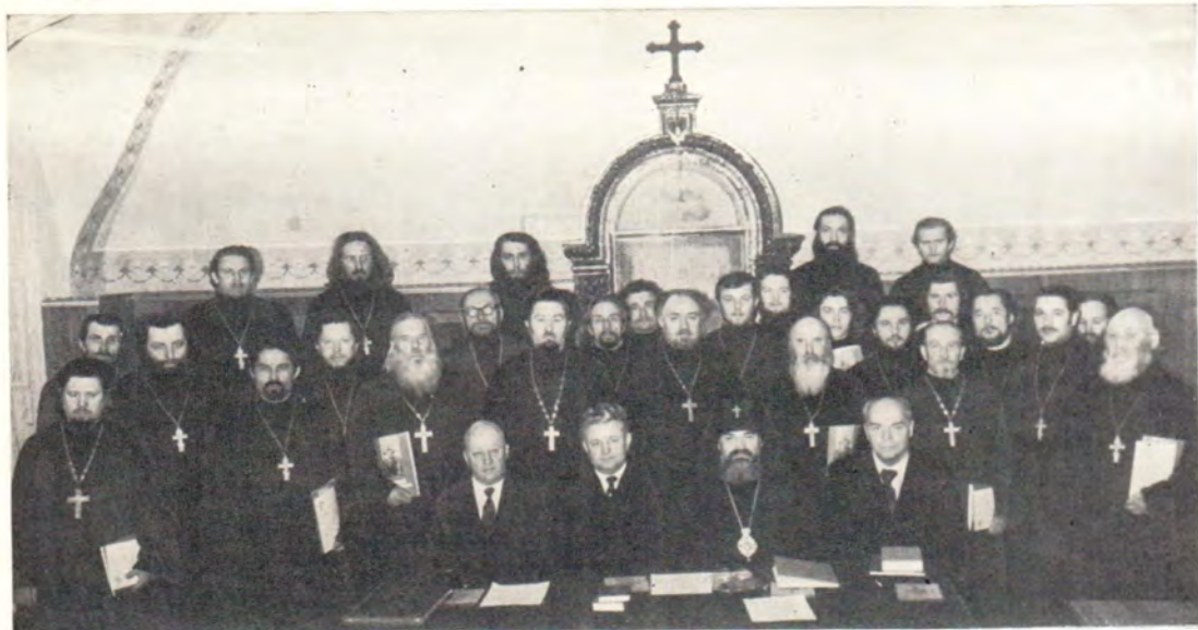
Участники епархиального совещания в Смоленске 8 февраля 1979 года во главе с архиепископом Смоленским и Вяземским Феодосием. К стр. 44