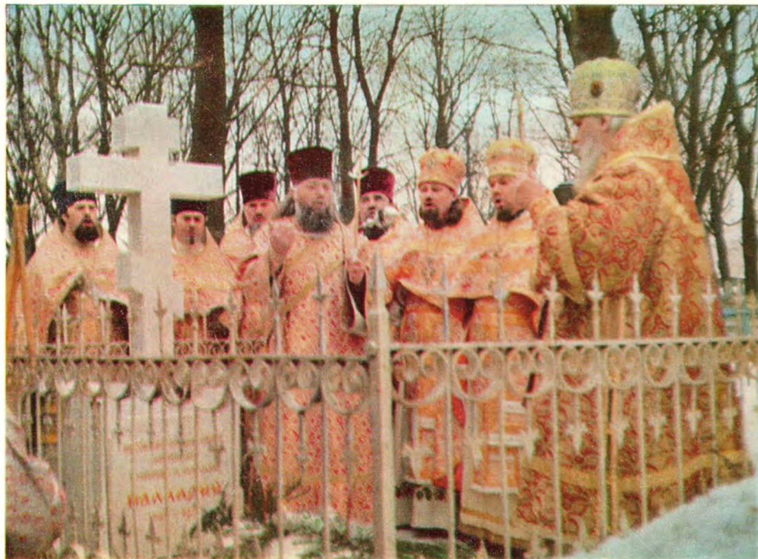
20 января 1979 года, Собор Предтечи и Крестителя Господня Иоанна, архиепископ Орловский и Брянский Глеб совершил в Иоанно-Крестительском храме в г. Орле Божественную литургию, а накануне — всенощное бдение (фото внизу). После литургии архиепископ Глеб с сослужащими клириками совершил заупокойную литию на могиле митрополита Палладия, погребенного близ Иоанно-Крестительского храма (фото вверху).