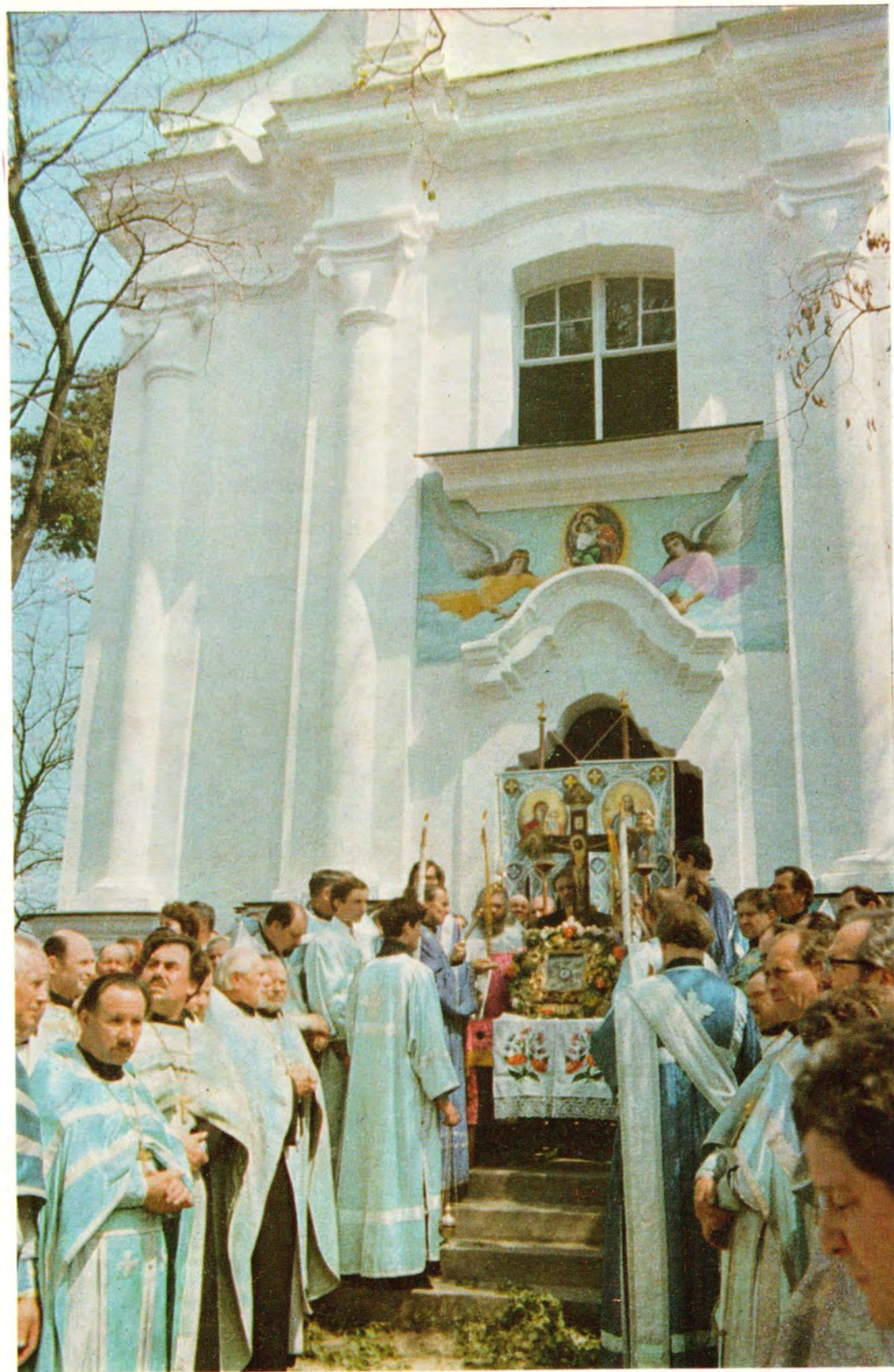
20/7 мая в Жировицком Успенском монастыре (Минская епархия) совершается ежегодное празднование в честь местночтимой Жировицкой иконы Божией Матери. После литургии чтимый образ торжественно переносится из Успенского собора обители, устанавливается на ступенях Явленского храма, и весь служащий собор совершает перед образом праздничный молебен.