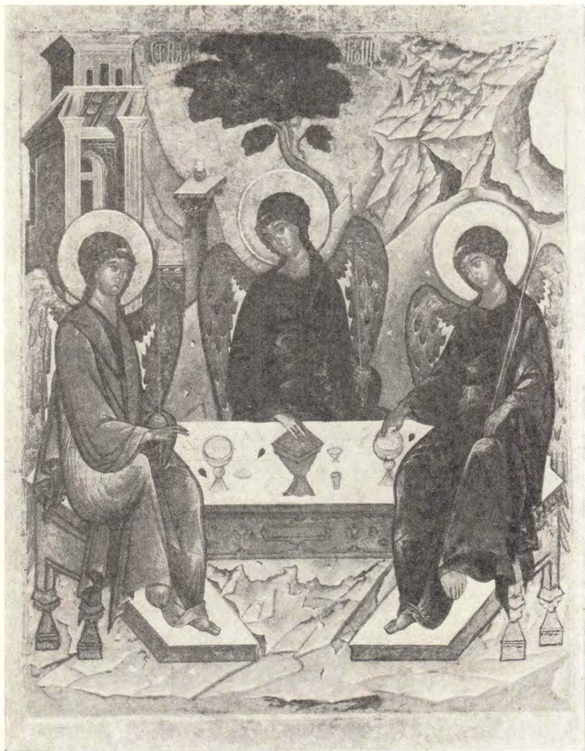
ИКОНА ЖИВОНАЧАЛЬНОЙ ТРОИЦЫ