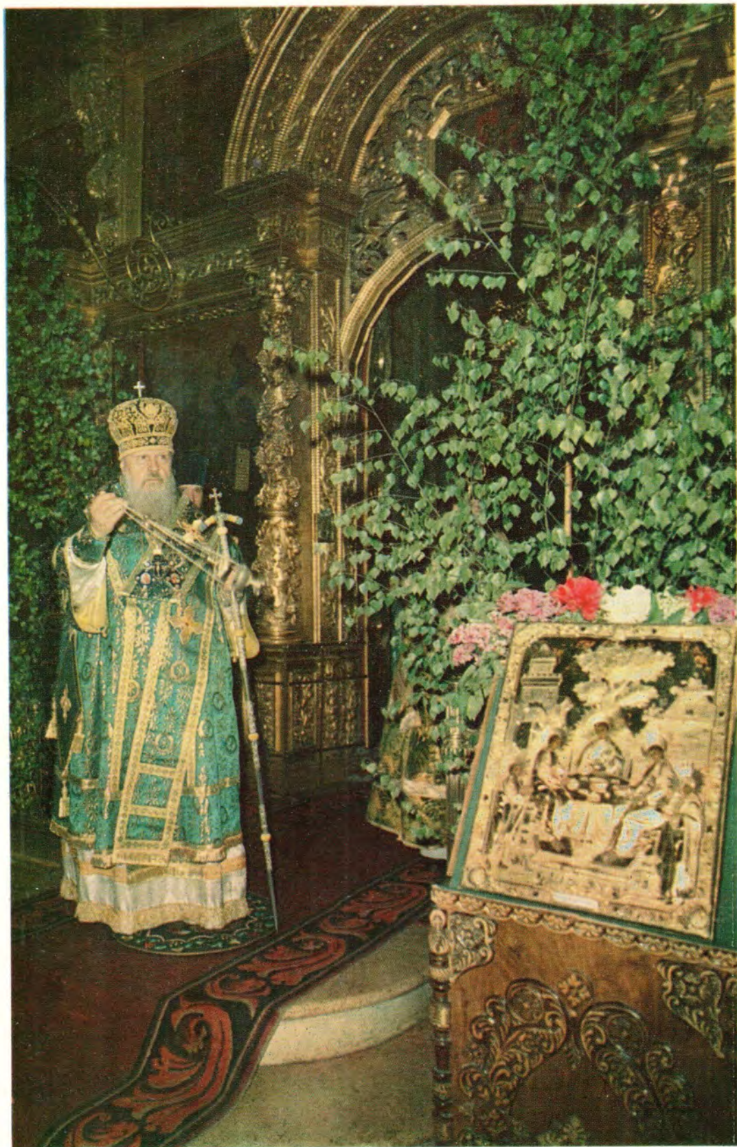
Святейший Патриарх ПИМЕН, священноархимандрит Троице-Сергиевой Лавры, за богослужением в Успенском соборе Лавры в День Святой Троицы в 1978 году.