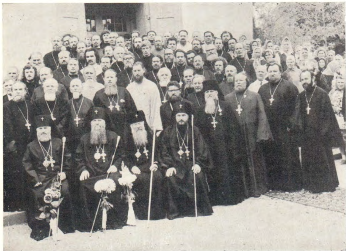
13—14 сентября 1978 года в Свято-Троицком кафедральном соборе в г. Симферополе совершались торжественные богослужения в связи с 50-летием архиепископа Симферопольского и Крымского Леонтия и 30-летием его служения Святой Церкви в священном сане. На снимке: слева направо — архиепископ Ташкентский и Среднеазиатский Варфоломей, архиепископ Симферопольский и Крымский Леонтий, архиепископ Рижский и Латвийский Леонид, архиепископ Харьковский и Богодуховский Никодим с клириками и мирянами после Божественной литургии 14 сентября 1978 года.