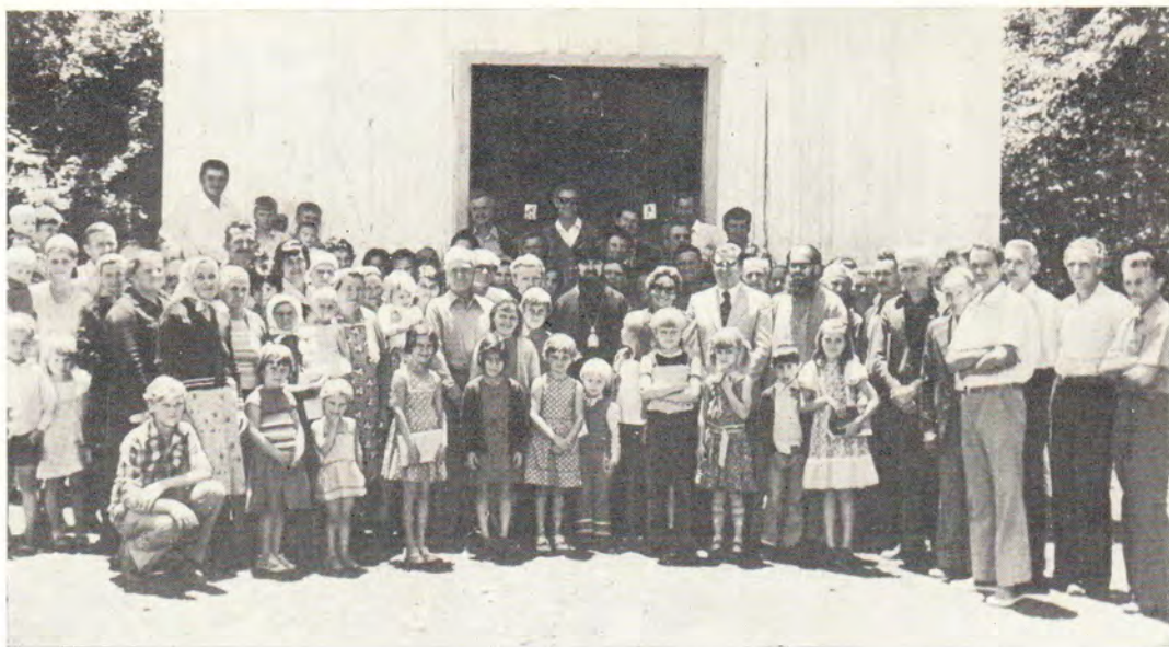
Архиепископ Платон с верующими колонии Баха-Трончо у входа в храм в честь Успения Пресвятой Богородицы. Справа от архиепископа Платона — администратор муниципалитета де лос Элечос Хосе Педро Салдивиа с супругой.