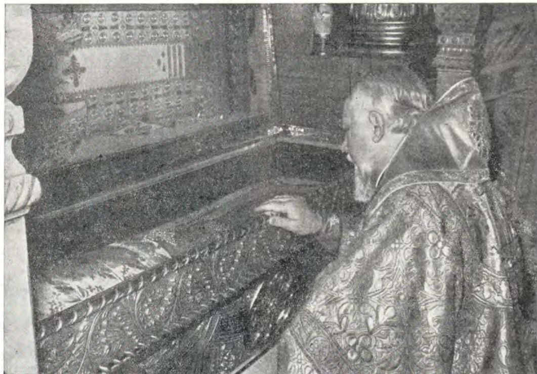
Патриарх Болгарский Максим у раки с мощами святителя Московского Алексия в Богоявленском патриаршем соборе 19 марта 1972 года

В Актовом зале академии состоялось открытое заседание профессорской корпорации, на