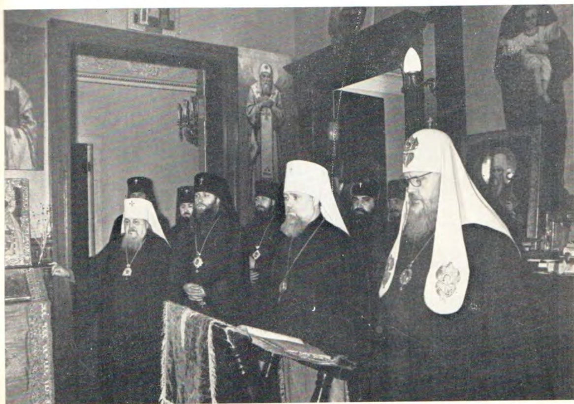
Молебен перед отъездом Святейшего Патриарха Пимена в паломническое путешествие 27 апреля 1972 года