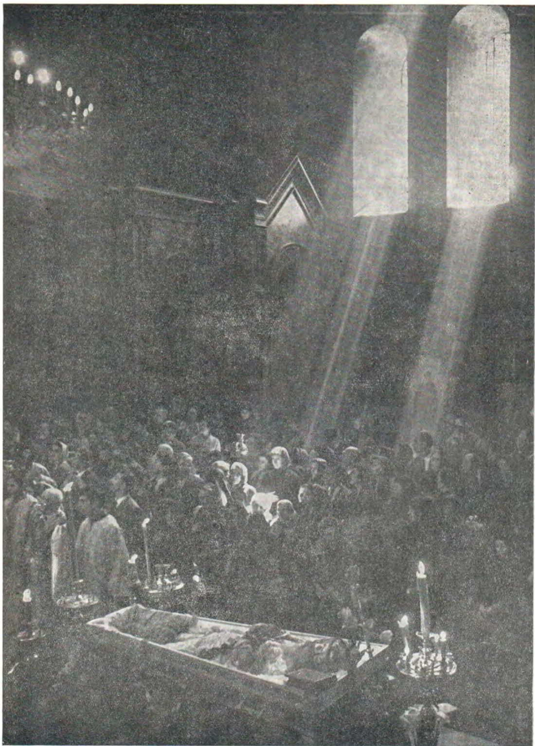
13 апреля 1972 г. Скопский кафедральный собор. У гроба Католикоса-Патриарха Ефрема