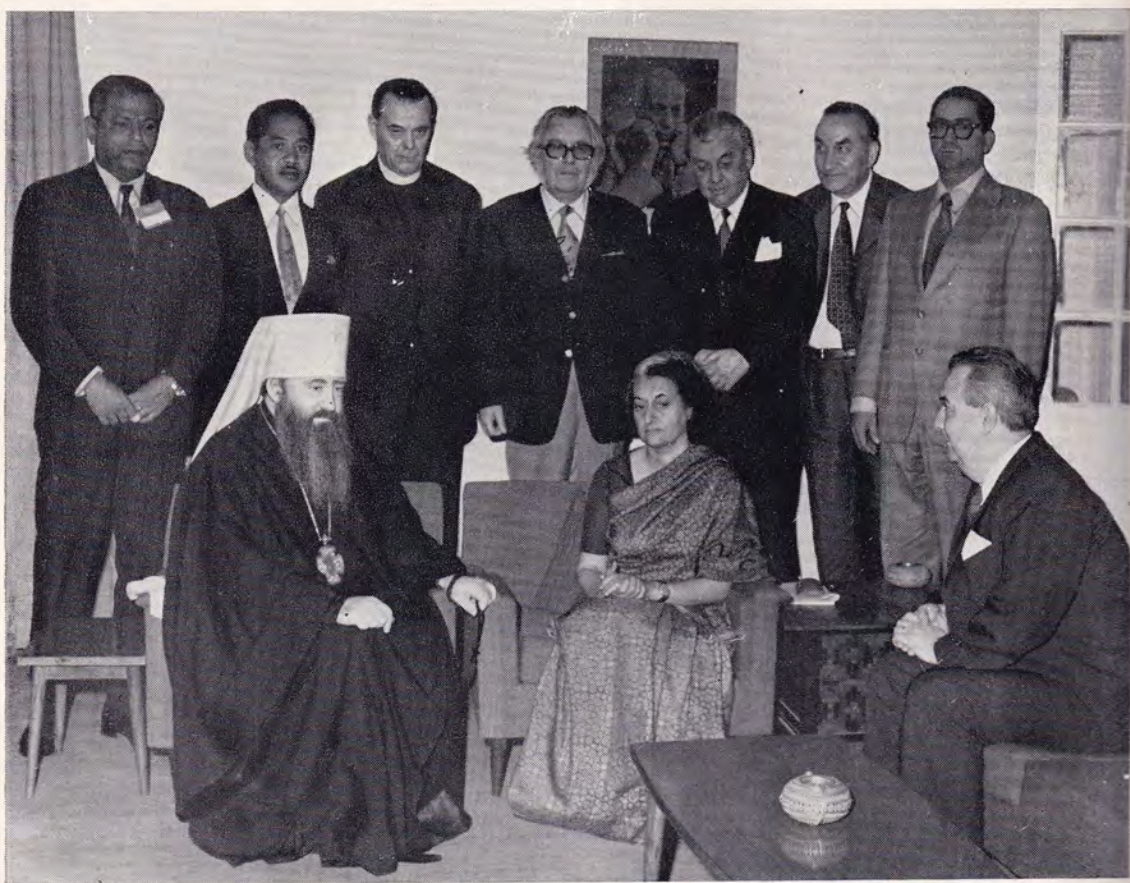
Митрополит Ленинградский и Новгородский Никодим, президент ХМК, и члены Президиума ХМК на приеме у Премьер-Министра Индии г-жи Индиры Ганди 11 марта 1972 года