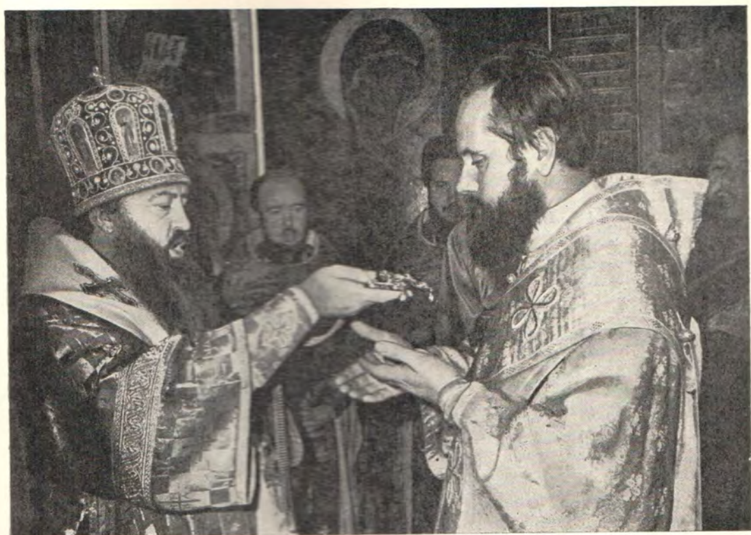
Митрополит Никодим вручает панагию епископу Зарайскому Хризостому