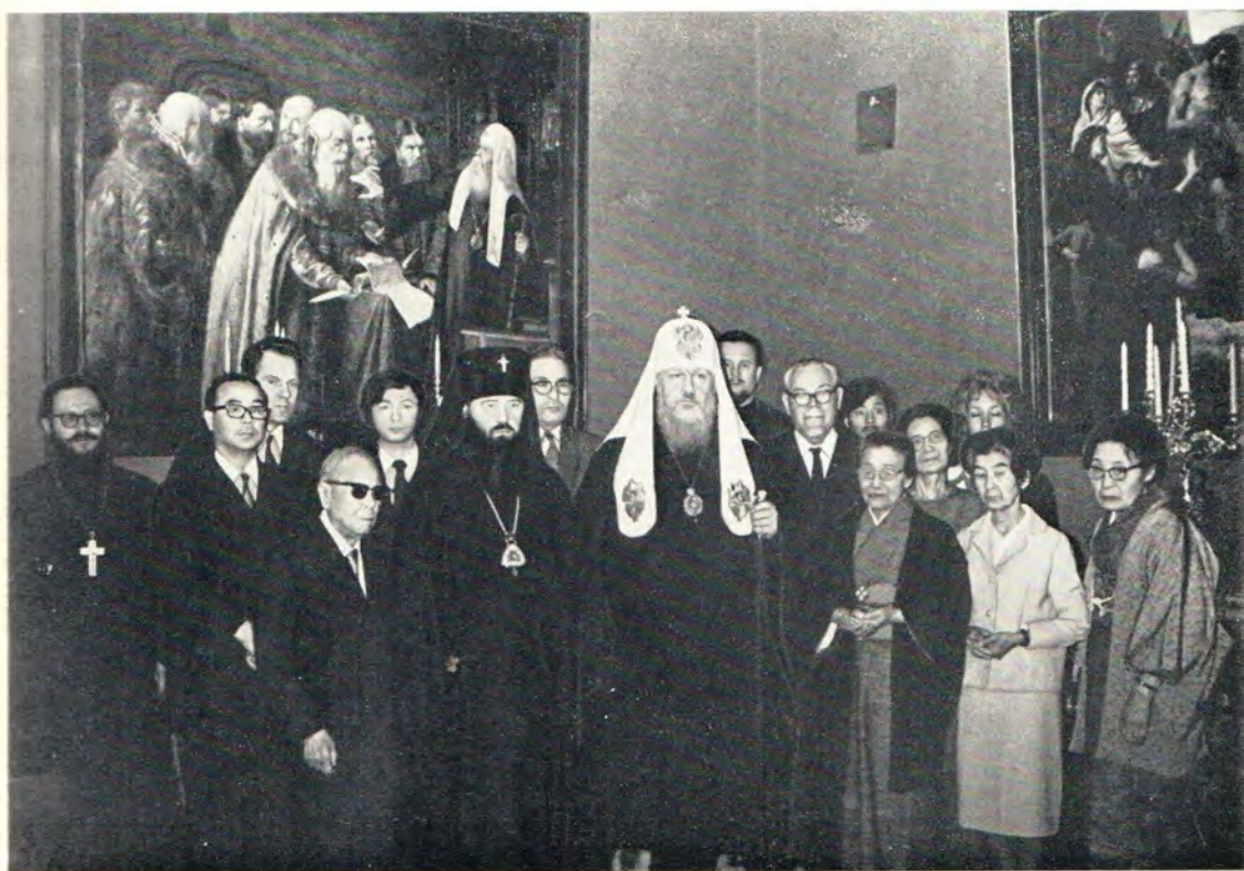
Паломники из Японии — прихожане Патриаршего подворья в Токио — на приеме у Святейшего Патриарха Московского и всея Руси Пимена 20 апреля 1972 года