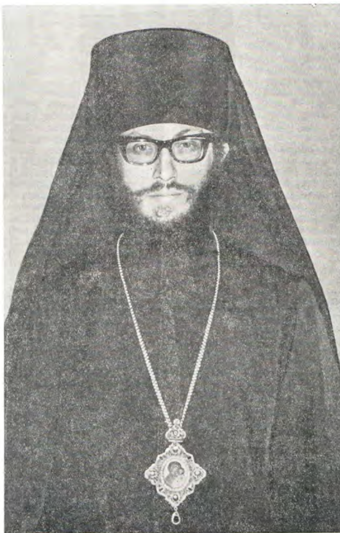
Преподобный СЕРАФИМ, епископ Сендайский

Архиепископ Минский Антоний в своем слове от имени Русской Православной Церкви и от её Священного Синода поздравил Япон-