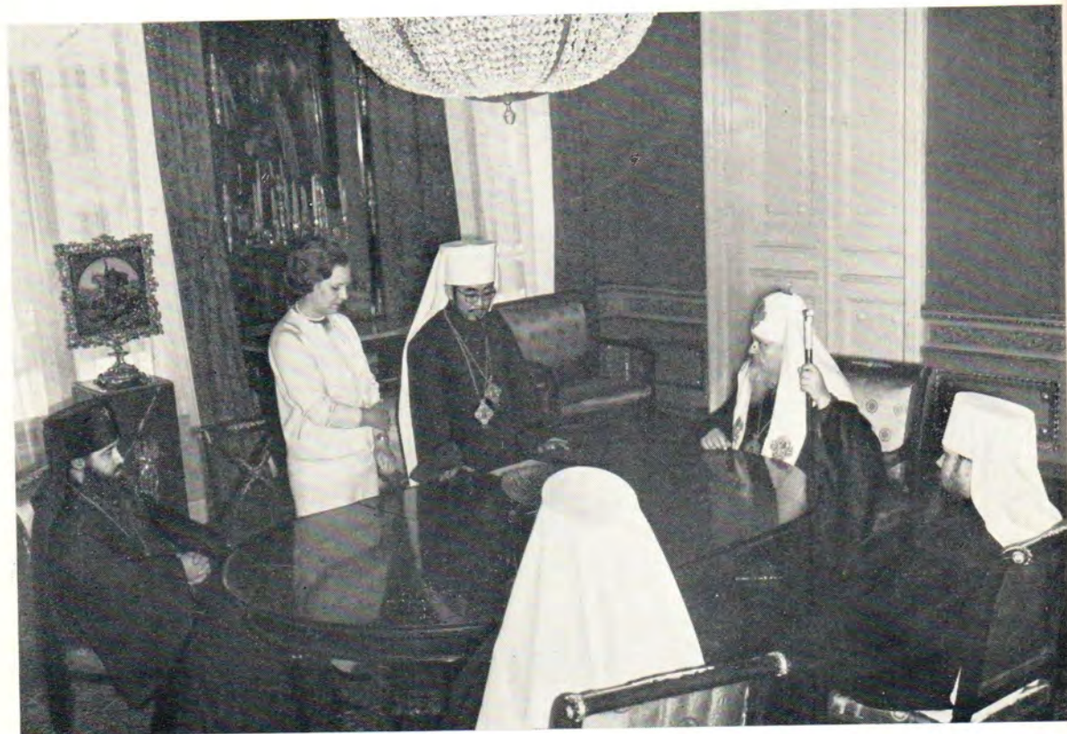
Предстоятель Японской Автономной Церкви Архиепископ Токийский, Митрополит всей Японии Феодосий на приеме у Святейшего Патриарха Московского и всея Руси Пимена. К статье на с. 29