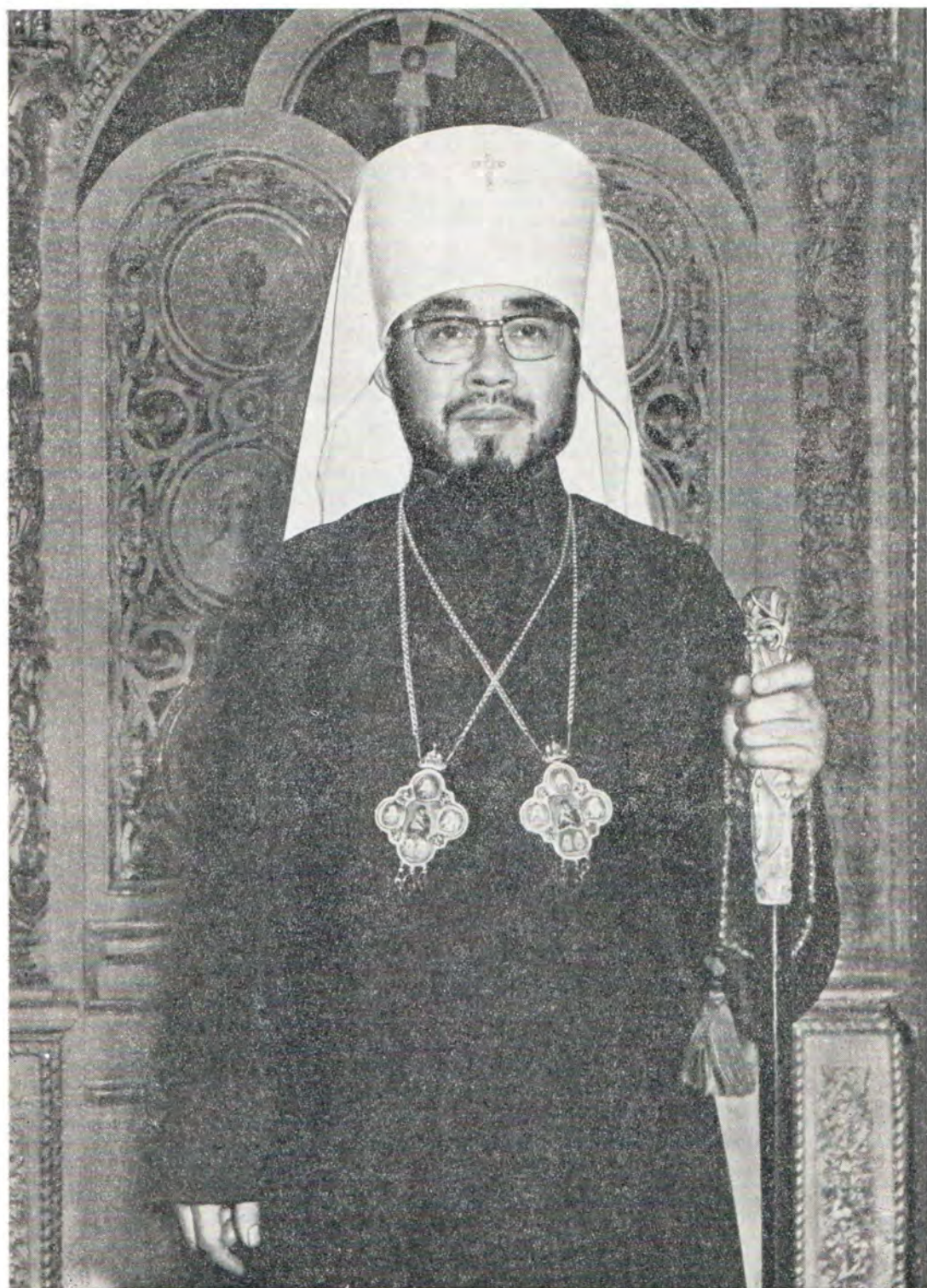
Высокопреосвященный ФЕОДОСИЙ, Архиепископ Токийский, Митрополит всей Японии