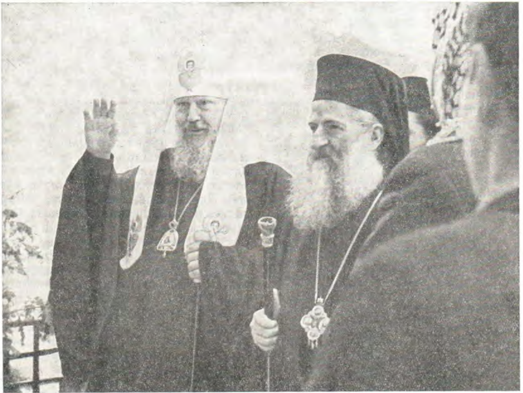
Дамаск. Святейший Патриарх Московский и Всея Руси ПИМЕН и Блаженнейший Патриарх Антиохийский и всего Востока ИЛИЯ IV

Несомненно, настоящая поездка Святейшего Патриарха Пимена и сопровождавших его церковных деятелей будет служить дальнейшему укреплению дружеских отношений между Русской Православной Церковью и этими Церквями, упрочению единства Православия, усилению православного вклада в экуменическое движение и в служение благу человечества.