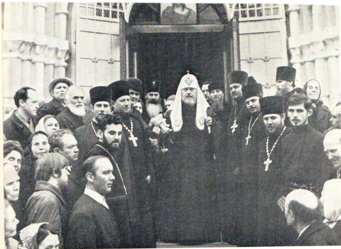
Святейший Патриарх Московский и всея Руси Пимен после службы в праздник Иверской иконы Божией Матери (11 апреля 1972 года) с клириками и прихожанами Воскресенского храма в Сокольниках