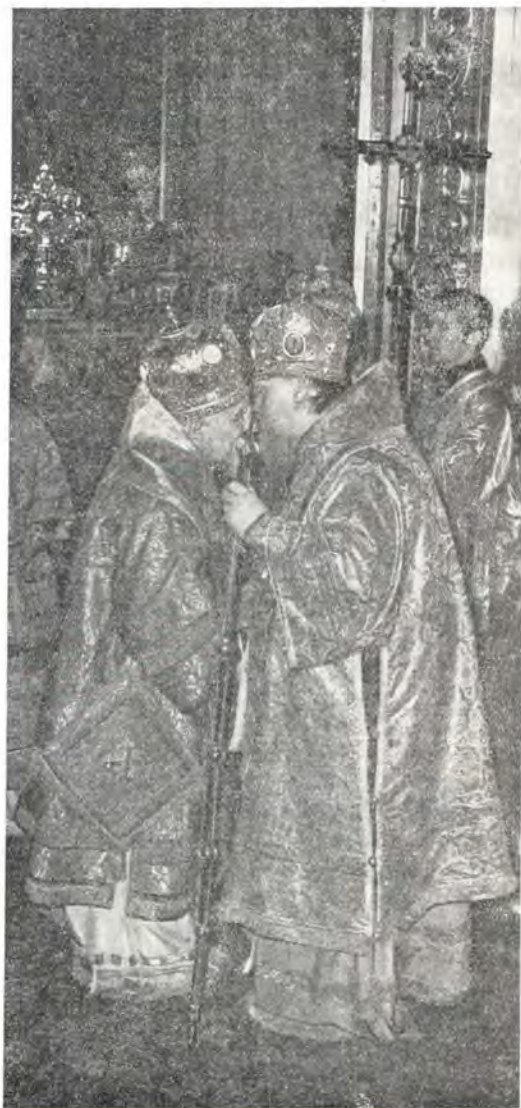
Святейший Патриарх Пимен приветствует Святейшего Патриарха Максима после богослужения в Богоявленском патриаршем соборе 19 марта 1972 года

В 14 часов того же дня Святейший Патриарх Болгарский Максим с делегацией прибыл в московскую резиденцию председателя Отдела внешних церковных сношений Московского Патриархата митрополита Ленинградского и Новгородского Никодима. Здесь состоялась встреча болгарской делегации со Святейшим Патриархом Пименом и группой деятелей Русской Православной Церкви, во время которой произошел обмен мнениями по насущным вопросам церковной жизни и деятельности, результаты которого получили отражение в позднее принятом Предстоятелями Болгарской и