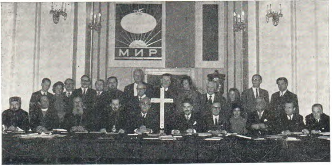
Члены Президиума и Финансового комитета КЕЦ во время заседания Президиума в Троице-Сергиевой Лавре

ческой жизни; важность и цели стремления к безопасности в Европе.