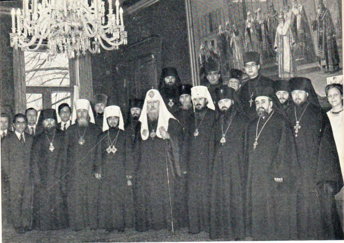
Святейший Патриарх Московский и всея Руси Пимен, Архиепископ Токийский, Митрополит всей Японии Феодосий с клириками и мирянами Русской и Японской Церкви. К статье на с. 29