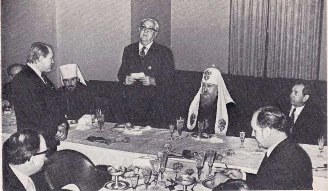
Прием, устроенный Святейшим Патриархом Московским и всея Руси Пименом в честь участников заседания Президиума Конференции Европейских Церквей 21 апреля 1972 г. Выступает пастор д-р Эрнст Вильм, президент КЕЦ