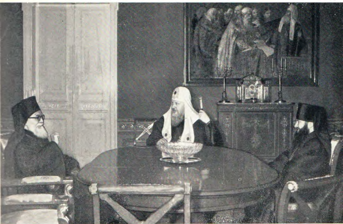
Прощальный визит митрополита Ловчанского Григория, бывшего настоятеля Болгарского подворья в Москве, Святейшему Патриарху Московскому и всея Руси Пимену