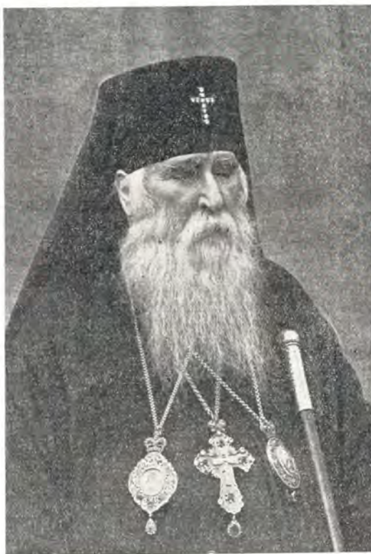
Местоблюститель Грузинского Патриаршего престола Митрополит Урбниский ДАВИД

26 февраля 1926 года рукоположен во диакона, а 27 февраля того же года — во священника. В 1956 году принял монашество. В праздник Успения Божией Матери в том же году была совершена его хиротония во епископа.