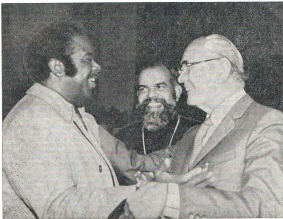
На IV Всехристианском Мирном Конгрессе. Слева направо: пастор д-р Ральф Абернети (США), принципал священник Поль Вергезе (Индия), пастор д-р Мартин Нимёллер (ФРГ)

И так как угнетение и теперь еще существует, то существует и борьба. Поэтому мы