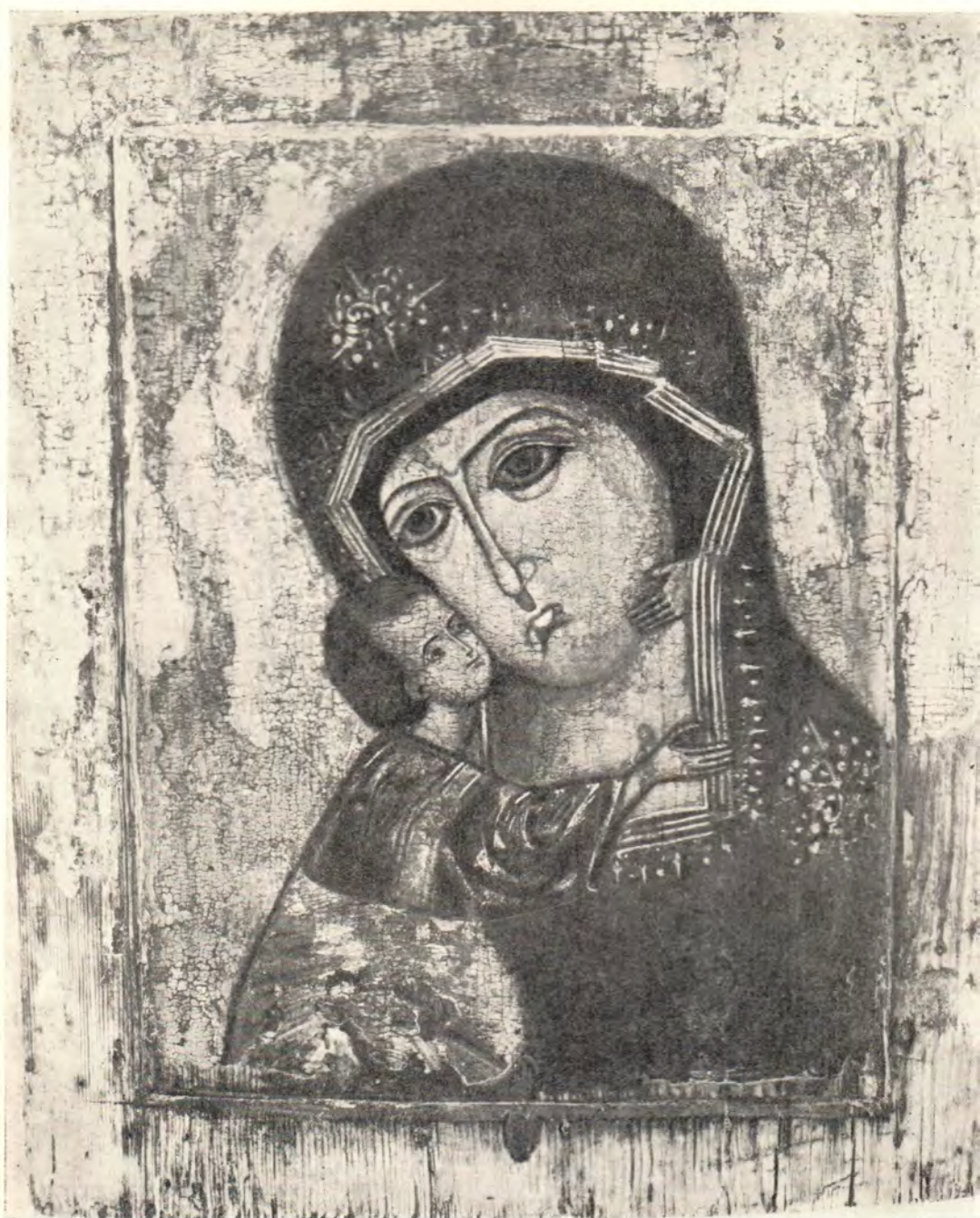
Владимирская икона Божией Матери из собрания Церковно-археологического кабинета Московской духовной академии