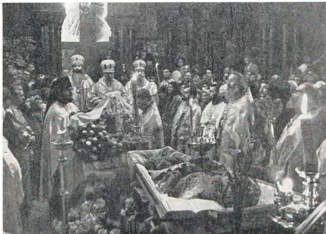
13 апреля 1972 г. Отпевание Католикоса-Патриарха Ефрема. Митрополит Киевский Филарет оглашает соболезнование Патриарха Московского и всея Руси Пимена

Со свойственными ему любовью и воодушевлением Патриарх Ефрем трудился в деле укрепления контактов Грузинской Православной Церкви с Поместными Православными Церквями и в развитии участия его Церкви в экуменическом движении. Лично и через своих представителей он неизменно вносил дух братства и сотрудничества в общение с Предстоятелями Поместных Православных Церквей, отстаивая в то же время законные права Грузинской Автокефальной Церкви на исторически принадлежащее ей место в диптихе Восточных Церквей. В 1962 году на Парижской сессии Центрального комитета ВСЦ Грузинская Церковь была принята в члены этой христианской организации. С тех пор ее представители многократно свидетельствовали на различных международных собраниях ВСЦ в сотрудничестве с другими Поместными Православными Церквями древнюю православную традицию своей Церкви, ее взгляды на теорию и практику экуменического движения.