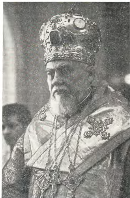
Святейший Патриарх Болгарский Максим

На следующий день, 15 марта, Святейший Патриарх Максим с делегацией прибыл в Воскресенский храм в Сокольниках поклониться чтимой московской святыне — Иверской иконе Божией Матери. Высокого гостя встретил настоятель храма протоиерей Павел Соколовский. Он приветствовал Святейшего Патриарха Максима словом. Причт Воскресенского храма отслужил молебен перед иконой Благой Вратницы, были возжжены многолетия Предстоятелям Болгарской и Русской Церквей. Присутствовавшим в храме богомольцам Святейший Патриарх Максим преподал благосло-