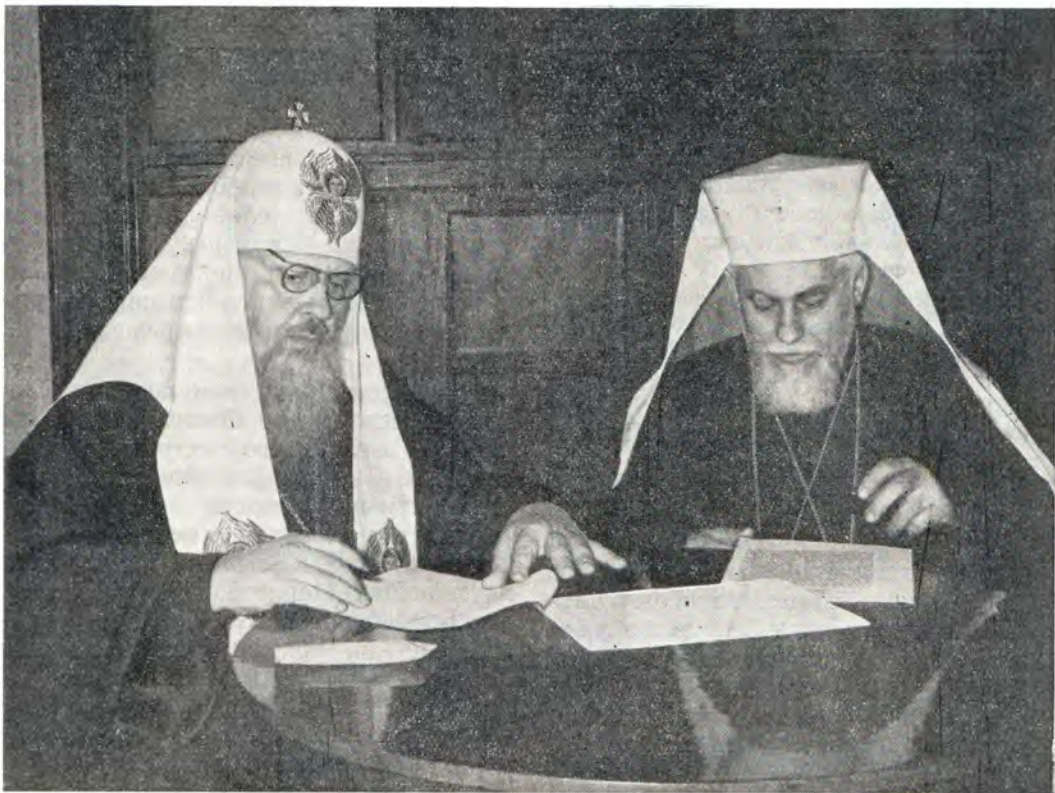
Святейший Патриарх Пимен и Святейший Патриарх Максим во время подписания Коммюнике о пребывании Патриарха Болгарского Максима в нашей стране

котором присутствовал Патриарх Болгарский Максим с делегацией. Ректор архиепископ Филарет прочитал утвержденное Святейшим Патриархом Пименом постановление Совета академии об избрании Предстоятеля Болгарской Церкви Святейшего Патриарха Максима почетным членом Московской духовной академии и вручил Его Святейшеству диплом почетного члена. Выступая с словом приветствия и благодарности, Святейший Патриарх Максим особенно подчеркнул следующее: «Ваша духовная школа дорога нам не только потому, что она вносит большой вклад в богословскую науку и готовит достойные кадры для Святой Православной Церкви, но еще и потому, что в ее стенах получили образование и воспитание многие учившиеся в ней молодые болгары, ставшие впоследствии видными иерархами, деятелями просвещения и администраторами нашей Святой Православной Церкви. И теперь здесь занимаются наши молодые клирики и миряне, на которых мы возлагаем добрые надежды». Завершилось торжественное собрание духовным концертом. Хор учащихся академии и семинарии под руководством преподавателя пения М. Х. Трофимчука (среди певцов хора находились и профессорские стипендиаты из Болгарии) исполнил песнопения болгарского распева и церковные произведения русских композиторов.