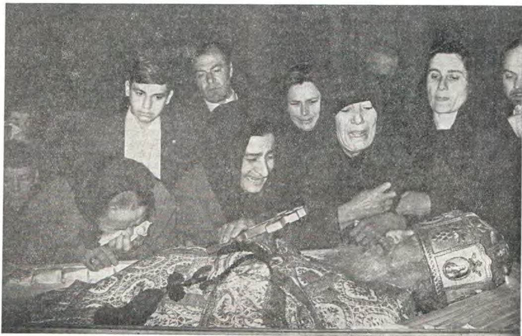
Прощание с Католикосом-Патриархом Ефремом в Сионском кафедральном соборе

Особую страницу биографии почившего Католикоса Ефрема II составляет его отношение к Святейшему Патриарху Московскому и всея Руси Алексию и к Русской Православной Церкви. «Мой отец, ты ведаешь, что я был связан с тобой искренней и сильной любовью», — говорил он сквозь неудержимые слезы над гробом Патриарха Московского в день его погребения 21 апреля 1970 года. Эти слова были не просто данью почтения к старшему собрату. Вспомним, что первое совместное служение с двумя Патриархами — Московским Алексием и Грузинским Каллистратом митрополит Кутаисский Ефрем совершил 14 октября 1945 года. Невозможно переоценить значение того года в послевоенной истории взаимоотношений Автокефальных Православных Церквей, и в частности Грузинской и Русской. 31 октября 1943 года, после почти четвертьвекового разрыва, было восстановлено их каноническое общение совместными служениями в Тбилиси иерархов обеих Церквей («ЖМП», 1944, № 3). Церковное разделение православных верующих грузин и русских, живущих издавна общими интересами в Грузин-