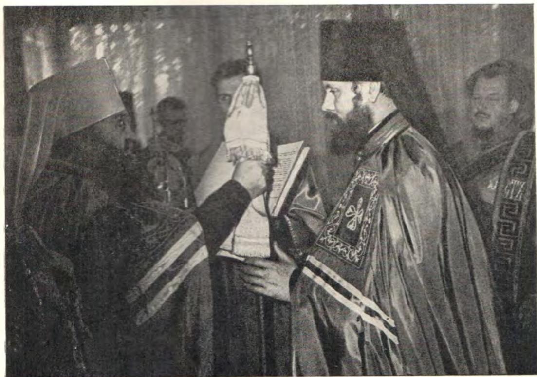
Митрополит Никодим вручает архиерейский жезл епископу Зарайскому Хризостому