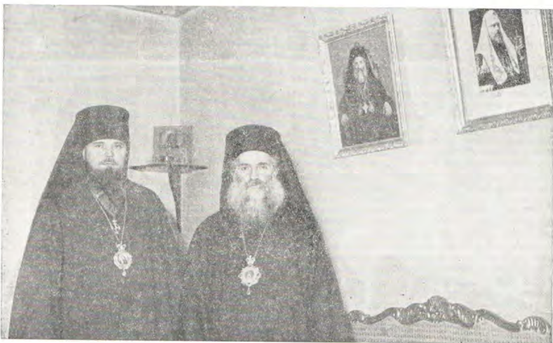
Блаженнейший Патриарх Антиохийский и всего Востока Илия IV и епископ Виленский и Литовский Гермоген в помещении Представительства 9 марта 1972 года