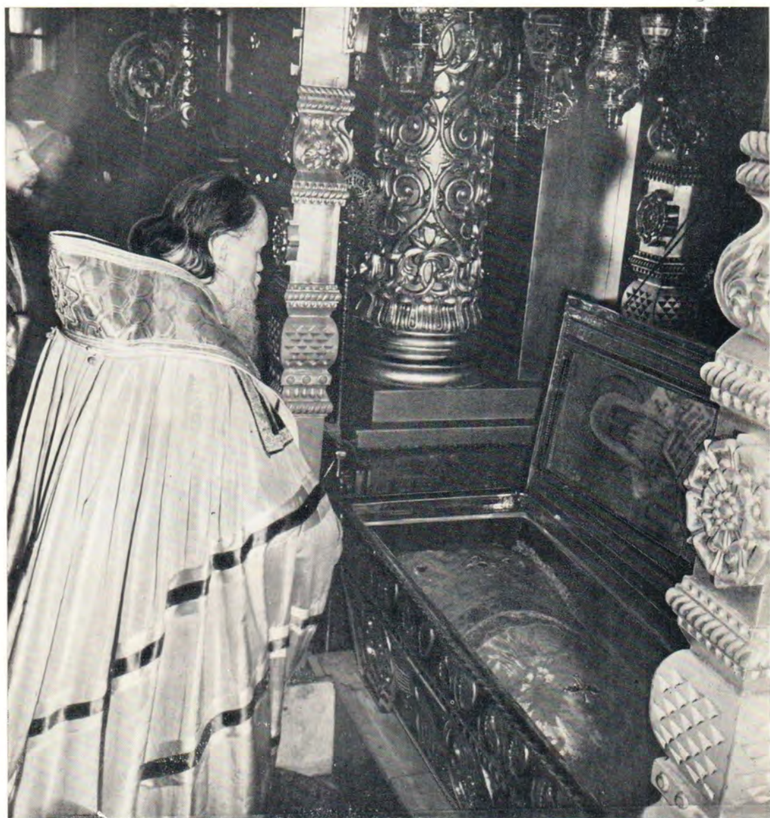
Праздник святителей Петра, Алексея, Ионы, Филиппа и Ермогена Московских и всея России, чудотворцев, 18 октября 1971 года. Святейший Патриарх Московский и всея Руси Пимен по окончании Божественной литургии в Богоявленском патриаршем соборе совершает поклонение мощам святителя Московского Алексея