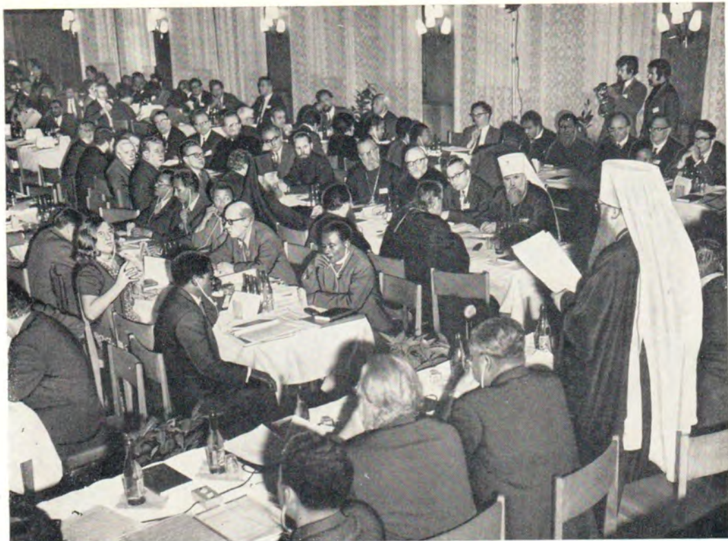
В зале заседаний IV Всехристианского Мирного Конгресса. Выступает митрополит Ленинградский и Новгородский Никодим