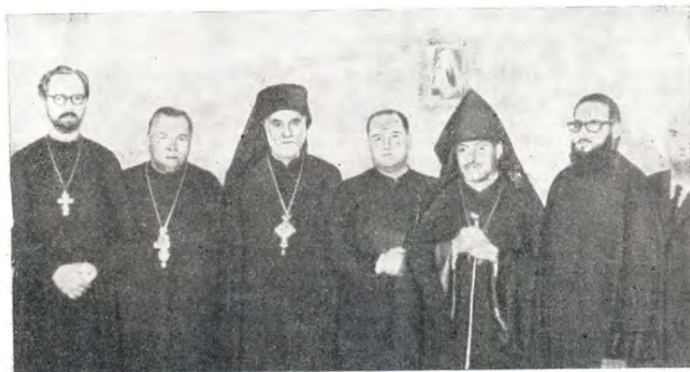
25 июля 1971 года. Группа участников благодарственного молебна в Благовещенском соборе в Буэнос-Айресе