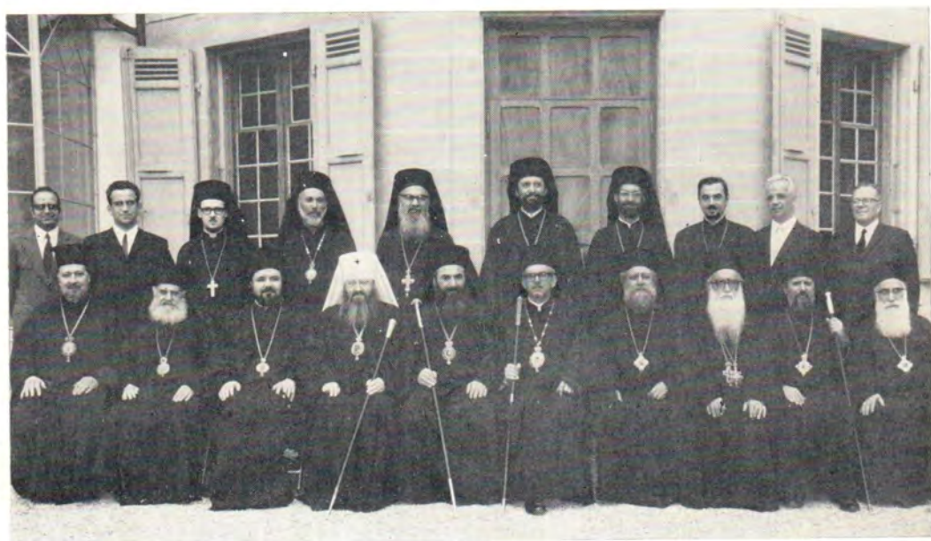
Участники заседания Межправославной комиссии по подготовке Всеправославного Собора, 15—28 июля 1971 года, Шамбези (Швейцария). В первом ряду (слева направо): епископ Хельсинкский Иоанн (Финляндская Церковь), митрополит Пафский Геннадий (Кипрская Церковь), епископ Плоештинский Антоний (Румынская Церковь), митрополит Ленинградский и Новгородский Никодим, митрополит Аксумский Мефодий (Александрийская Церковь), митрополит Мир Ликийских Хризостом (Константинопольская Церковь), архиепископ Севастийский Герман (Иерусалимская Церковь), епископ Жичский Василий (Сербская Церковь), митрополит Старозагорский Панкратий (Болгарская Церковь), митрополит Митилинский Паков (Элладская Церковь)