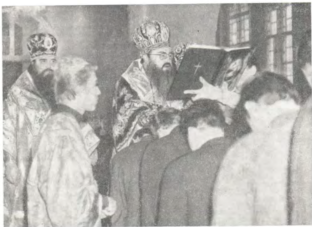
Митрополит Ленинградский и Новгородский Никодим совершает поставление во тщеа учащихся Ленинградской духовной семинарии