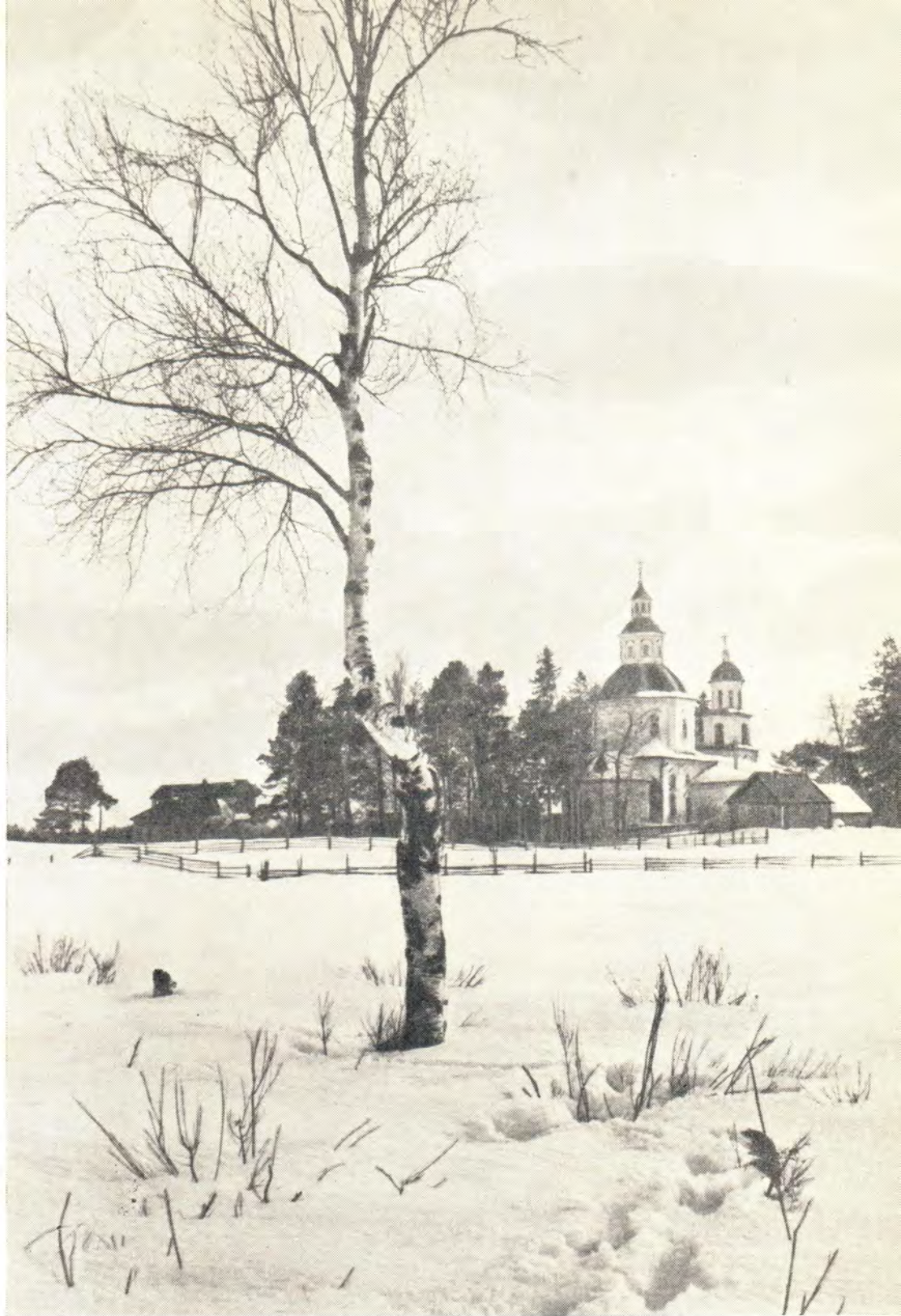
Храм в честь Казанской иконы Божией Матери в с. Верхние Котцы, Калининской епархии