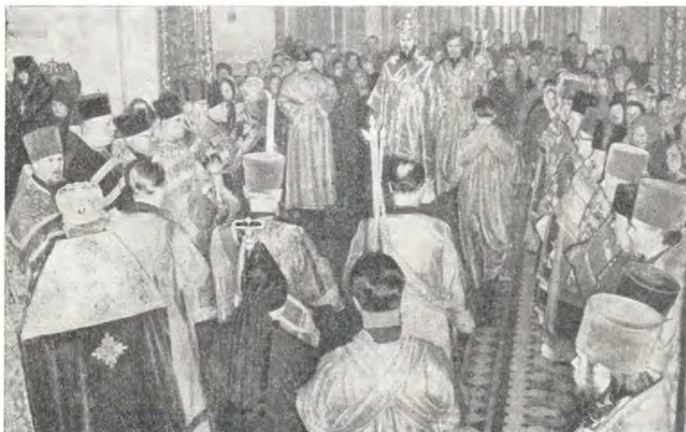
Митрополит Алексей за литургией в Пюхтицком монастыре 20 апреля 1971 года

20 апреля, во вторник Светлой седмицы, митрополит Алексей в сослужении клириков епархии, принимавших участие в собрании клира и мирян, избравшем членов Поместного Собора от Таллинской епархии, совершил Божественную литургию в Успенском соборе монастыря и пасхальный крестный ход вокруг собора. Большинство священнослужителей — благочинные епархии и некоторые настоятели приходов — эстонцы. Литургия совершалась на церковнославянском и эстонском языках. После литургии была общая с насельницами монастыря трапеза, а вечером состоялось собрание клира и мирян, на котором митрополит Алексей сделал доклад о значении Соборов в жизни Церкви и предстоящего Поместного Собора Русской Православной Церкви 1971 года. Членами Поместного Собора от Таллинской епархии были избраны настоятель таллинского Преображенского собора и секретарь митрополита Таллинского протоиерей Николай Кокла и мирянин А. В. Краюшкин.