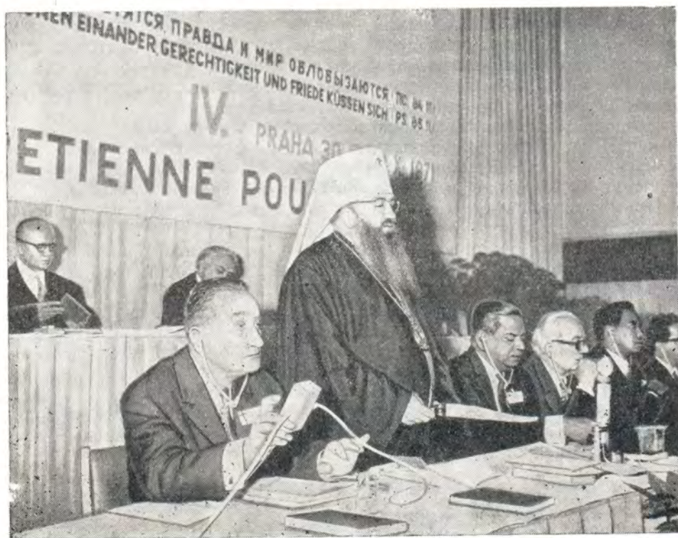
Президент ХМК митрополит Ленинградский и Новгородский Никодим в президиуме IV Всехристианского Мирного Конгресса

Архиепископ Ярославский и Ростовский Никодим возглавлял делегацию Русской Православной Церкви на I Всехристианском Мирном Конгрессе, имевшем место в Праге 13—18 июня 1961 года. На этом Конгрессе была учреждена Христианская Мирная Конференция и архиепископ Никодим был избран в состав её Совещательного комитета по продолжению работы и Рабочего комитета. Архиепископ Никодим был также избран вице-президентом ХМК и переизбирался на этот пост до IV Всехристианского Мирного Конгресса, являясь с февраля 1970 года председателем коллегии вице-президентов ХМК. С 1962 по 1964 год митрополит Никодим был председателем комиссии ХМК «Мир и экумена».