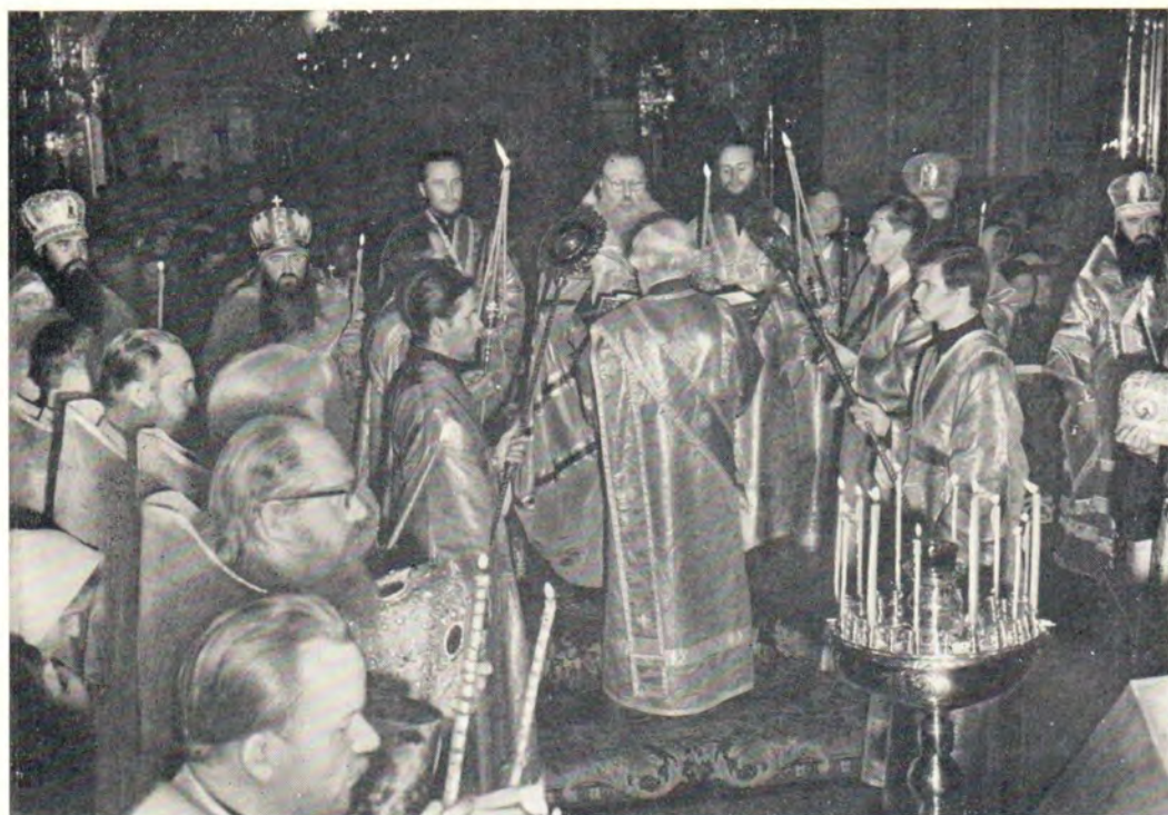
18 октября 1971 года, праздник Московских святителей. Святейший Патриарх Пимен читает Евангелие за всеобщим бдением накануне праздника в Богоявленском патриаршем соборе