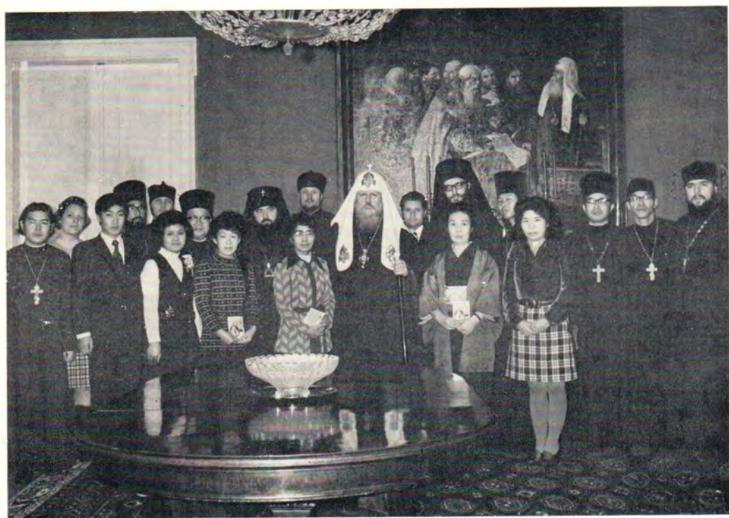
Группа паломников — священнослужители и миряне — Автономной Православной Церкви Японии на приеме у Святейшего Патриарха Московского и всея Руси Пимена 20 октября 1971 года