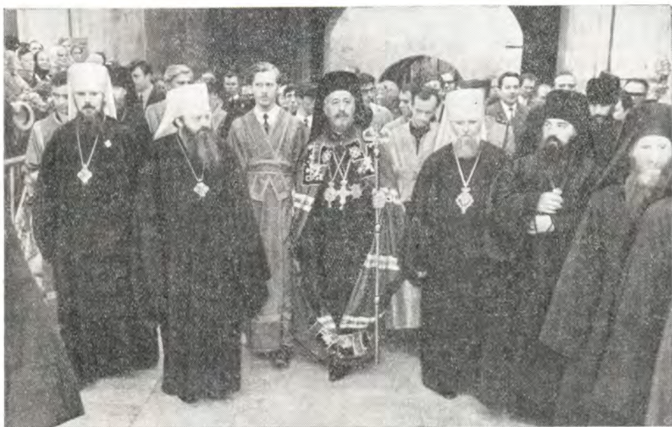
День Святой Троицы, 6 июня 1971 года. Торжественная встреча Архиепископа Кипрского Макария в Троице-Сергиевой Лавре

«Сам же Бог и Отец наш, и Господь наш Иисус Христос да управит путь наш к вам. А вас Господь да исполнит и преисполнит любовью друг к другу и ко всем, какою мы исполнены к вам» (1 Фес. 3, 11—12). Аминь.