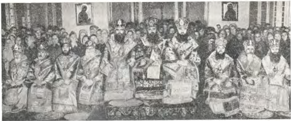
За Божественной литургией в храме Ленинградских духовных академии и семинарии в день памяти святого апостола и евангелиста Иоанна Богослова 9 октября 1971 года