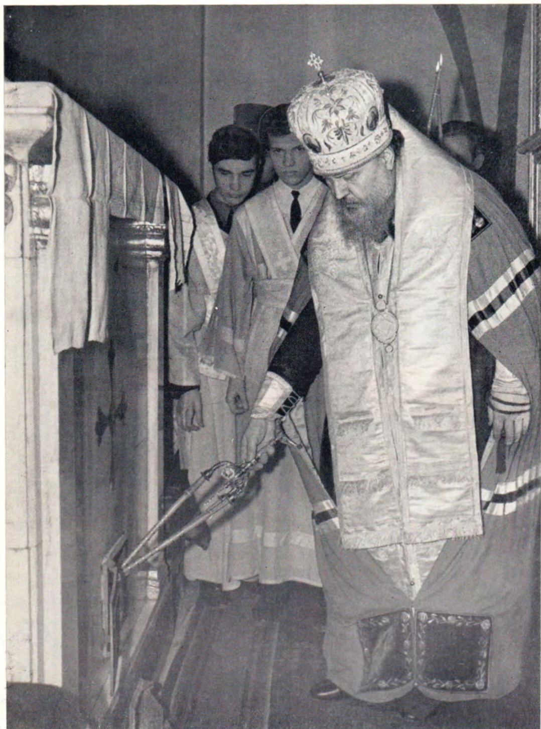
В Великий понедельник 12 апреля 1971 года в храме в честь Донской иконы Божией Матери в б. Донском монастыре в Москве был начат чин мироварения. На фото: Патриарший Местоблюститель Митрополит Крутицкий и Коломенский Пимен огнем от тригиря возжигает печь для мироварения