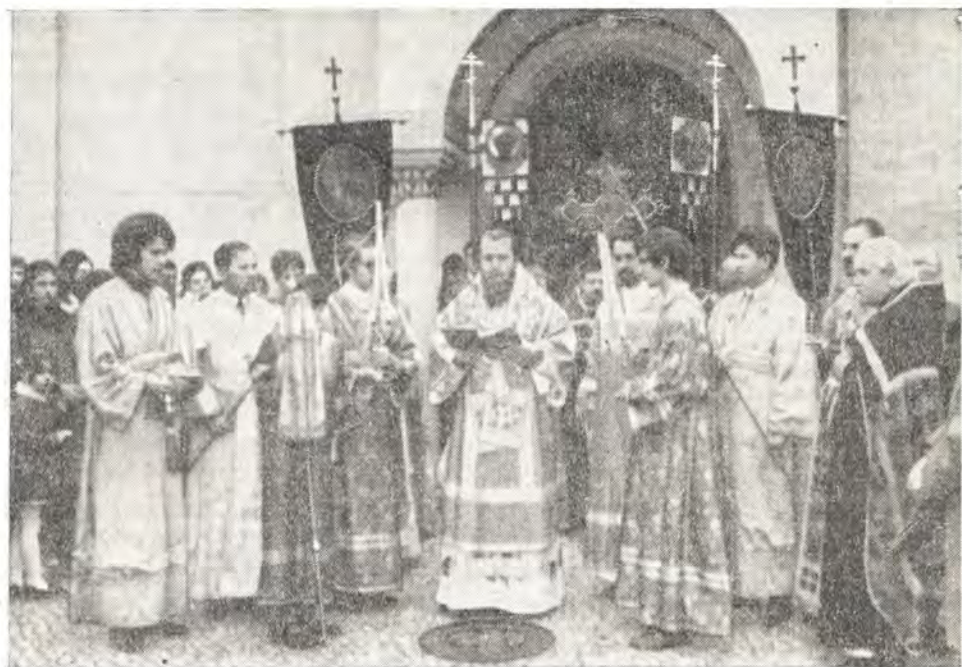
25 апреля 1971 года. Архиепископ Леонтий читает Евангелие на крестном ходе вокруг Воскресенского собора в Западном Берлине

Задолго до Святой Пасхи тишину собора часто нарушали телефонные звонки: «когда будет праздноваться русская Пасха?» Звонили из Берлина и из других городов. Рассеянные повсюду православные спрашивали с времени пасхальных богослужений, чтобы в эту ночь приехать помолиться в собор.