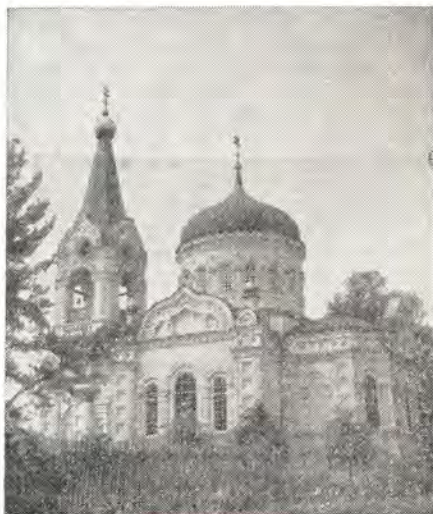
Храм Святой Троицы в с. Троицком на Истре

Внутренний вид храма был ужасен, но и поразительно было видеть, что среди щебня и штукатурки на аналое посредине церкви лежал по-прежнему образ Скорбящей Божией Матери. Взрывной волной была снесена с перегородки верхних хоров алтарная икона Божией Матери, принесенная из истринского Воскресенского собора. Она стояла прислоненная к стене. Икона Спасителя, находившаяся рядом с ней, осталась там же, на хорах. В щель был разнесен дубовый киот образа Святителя Николая, но лишь одна сквозная пробойна была на самой иконе, над мечом, который держит Святитель в правой руке, защищая церковь, стоящую на его левой руке. Образ найден был здесь же