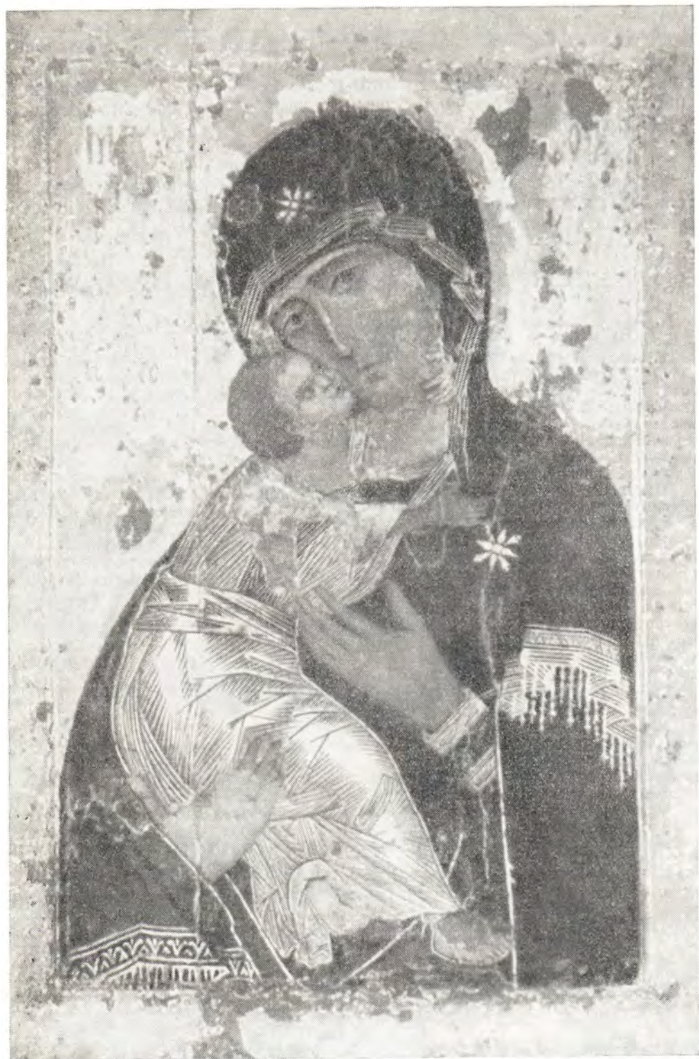
Владимирская икона Божией Матери