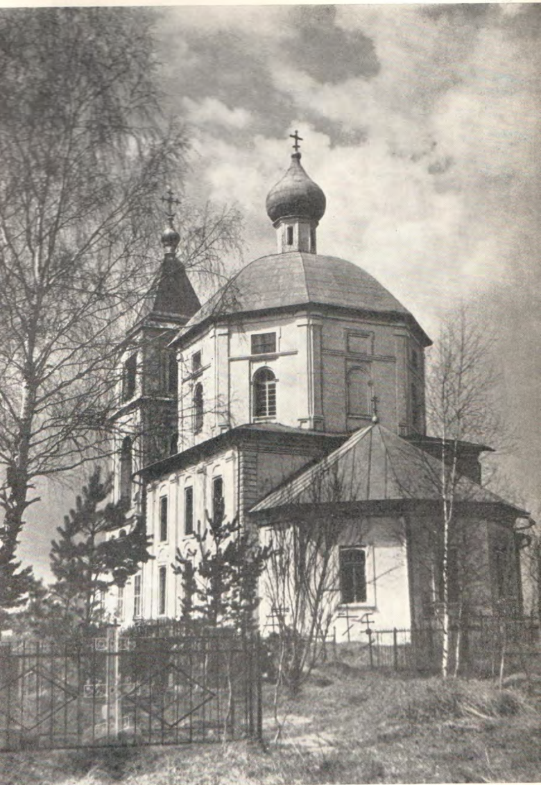
Храм Успения Пресвятой Богородицы. Боголепова пустынь, Московской епархии