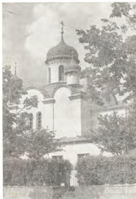
Воскресенский кафедральный собор в Берлине

Московская епархия. День кончины Святейшего Патриарха Сергия. 15 мая 1971 года исполнилось 27 лет со дня кончины Святейшего Патриарха Сергия. Накануне этого дня в Богоявленском патриаршем соборе в Москве, где погребен Патриарх Сергий, был совершен парастас. Патриарший Местоблюститель Митрополит Крутицкий и Коломенский Пимен в этот день был в отъезде: он участвовал в работе Ассамблеи Всемирного Совета Мира, проходившей в Будапеште. По благословению Митрополита Пимена парастас совершал причт собора.