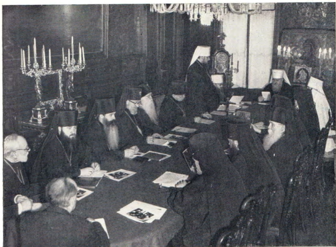
Четвертое заседание Комиссии по организации Поместного Собора