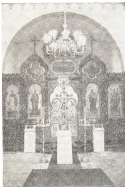
Иконостас Воскресенского собора в Берлине

Берлинская епархия. К празднику Воскресения Христова — Святой Пасхи Православная Церковь готовит своих чад посредством сорокадневного поста с его особыми богослужениями. Как и во всех храмах Русской Православной Церкви, строго хранится установленный издревле устав великопостных служб и в храмах Среднеевропейского Экзархата. Экзарх имеет постоянное местопребывание в столице ГДР — г. Берлине, где находится крестовый храм во имя Преподобного Сергия. Три православных храма Московского Патриархата, в том числе Воскресенский кафедральный собор, расположены в Западном Берлине. Здесь Владыка Экзарх регулярно служит во все воскресные и праздничные дни. Богослужение совершается чинно, истово и торжественно. Паства прихода по своему национальному составу разнообразна. В основном это русские и украинцы, но есть и довольно большое число православных немцев, некоторые из них состоят в клире, поют в церковном хоре, принимают участие в церковноприходской жизни. Приходят в храм помолиться и верующие других национальностей: греки, болгары, сербы, арабы, американцы. Русские люди специально за многие километры приезжают сюда и если бывают проездом в Берлине, то по дороге непременно заходят в собор. И каждый свидетельствует о глубоком духовном удовлетворении от посещения русского православного храма.