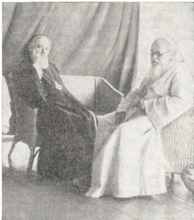
Святейший Патриарх Алексий и архиепископ Симферопольский Лука, 1957 г.