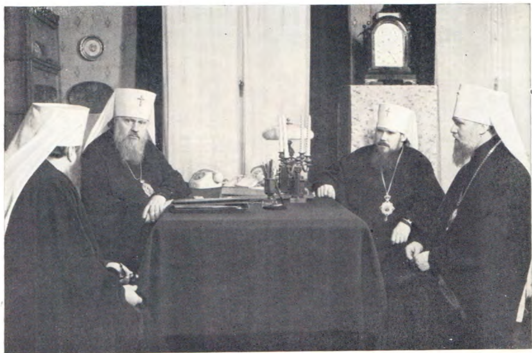
Председатель Комиссии по организации Поместного Собора Местоблюститель Патриаршего престола Митрополит Крутицкий и Коломенский Пимен и его заместители: митрополит Ленинградский и Новгородский Никодим, митрополит Таллинский и Эстонский Алексей и митрополит Киевский и Галицкий, Экзарх Украины, Филарет