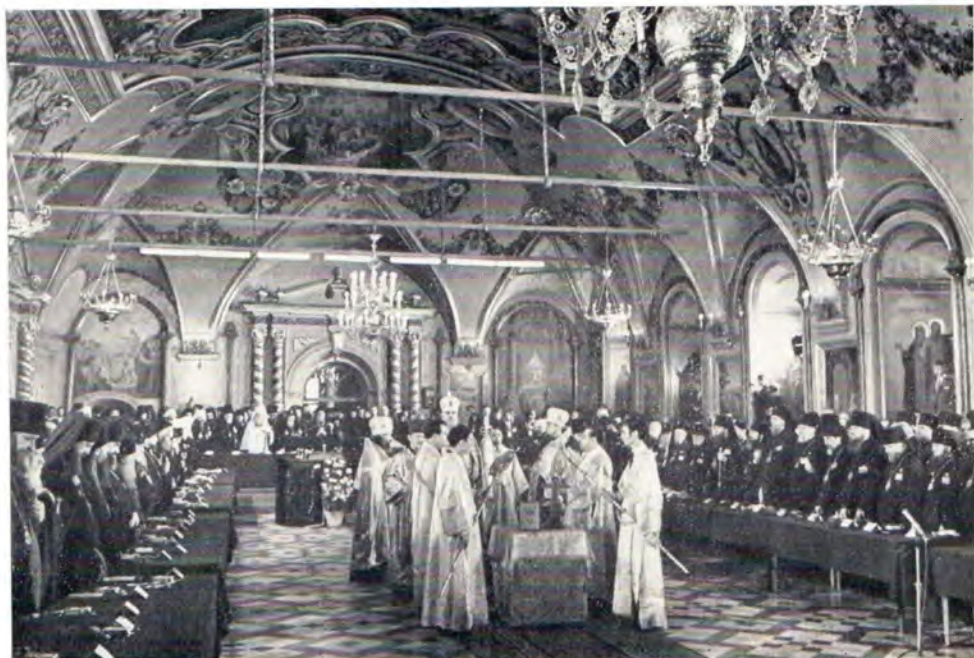
30 мая 1971 года. Торжественный молебен перед открытием Поместного Собора

На заседаниях Поместного Собора и на интронизации новоизбранного Патриарха присутствовали многочисленные гости — Главы и представители Поместных Автокефальных и Автономных Православных Церквей, инославных Церквей и христианских объединений.