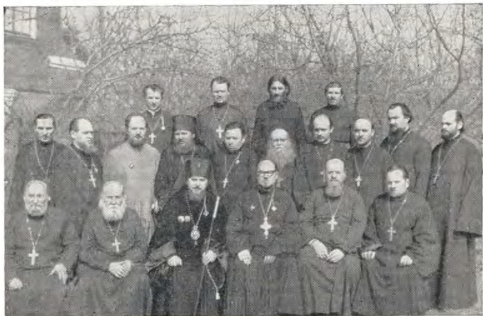
Архиепископ Никодим с харьковским духовенством в праздник Святой Пасхи 18 апреля 1971 года

После молебна состоялось торжественное чествование юбилера. С приветствен-