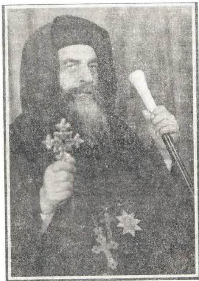
Патриарх Коптской Церкви Кирилл VI

9 марта 1971 года в патриаршей резиденции в Каире в Бозе почил Глава Коптской Церкви Святейший Патриарх Кирилл VI, Папа Александрийский. Смерть последовала на 69-м году жизни в результате острого сердечного приступа.