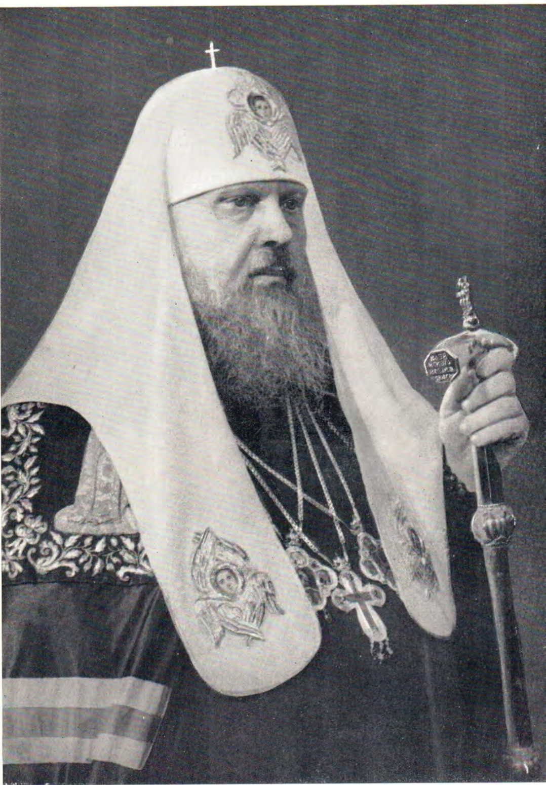
Святейший Патриарх Московский и всея Руси ПИМЕН