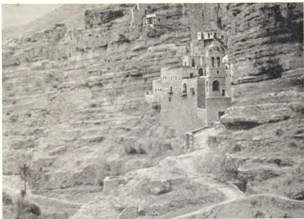
МОНАСТЫРЬ СВ. ГЕОРГИЯ ХОЗЕВИТА В ОКРЕСТНОСТЯХ ИЕРУСАЛИМА

суетливости, приняли, показали храм и пещеру, в которой сложено несколько сотен черепов убитых персами монахов. В период расцвета палестинского монашества здесь подвизалось до тысячи иноков. В отвесных рыжеватых скалах чернеют пустующие теперь пещеры. Запомнилась какая-то особая тишина в этом суровом, выжженном солнцем ущелье и, как контрасты, такой необычный здесь и громкий звон церковных колоколов и неожиданная зелень пальмы у каменного моста через сухое русло потока.