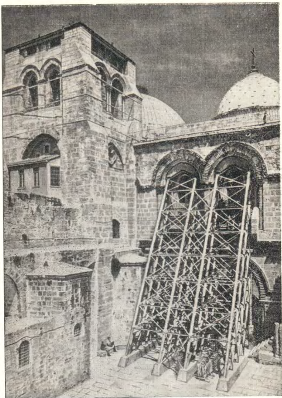
ХРАМ ВОСКРЕСЕНИЯ В ИЕРУСАЛИМЕ