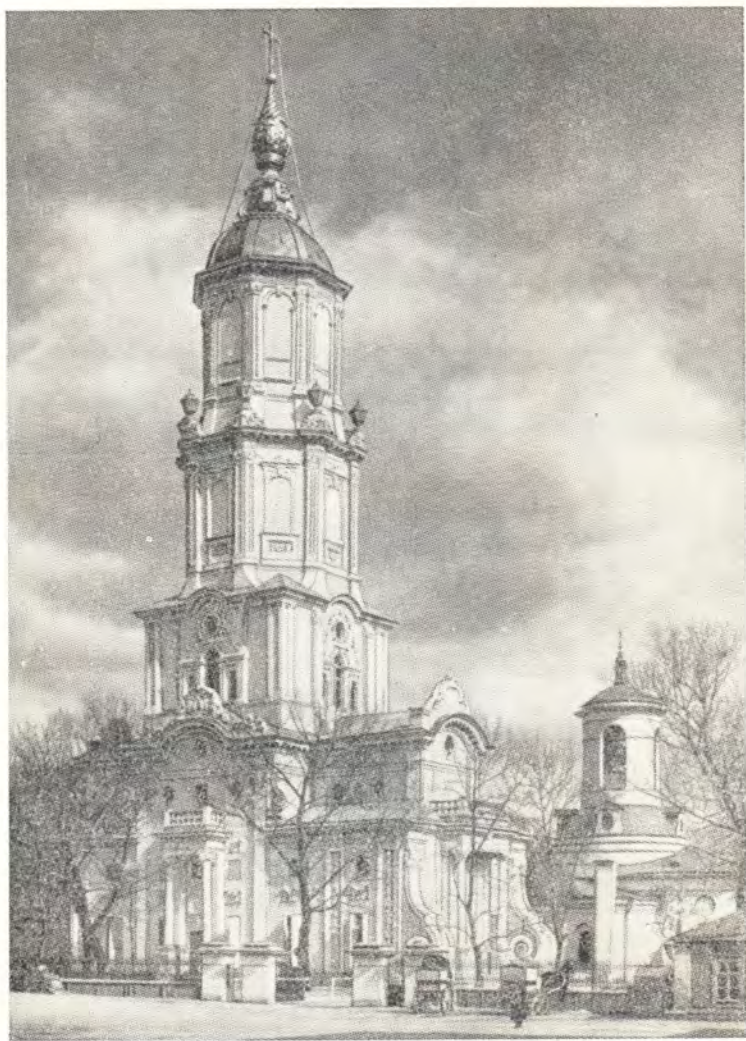
ХРАМЫ АНТИОХИЙСКОГО ПОДВОРЬЯ В МОСКВЕ — ВО ИМЯ АРХАНГЕЛА ГАВРИИЛА (слева) И СВ. ФЕОДОРА СТРАТИЛАТА

Подворье было возобновлено в июле 1948 г. на новом месте.