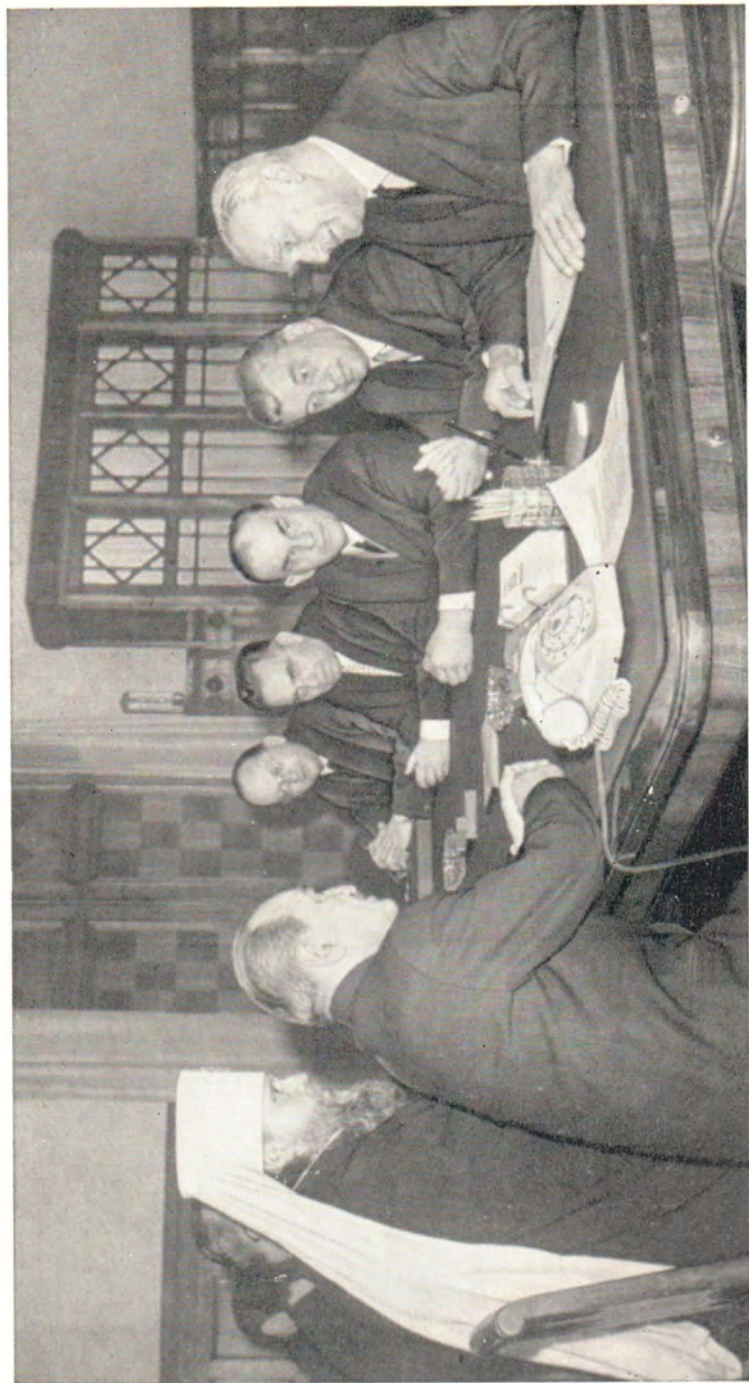
ПРЕДСЕДАТЕЛЬ ПРЕЗИДИУМА ВЕРХОВНОГО СОВЕТА СССР А. И. МИКОЯН ПРИНЯЛ 15 января 1965 года В КРЕМЛЕ ДЕЛЕГАЦИЮ ХМК ВО ГЛАВЕ С ЕЕ ПРЕДСЕДЕТЕЛЕМ д-ром И. ГРОМАДКОЙ, ВРУЧИВШЮ ОБРАЩЕНИЕ II ВСЕХРИСТИАНСКОГО МИРНОГО КОНГРЕССА