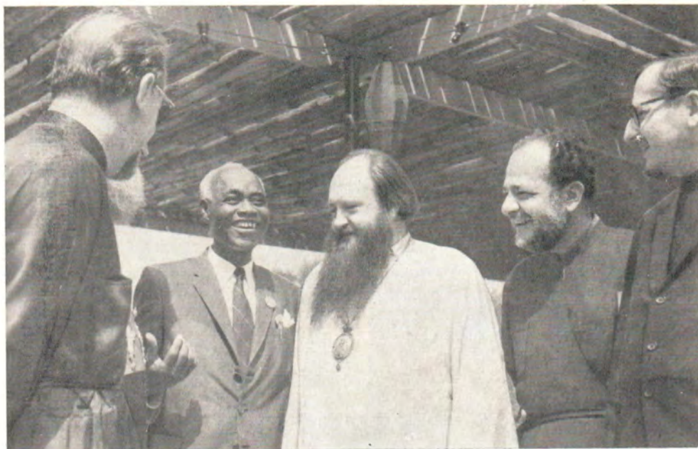
ГРУППА УЧАСТНИКОВ СЕССИИ ЦЕНТРАЛЬНОГО КОМИТЕТА ВСЦ В ЭНУГУ. Слева направо: митрополит Илиопольский и Тирский Мелитон (Турция), сэр Френсис Ибиам (Нигерия), митрополит Ленинградский и Ладожский Никодим (СССР), митрополит Карфагенский Парфений (Ливия), протоиерей В. М. Боровой (СССР)