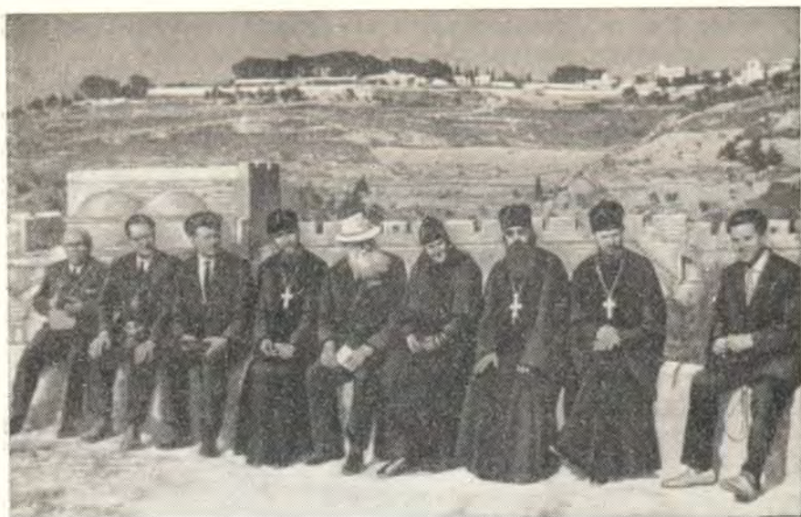
ПАЛОМНИКИ В ОГРАДЕ МЕЧЕТИ, ГДЕ НЕКОГДА СТОЯЛ ХРАМ ИЕРУСАЛИМСКИЙ

описаны проф. Н. Д. Успенским в статье, напечатанной в нашем журнале в 1961 г., в №№ 5, 6 и 7, поэтому не будем повторять уже сказанного.