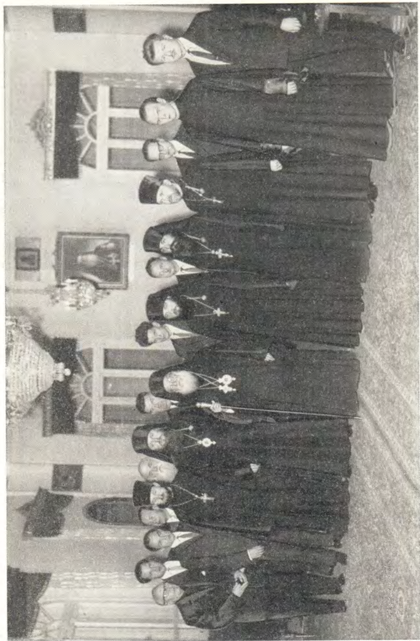
ПАЛОМНИКИ НА ПРИЕМЕ У БЛАЖЕННЕЙШЕГО ФЕОДОСИЯ VI, ПАТРИАРХА АНТИОХИЙСКОГО И ВСЕГО ВОСТОКА. Дамаск. 11 мая 1964 года