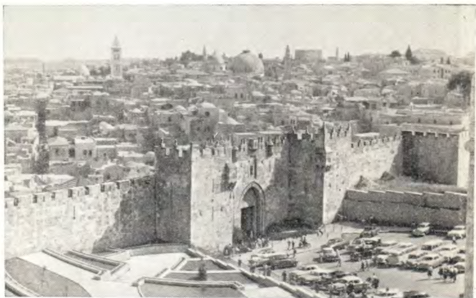
ИЕРУСАЛИМ, СТАРЫЙ ГОРОД. На переднем плане — Дамасские ворота

После пасхальной вечерни мы отправились осматривать достопримечательности Святого Града. Сопровождала нас инокиня Серафима (Путятина), живущая в Иерусалиме много лет и с готовностью согласившаяся быть нашим проводником.