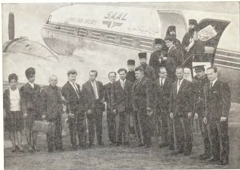
РУССКИЕ ПАЛОМНИКИ НА ИЕРУСАЛИМСКОМ АЭРОДРОМЕ ПЕРЕД ОТЪЕЗДОМ В ДАМАСК 9 мая 1964 года