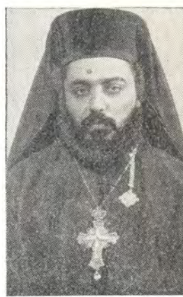
Настоятели Антиохийского подворья в Москве (слева направо): Неофит, митрополит Илипольский и Гор Ливанских (1848—1853); архимандрит Гавриил Шатила (1861—1871); архимандрит Христофор (1879—1887); архимандрит Рафаил Хававини (1889—1900); архимандрит Александр Тахан (1900—1903); архимандрит Игнатий Абурус (1903—1908); архимандрит Антоний Мубайед (1910—1929); архимандрит (ныне митрополит Хауранский) Василий Самаха (1948—1962); архимандрит Алексей Абдель Карим (с 1962 г.)