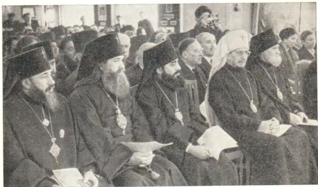
НА ТОРЖЕСТВЕННОМ СОБРАНИИ В АКТОВОМ ЗАЛЕ МОСКОВСКОЙ ДУХОВНОЙ АКАДЕМИИ, ПОСВЯЩЕННОМ 20-летию ПАТРИАРШЕСТВА СВЯТЕЙШЕГО ПАТРИАРХА АЛЕКСИЯ