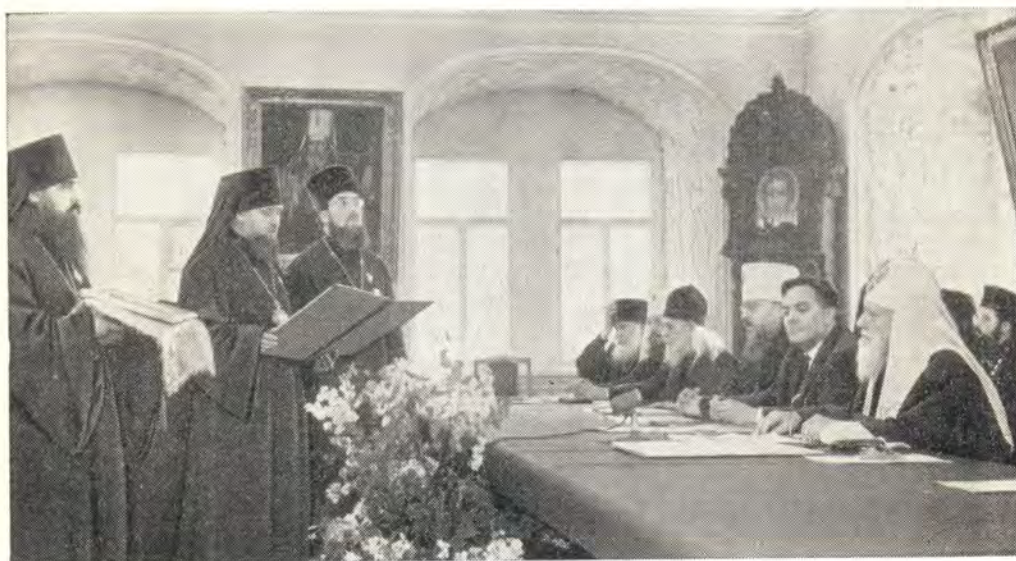
ПРИВЕТСТВЕННЫЙ АДРЕС СЯТЕЙШЕМО ПАТРИАРХУ АЛЕКСИЮ ОТ МОСКОВСКОЙ ДУХОВНОЙ АКАДЕМИИ ЗАЧИТЫВАЕТ ЕЕ РЕКТОР ЕПИСКОП ДМИТРОВСКИЙ ФИЛАРЕТ

На этом официальная часть торжественного акта закончилась. После нее состоялось выступление хора учащихся Московской духовной академии и семинарии под управлением преподавателя церковного