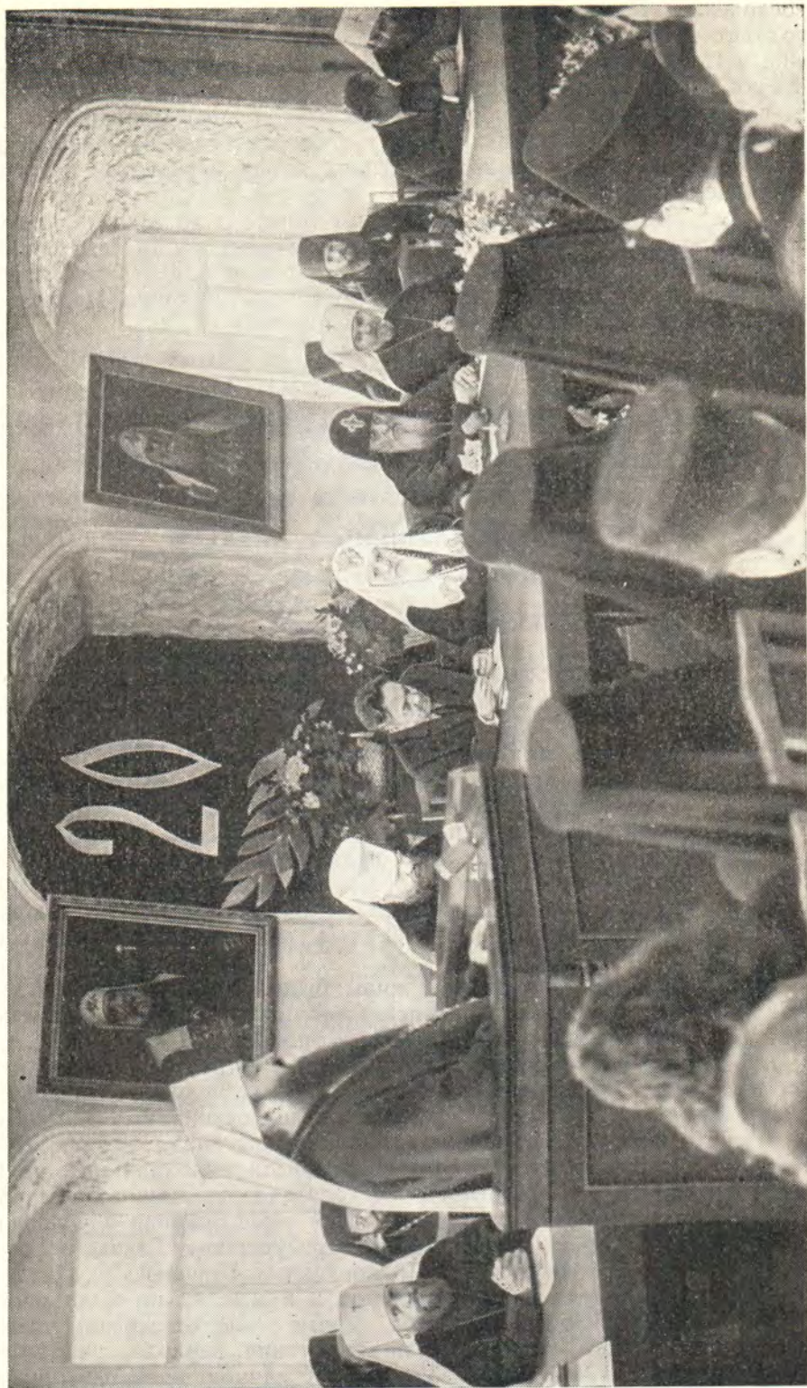
МИТРОПОЛИТ НИКОДИМ ЧИТАЕТ ДОКЛАД О 20-ЛЕТИИ ПАТРИАРШЕСТВА СВЯТЕЙШЕГО ПАТРИАРХА АЛЕКСИЯ