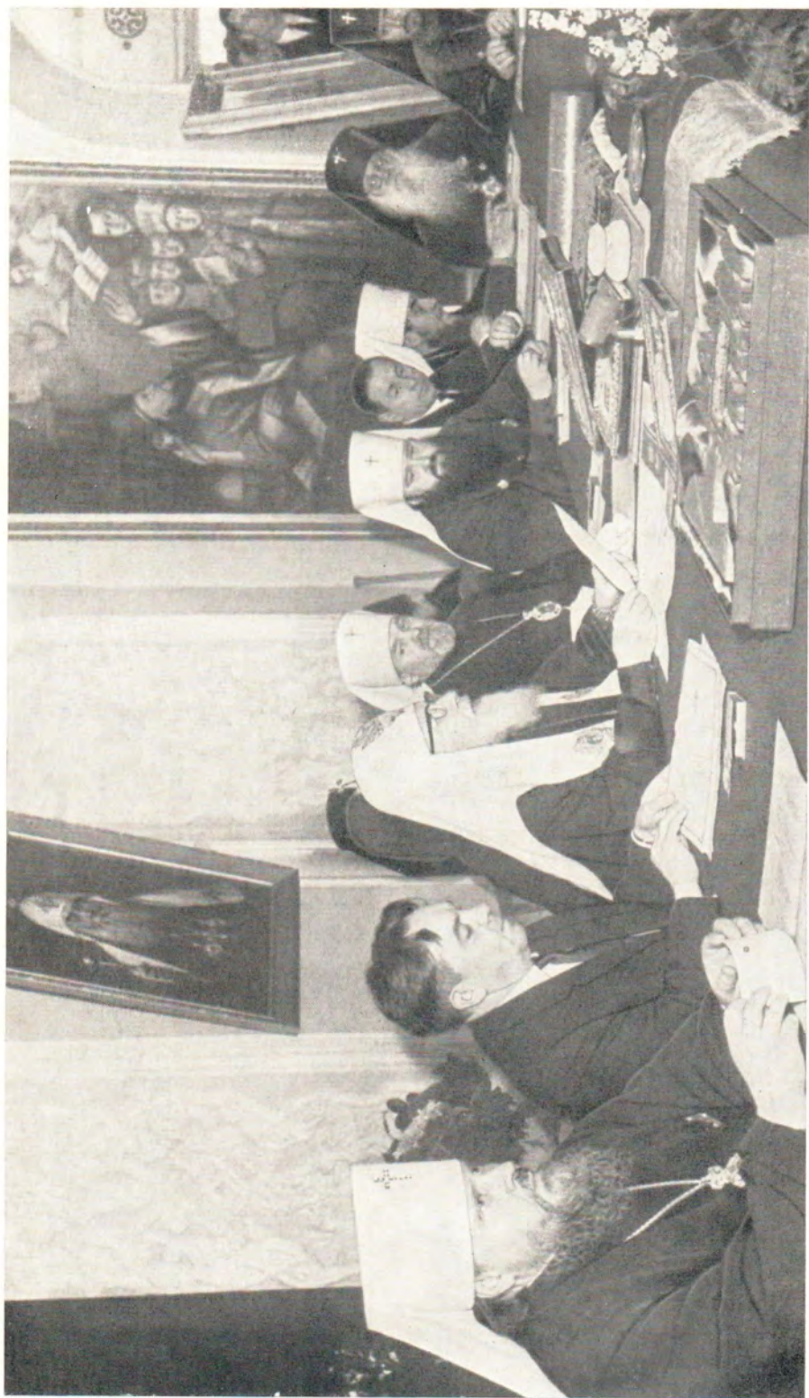
СВЯТЕЙШИЙ ПАТРИАРХ АЛЕКСИЙ ЧИТАЕТ ОТВЕТНУЮ РЕЧЬ