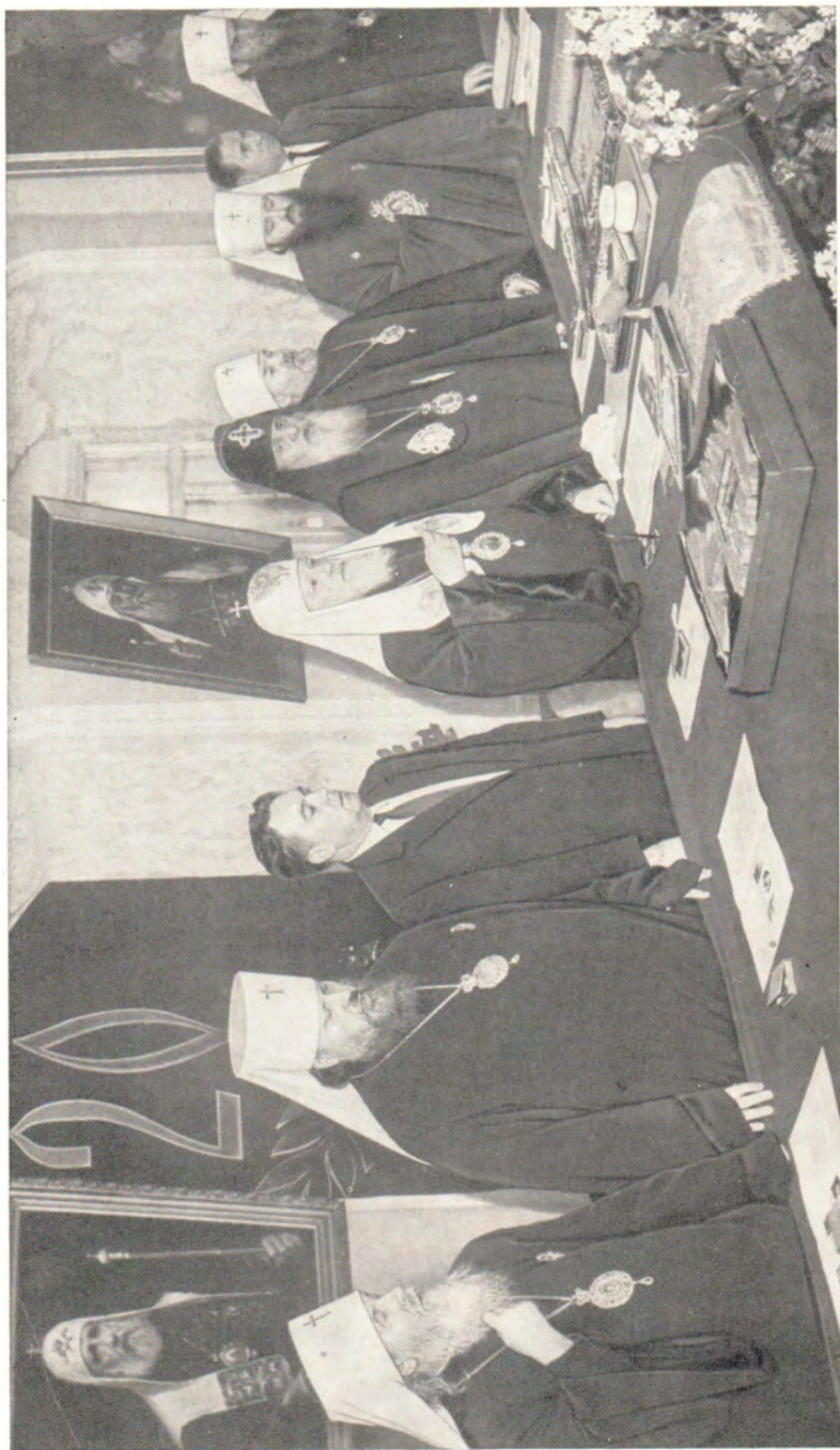
ЗАКЛЮЧИТЕЛЬНОЕ МНОГОЛЕТНЕ ЮБИЛЯРУ — СВЯТЕЙШЕМУ ПАТРИАРХУ АЛЕКСИЮ