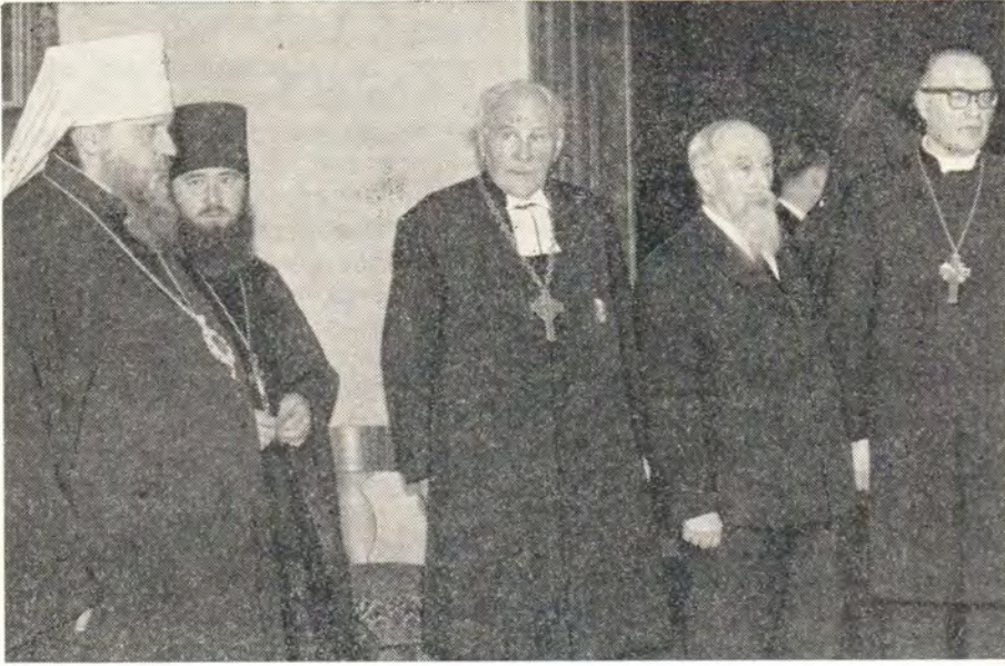
УЧАСТНИКИ ПРИЕМА. Слева направо: митрополит Крутицкий и Коломенский Пимен , архимандрит Ювеналий , Архиепископ Евангелическо-Лютеранской Церкви Латвии Густав Турс , председатель ВСЕХБ Я. И. Жидков , Архиепископ Евангелическо-Лютеранской Церкви Эстонии Ян Кийвит .