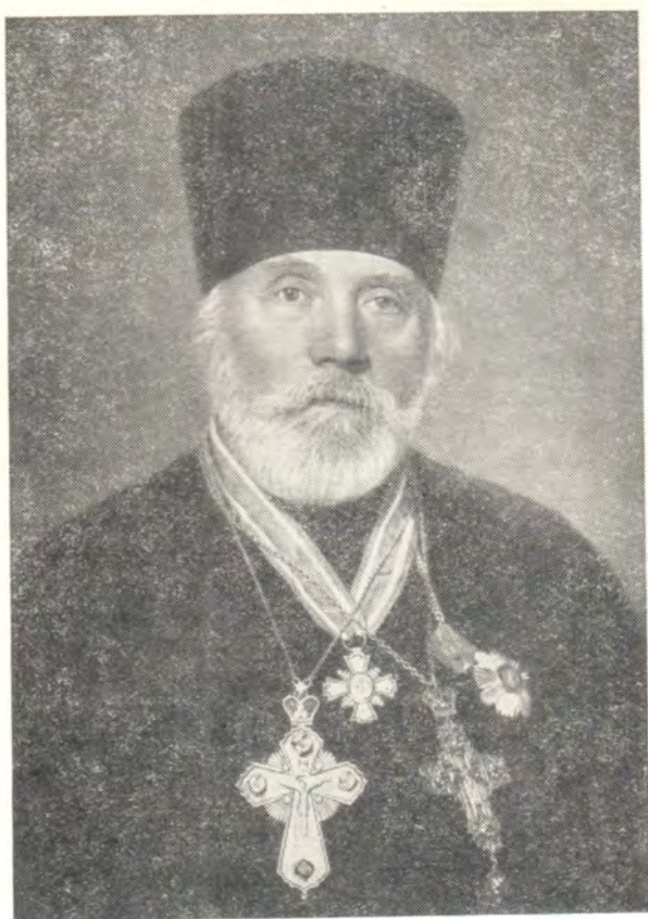
ПРОТ. М. К. СПЕРАНСКИЙ, РЕКТОР ЛЕНИНГРАДСКОЙ ДУХОВНОЙ АКАДЕМИИ