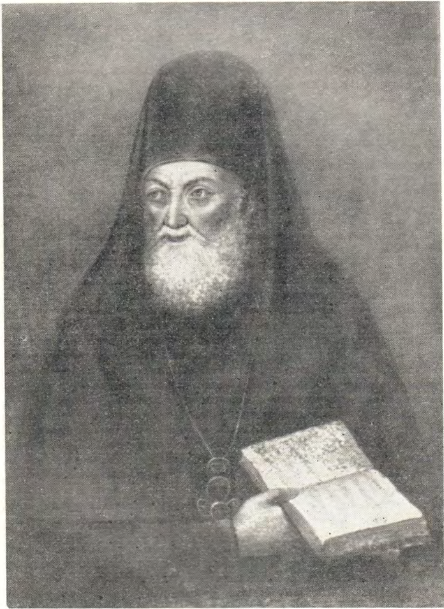
СВЯТ. МИТРОФАН, ПЕРВЫЙ ЕПИСКОП ВОРОНЕЖСКИЙ