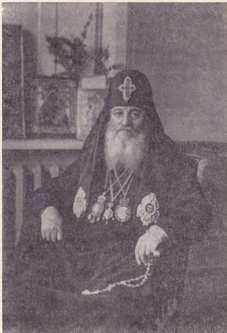
ЕФРЕМ II, СВЯТЕЙШИЙ КАТОЛИКОС-ПАТРИАРХ ВСЕЯ ГРУЗИИ

19 июля сего года Святейший Католикос-Патриарх всея Грузии Ефрем II прибыл к Святейшему Патриарху Московскому и всея Руси Алексию с первым визитом братского общения после своего вступления на патриарший престол. Между Патриархами состоялась душевная беседа.