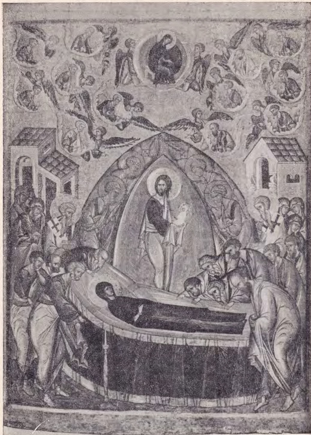
УСПЕНИЕ ПРЕСВЯТОЙ БОГОРОДИЦЫ (ИКОНА XV ВЕКА)