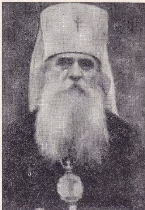
СЕРГИЙ (ТИХОМИРОВ), МИТРОПОЛИТ ЯПОНСКИЙ (1871—1945 гг.)

На Рождество 1911 года великий архипастырь еще нашел в себе силу служить торжественную литургию в своем великолепном токий-