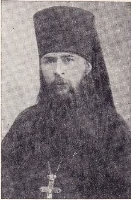
ИЕРОМОНАХ СЕРГИЙ (СТРАГОРОДСКИЙ) В БЫТНОСТЬ МИССИОНЕРОМ В ЯПОНИИ

Иеромонах Сергий советом Петербургской духовной академии был утвержден 9 июня 1890 года кандидатом богословия (первым из 47 кандидатов-магистрантов). В силу действовавшего академического