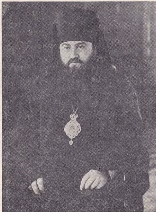
НИКОДИМ, ЕПИСКОП ПОДОЛЬСКИЙ

В субботу 9 июля 1960 года в Трапезном храме Троице-Сергиевой Лавры было совершено наречение архимандрита Никодима (Ротова) во епископа Подольского. Чин наречения совершали: Святейший Патриарх Московский и всея Руси Алексий, Высокопреосвященный Митрополит Гор Ливанских Илия (Карам), Преосвященные епископы: Сергиопольский Василий, Дмитровский Пимен и Можайский Стефан.