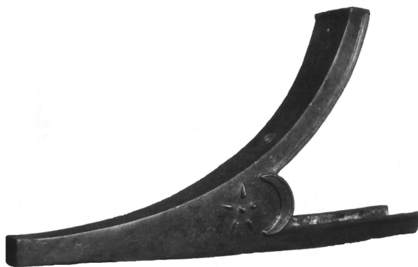
Рис. 1. Таран из Фанагории

В ряде случаев звезда вкупе с полумесяцем имеет шесть лучей. Подобный символ встречается на боспорских медных монетах рубежа эр с монограммой ВАМ и головой бога солнца Гелиоса. С высокой долей вероятности их можно отнести к чекану Аспурга, праправнука Митридата Евпатора, сына Динамии, до получения им царского титула в 13 г. н. э. На монетах с монограммой ВАЕ, также возможно