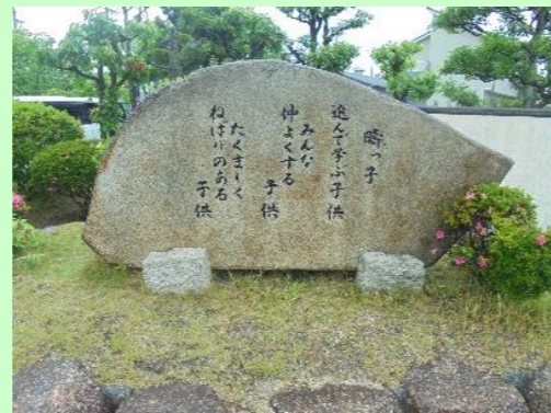
創立百二十周年記念碑