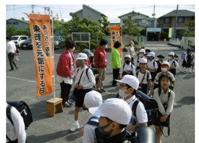
10日、25日はあいさつの日