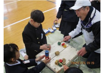
1年 むかしあそび体験