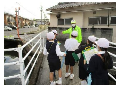
3年 安全マップづくり