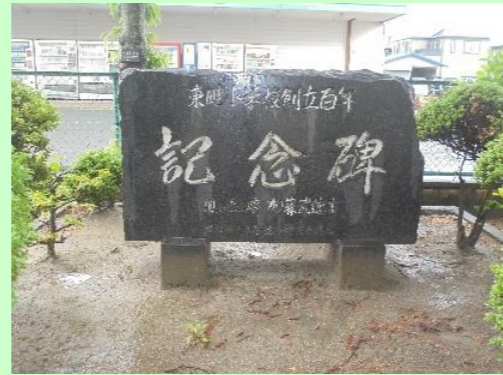
創立百周年記念碑